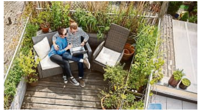
Balkone und Terrassen sind zum erweiterten Wohnraum geworden.

et. Ich möchte das um einen Faktor ergänzen, von dem ich glaube, dass er immens wichtig geworden ist: Die Möglichkeit, Kontakt zur Natur zu haben“, sagt Reinhardt. „Und sei es nur ein kleiner Balkon, auf dem man eine Liege aufstellen kann - auch das wird künftig den Wert einer Immobilie festlegen.“