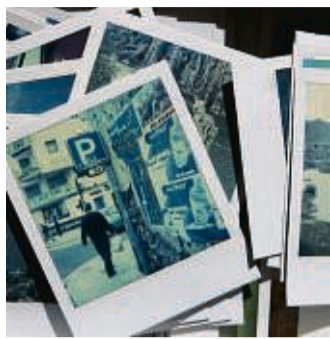
Alte Schule: Polaroids faszinieren mit ihrem Bildformat und ihren farblichen Eigenheiten.

Ein Druck auf den Auslöseknopf und Sekunden später rattert ein fertiges Foto aus dem Kasten. Die Idee ist alt. Und immer noch so brillant, dass Sofortbildkameras nicht totzukriegen sind.