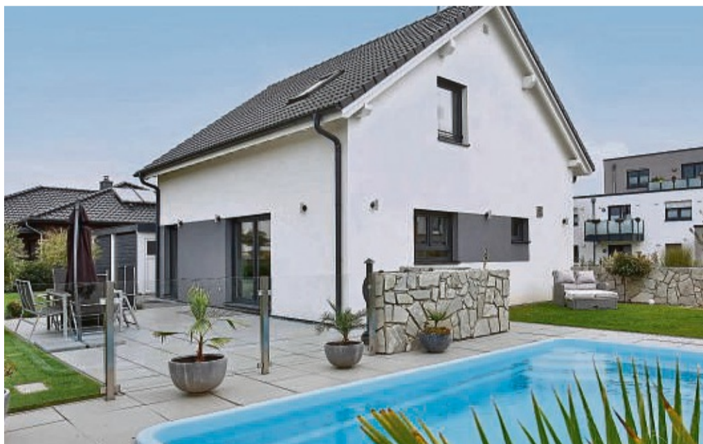
Fertighäuser verbinden ein schnelles Bauen mit hoher Kostensicherheit.

Eine Kostenbremse kann es bereits sein, die eigenen Wohnbedürfnisse realistisch einzuschätzen: Wie viele Zimmer und welche Grundfläche benötigt die Familie tatsächlich? Lassen sich Räume mehrfach nutzen, etwa als Homeoffice und Gästezimmer? Reicht zusätzlich zum Bad ein Gäste-WC aus oder soll es mit einer Dusche zum vollwertigen Zweitbad werden? Wer an diesen Stellen etwas abspeckt, kann die Baukosten erheblich senken, ohne später an Wohnkomfort einzubüßen. Viele Fertighäuser zum Beispiel bieten mit transparenten Preisen und Festpreisgarantie eine hohe Planungs- und Kostensicherheit – ohne teure Über-