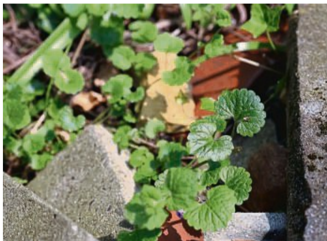
Der Gundermann ist würzig – und die Hummeln mögen ihn.