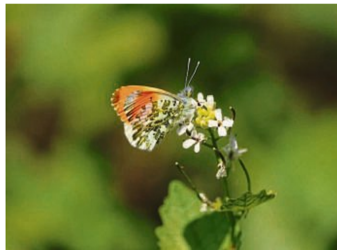
Viele Insekten lieben Pflanzen, die gemeinhin als Unkraut bezeichnet werden.

Das Gute: „Eigentlich muss man sich darüber kaum Gedanken machen, denn das Unkraut sucht sich selbst seinen Platz“, so Schwarzer. „Die Brennnessel findet ziel-sicher die stickstoffhaltigen Stellen im Garten, der Giersch den feuchten Schatten.“ Alternativ: Es gibt auf Wildpflanzen spezialisierte Gärtnereien, oft mit Online-shop.