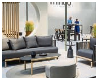
Diese Sofaecke wird auf der Messe Spoga+Gafa gezeigt.