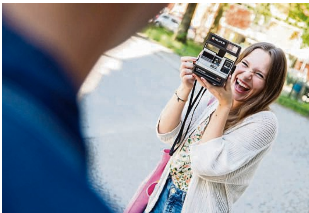
Egal ob Polaroid oder Fujifilm: Jedes Sofortbild ist und bleibt einfach einzigartig und hat einen ganz eigenen Charme.

„Die neuen Filme entstehen mit einer neuen Rezeptur. Es ist daher ein anderes Produkt als früher. Ein Polaroid bleibt aber einzigartig“, meint Kaps. „Polaroid bietet ein Unikat für einen besonderen Moment in einem Leben, es ist ein reales und selbst entwi-