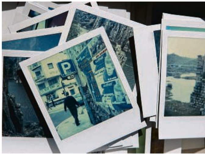
Alte Schule: Polaroids faszinieren mit ihrem Bildformat und ihren farblichen Eigenheiten.

Ein Druck auf den Auslöseknopf und Sekunden später rattert ein fertiges Foto aus dem Kasten. Die Idee ist alt. Und immer noch so brillant, dass Sofortbildkameras nicht totzukriegen sind.