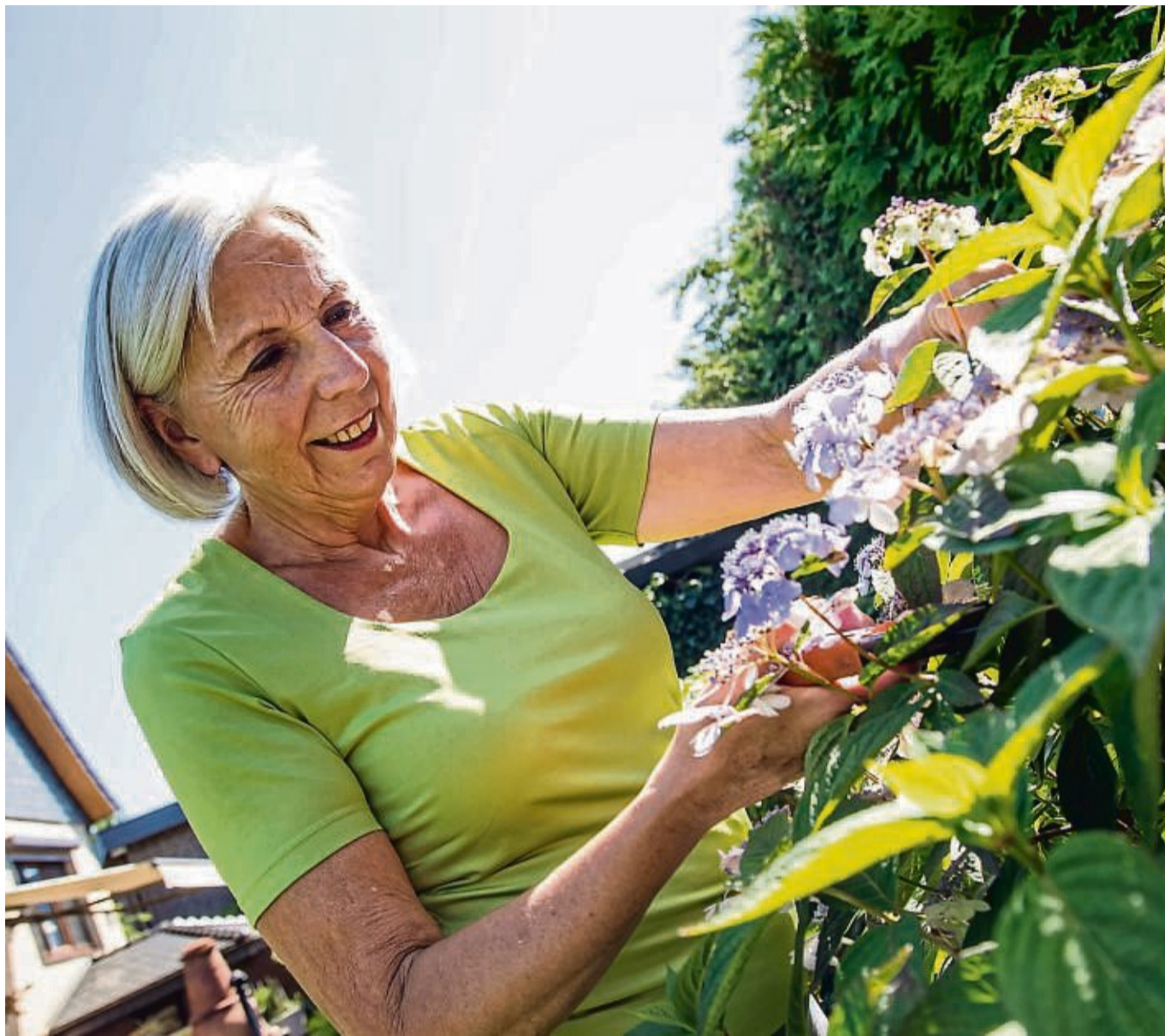
Der Höhepunkt des Gartenjahres ist zur Sommersonnenwende erreicht: Alles sprießt, vieles blüht und duftet.

„Das ist auch der Grund, warum man Pflanzen im Herbst nicht mehr düngt.