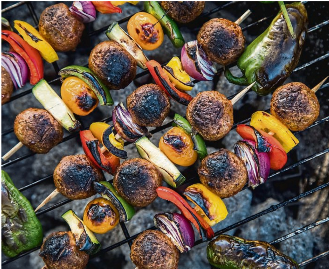
Gemüsereste können auf dem Grill lecker verwertet werden - etwa als Spieße.

Spargel könne den Verbraucherschützern zufolge