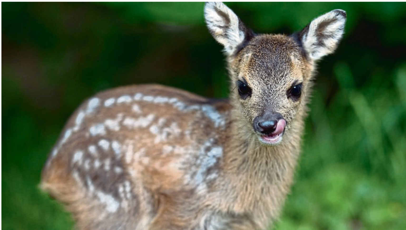
Ein wenige Tage altes Rehkitz: Um die Wildtiere vor dem Tod bei der Heuernte zu bewahren, wird im Bereich Witzhausen eine Drohne eingesetzt.

Mehrere Jagdgenossenschaften setzen auf Suche aus der Luft