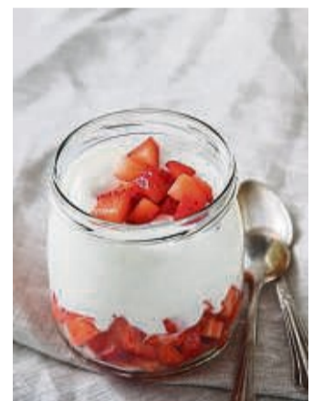
Lecker und kalorienarm: Erdbeeren mit Joghurt.

Zum Vanilleeis, auf dem Tortenboden, im Milchmixgetränk: Die Erdbeere dient oft als Zutat klassischer Süßspeisen mit viel Zucker. Wer auf die schlanke Linie achtet, wird oft passen wollen. Dabei ist sie nach Angaben des Bundeszentrums für Ernährung (BZfE) eine sehr kalorienarme Frucht. 100 Gramm enthalten demnach nur etwa 32 Kilokalorien (kcal). Zum Glück gibt es für figurbewusste Erdbeerefans auch leckere Alternativen.