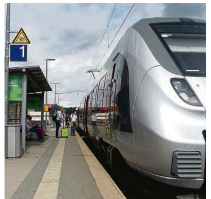
Ein Zug von Abellio in Hann. Münden: Kinder können nun an einem Malwettbewerb der Verkehrsgesellschaft teilnehmen.

Informationen zum Wettbewerb finden interessierte Kinder und ihre Eltern im Internet unter der Adresse: gut-mit-zug.de/malwettbewerb