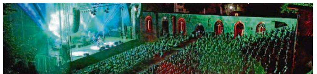
Stimmungsvolle Impressionen vom Calwer Klostersommer: In diesem Jahr kann man Top Acts wie Udo Lindenberg und Nico Santos auf der Bühne erleben.

Kultursommer Nordschwarzwald: Ausstellungen, Theater, Konzerte und Lesungen