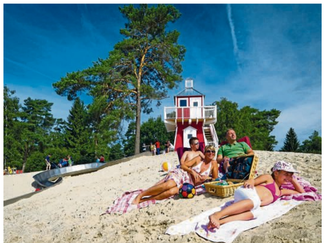
Strandurlaub in der Lüneburger Heide: Niedersachsen hält für Camper eine große Landschaftsvielfalt bereit.

Niedersächsische Vielfalt: Stadt, Land, Fluss, Berge und Meer