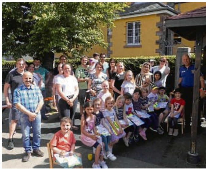
Stolze Kinder mit dem Fußgänger-Führerschein an der Kita Kesperknirpse.

„Um die angehenden Schulkinder bereits auf ihre Rolle als Verkehrsteilnehmer vorzubereiten, führten wir in unserer Einrichtung ein Projekt zur Verkehrserziehung durch“, berichtet Kita-Leiterin Andrea Winkler. In aufeinander folgenden Einheiten seien verschiedene Bereiche der Sicherheit als Fußgänger im Straßenverkehr bearbeitet worden. Dabei standen unter anderem die Fragen an: Wie werde ich dort gut gesehen?, Wie verhalte ich mich auf dem Gehweg?, Wo bleibe ich am Fahrbahnrand stehen, um die Straße sicher zu überqueren?