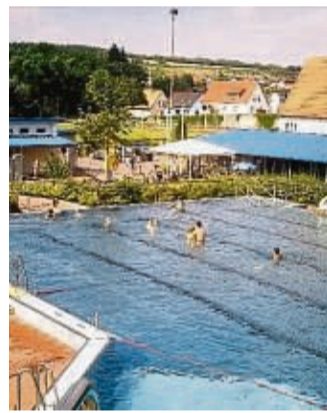
Das Freibad lockt zum Sprung ins kühle Nass.

Kulturhungrige werden in Göttingen, Fulda oder Kassel „auftanken“ können. Zu dieser Aufzählung gehört natürlich u.a. die Goethe- und Schillerstadt Weimar. nh