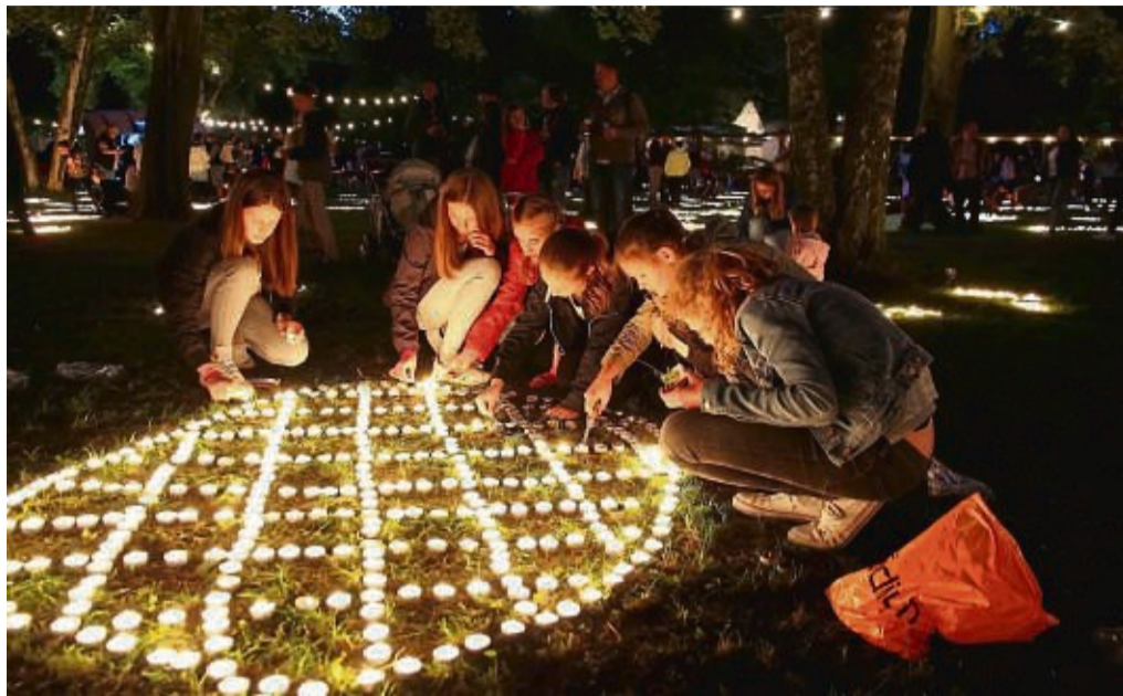
20 000 Lichter sollen am Samstagabend der Schlosspark erhellen.

Festplatz: • 18 Uhr: Eröffnung der Fahrgeschäfte mit Schaustelleraktion „Gewinnen Sie Ihre Strandfesttaler“. Verlosung ab 21.45 Uhr, nur Anwesende können gewinnen • ab 20 Uhr: Reiner-Irrsinn-Show im Festzelt. Die Band beschreibt sich selbst als Par-