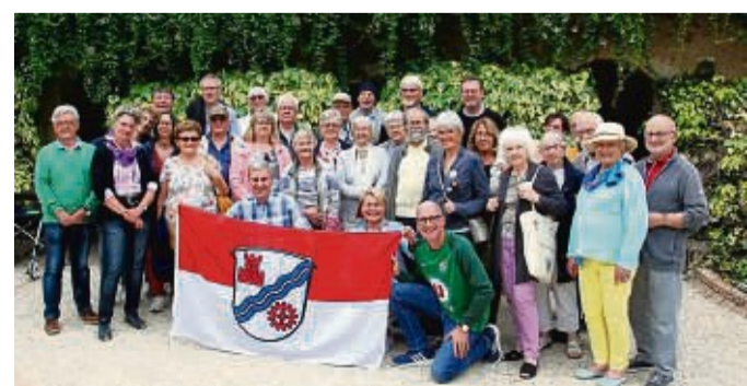
Franzosen und Deutsche beim Winzer Lelais in Ruillé sur Loir. Die Abordnung aus Ludwigsau verbrachte über das Pfingstweekenende schöne Tage bei den französischen Freunden in Changé. Höhepunkt des Besuchs waren die Feierlichkeiten anlässlich des 25-jährigen kommunalen Partnerschaftsjubiläums.