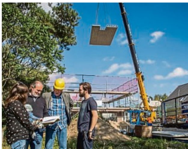
In vielen Bau- und Leistungsbeschreibungen fehlen wesentliche Angaben zum Hausprojekt, wie zu verwendende Hersteller bzw. Modelle.

Der Gesetzgeber macht im Rahmen des Verbrauchervertrags mittlerweile klare Vorgaben, was eine Baubeschreibung enthalten