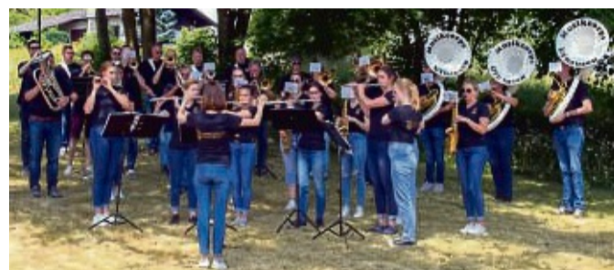
Das Musikcorps Ufhausen unterhielt die Gäste mit mehreren Musikstücken in Soislieden.