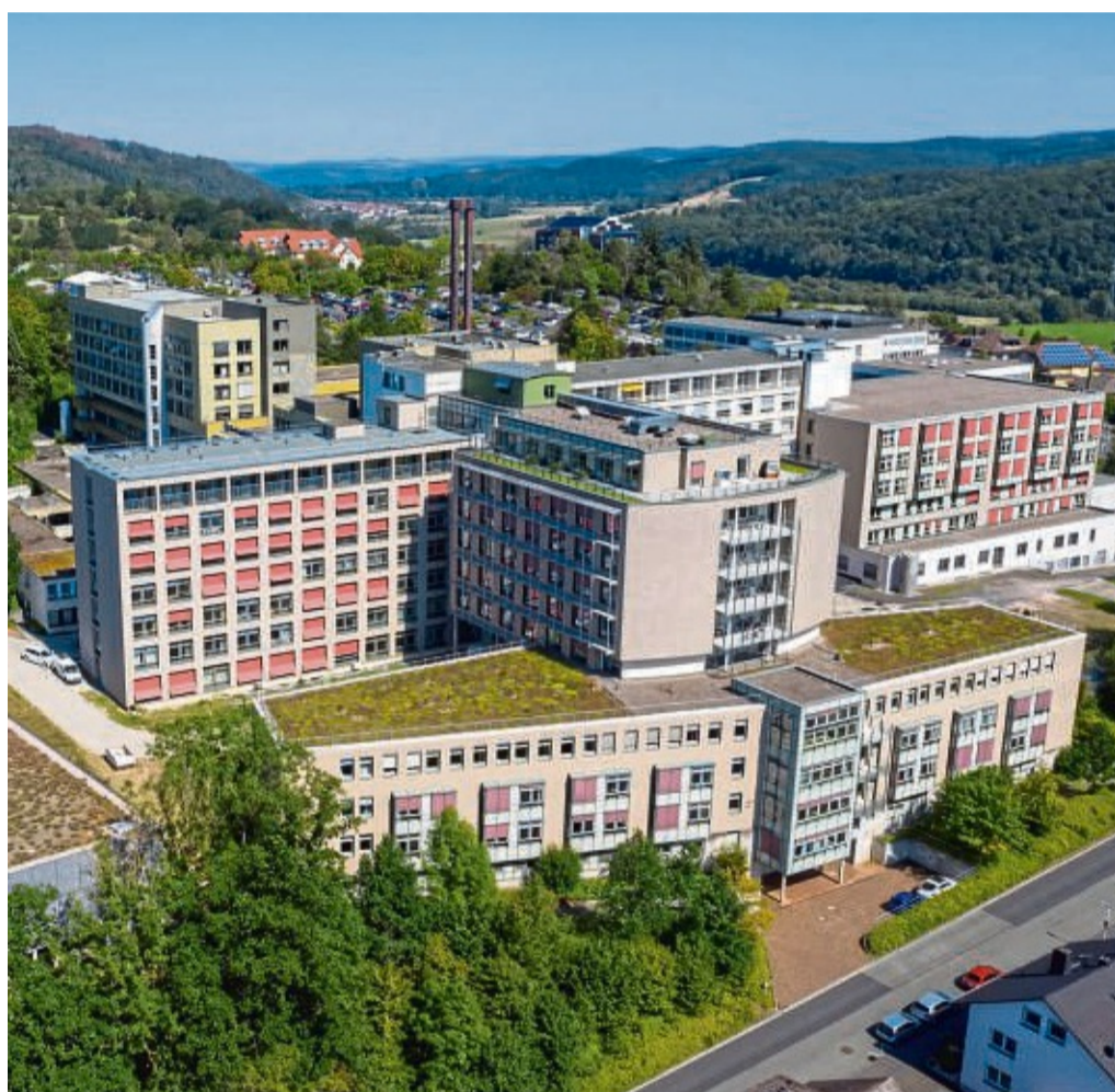
Bald einziger Standort des Ärztlichen Bereitschaftsdienstes im Landkreis: Das Klinikum in Bad Hersfeld. Ende des Monats schließt die Kassenärztliche Vereinigung ihr Angebot im Rotenburger Kreiskrankenhaus.

Bad Hersfeld/Rotenburg – Schlechte Nachrichten für Patienten in Rotenburg: Die Kassenärztliche Vereinigung (KVH) macht den Standort des Ärztlichen Bereitschaftsdienstes (ÄBD) im Kreiskrankenhaus Ende des Monats dicht. Im Kreis Hersfeld-Rotenburg wird es ab Juli dann nur noch einen Standort geben. Wer außerhalb der regulären Praxissprechzeiten akut erkrankt, wird dann über den ÄBD im Bad Hersfelder Klinikum versorgt.