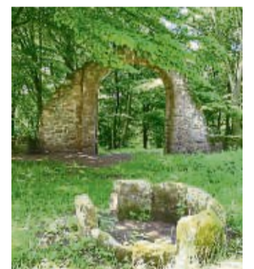
Der noch erhaltene Torbogen ist das Wahrzeichen der Gemeinde Wildeck.

Mit wachsendem Wald wurden die Innenräume dann zunehmend feucht und die Gäste fühlten sich nicht