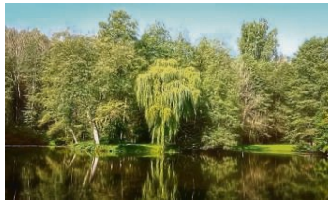
Der Inselteich ist ebenfalls ein besonderer Anziehungspunkt und lädt zum Entspannen ein.