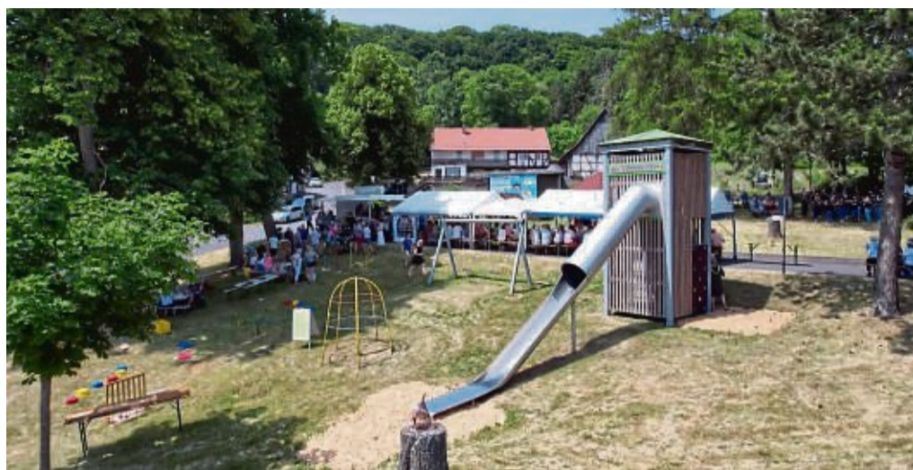
Am Fuße des Soisbergs und neben dem „kleinen Soisbergturnm“ mit Rutsche feierte die Bürgerinitiative Soisbergturnm ihr 25-jähriges Bestehen.

Hohmann wies dabei noch auf kommende Veranstaltungen in der engeren Region hin. So feiert an diesem Sonntag, 26. Juni der Nachbarort