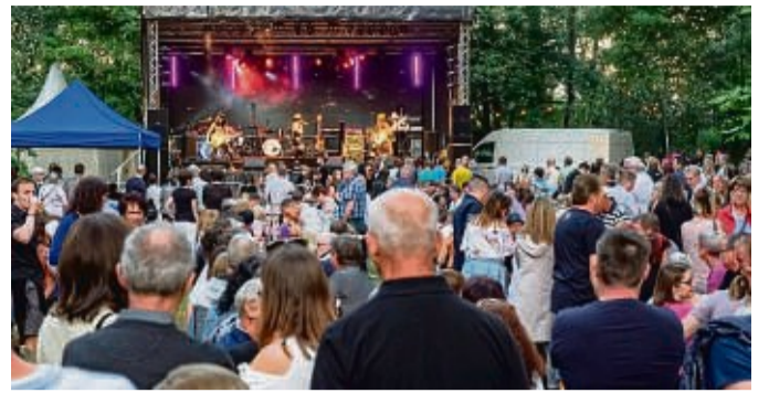
Das Schlossparkfestival gehört zu den Höhepunkten des Strandfestes. Unser Bild entstand 2018.

• ab 14 Uhr: Festumzug ab Mündershäuser Straße Festplatz • ab 14 Uhr geöffnet