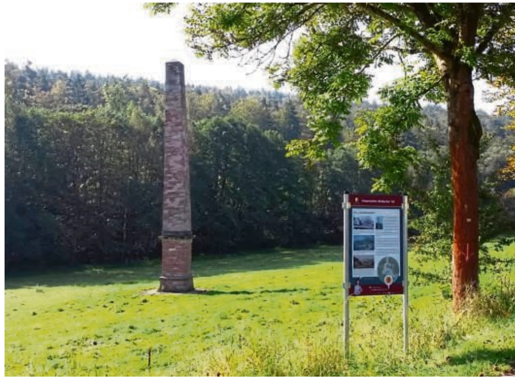
Der Obelisk ist ein Highlight auf den Wanderwegen.

Ein besonderes „Schmankerl“ bietet der „Rhäden“: ein über 200 ha großes Niederungsgebiet in einer durch Salzauslagerungsprozesse und tektonische Vorgänge