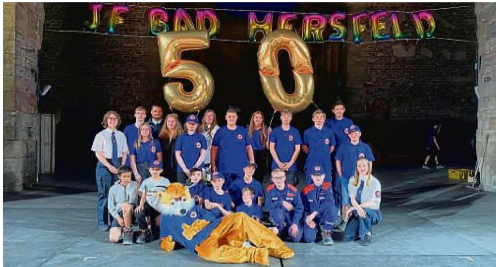
Die Bad Hersfelder Jugendfeuerwehr feierte ihr 50-jähriges Bestehen in der Stiftsruine.