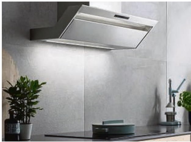
Mit schrägen Dunstabzugshauben läuft niemand mehr Gefahr, sich den Kopf zu stoßen.

Am Anfang der Kaufentscheidung steht die Wahl der Betriebsart: Um- oder Abluft oder ein Hybridmodell, das bedarfsgerecht beide Varianten bietet? Unkompliziert in der Montage und deshalb am häufigsten verbreitet sind Umlufthauben. Sie leiten den Kochdunst durch Fett- und Geruchsfilter und geben die so gereinigte Luft anschlie-