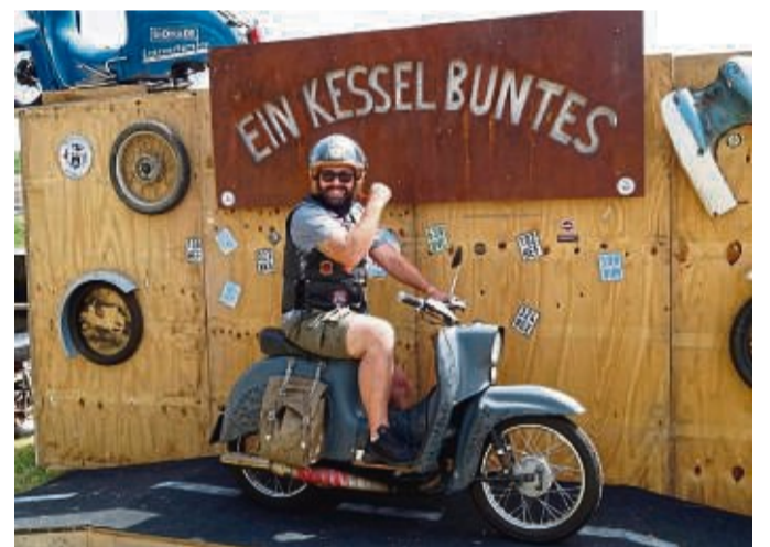
Moped, Motorrad, Old- oder Youngtimer – alle Teilnehmer und Besucher des Drei-Länder-Marathons und von „Ein Kessel Bunt“ verbindet das gemeinsame Hobby und die Liebe zu alten Maschinen.

vom MSC Bad Hersfeld und den Mückenstürmer-2-Taktern. Da der Platz am Eichhof nach drei erfolgreichen Veranstaltungen nicht mehr ausreichte, legte man das beliebte Old- und Youngtimer-Event „Ein Kessel Bunt“ einfach mit dem Drei-Länder-Moped-Marathon zusammen. „Zwei Veranstaltungen