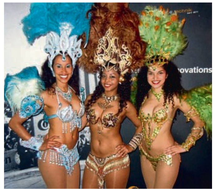
Bei der 100-Jahrfeier des FC Wehrda sorgen brasilianische Tänzerinnen für gute Stimmung.