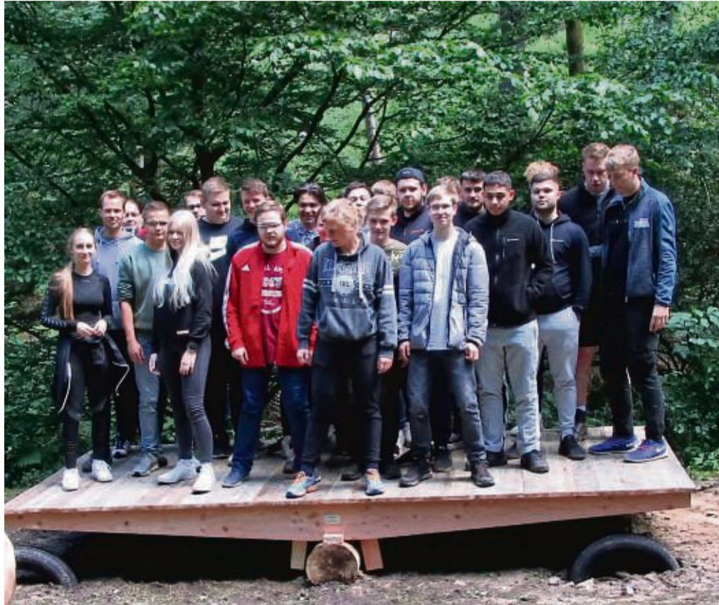
Conti-Azubis erleben eine gemeinsame Outdoorwoche am Sport-Camp Edersee.

In die drei Schwerpunktbereiche technische und kaufmännische Ausbildung sowie duale Studiengänge aufgliedert, bietet Continental jedes Jahr 50 neuen Auszubildenden einen Einstieg in elf Ausbildungsberufe. Aktuell befinden sich 150 Personen in einer Ausbildung oder Studium bei Continental in Korbach. Im technischen Be-