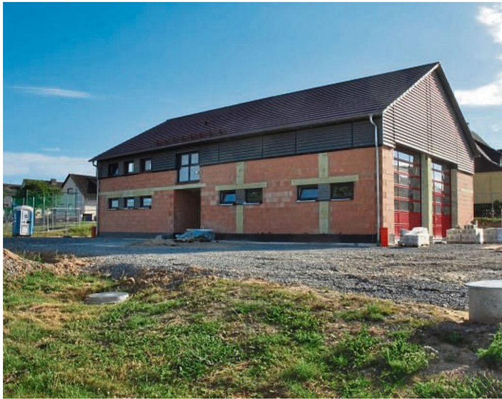
Das Feuerwehrhaus Schmillinghausen soll im Herbst 2022 bezugsbereit sein. Anfang Mai 2021 war der erste Spatenstich. Die Baukosten werden mit 950 000 Euro beziffert.