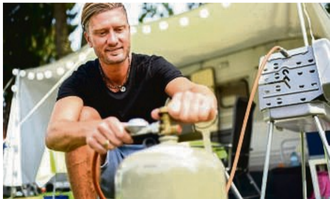
Sparsamer Spaß: Noch mehr Freude am Grillen gibt es, wenn der Gasvorrat länger hält.