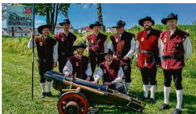
Die Kanonengruppe St. Barbara hat bereits zu Jahresbeginn das Freischießen mit lauten Böllerschüssen angekündigt.

Königsschießens über. Auf dem Festplatz finden Preis-schießen und Gerichtsverhandlungen statt, im Schießstand ermitteln die Königsanwärter ihren besten Schützen, der anschließend in der Halle zum neuen König proklamiert wird. Um 18 Uhr finden der Rückmarsch des Festzuges und das Einbringen der Fahnen statt bevor ab 20 Uhr die Big Band Battenberg zum Schützenball aufspielen wird. Heike Saure