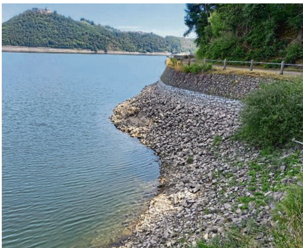
Am Hammerbergweg zwischen Sperrmauer und Rehbach lässt sich gut ausmachen, wie stark der Pegel abgesunken ist.

Nach dem feuchten Jahr 2021 holt das alte Thema Wassermangel nun auch den Edersee wieder ein. Seit Wochen bleibt ergiebiger Regen aus. Die Gewittertage bringen allenfalls für einen Tag etwas Entlastung. Der Wasserstand sinkt rasch, weil die