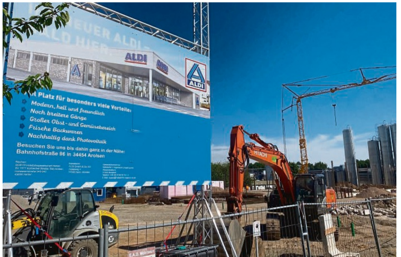
Hier war früher eine freie Tankstelle: Neubau des Aldi-Marktes an der Korbacher Straße in Bad Arolsen.