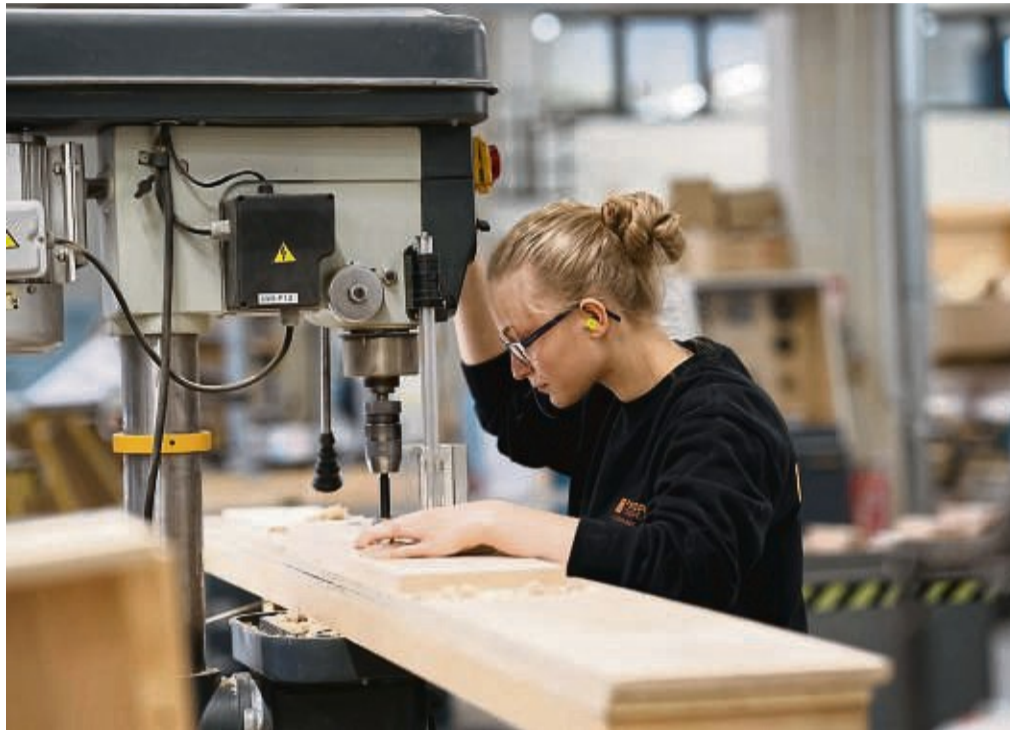
Mit klassischem Handwerk moderne Häuser bauen: Berufsbilder bei FingerHaus sind Berufsbilder mit Zukunft.

Die Ausbildungsberufe gliedern sich in sieben handwerkliche Berufe (Fliesen-, Platten- und Mosaikleger, Zimmerer, Dachdecker, Holzmechaniker, Tischler, Maler und Lackierer, Anlagenmechaniker für Sanitär-, Heizungs- und Klimatechnik), zwei technische (Bauzeichner, Fachinformatiker für Systemintegration) und drei kaufmännische Berufe (Industriekaufleute, Kaufleute für Marketingkommunikation, Fachkräfte für Lagerlogistik). Die Ausbildungsberufe werden ab August 2022 ergänzt durch die Ausbildung zum Tischler. Spaß an der Arbeit, Zukunftssicherheit und ein gutes Betriebsklima - Auszubildende von heute wollen sich an ihrem