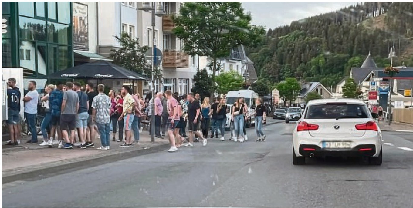
Volle Bürgersteige, Straßen und Gaststätten sah Willingen schon am Freitag vor „Viva Willingen“. Am Festival-Wochenende sorgten Auswüchse dann für Aufruhr.