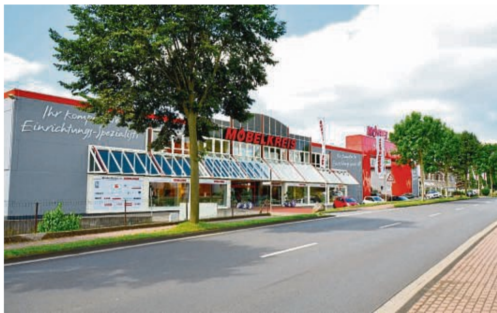
Möbelkreis begleitet intensiv die Ausbildung des künftigen Fachpersonals in den kaufmännischen und handwerklichen Bereichen.