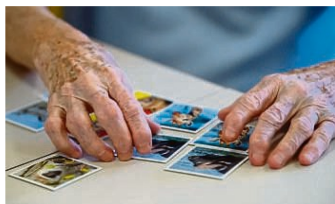
Mit zunehmendem Alter lassen die Sinne und kognitiven Fähigkeiten nach. Bei den meisten Menschen äußert sich dies durch leichte Verwirrung oder Vergesslichkeit.

Häufig stellen ein nachlassendes Erinnerungsvermögen, Schwierigkeiten beim Sprechen oder auch eine allgemeine Verwirrtheit erste Merkmale für Demenz dar. „In späteren Stadien fällt es Betroffenen zunehmend schwer, alltägliche Aufgaben