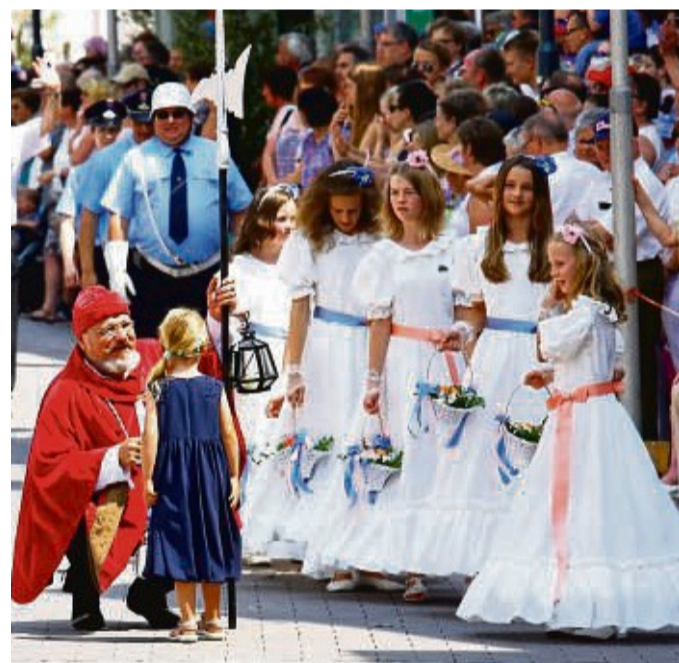
Darauf haben alle Dietemänner- und frauen lange gewartet: Das Johannistag findet wieder so statt, wie alle es lieben.

Schon früh am Morgen beginnt das Fest mit dem Wecken der Spielmannszüge, die ab sechs Uhr durch die