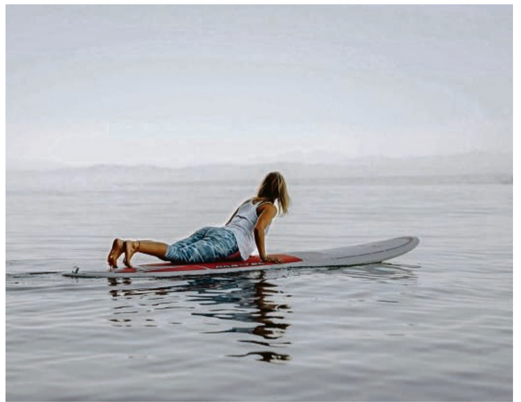
Am Bodensee kommen nicht nur Wassersportler genussvoll auf ihre Kosten.