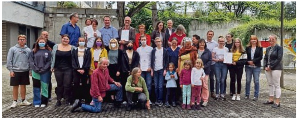
Jedes Projekt gewürdigt: Mit insgesamt elf Projekten haben sich Schulen, Verein und Verbände um den Umweltpreis des Kreises beworben.

Windprojekt der Johannisbergschule Witzhausen: Bevor die Johannisbergschule am Montag auch zu den Hauptgewinnern des Umweltpreises im Kreis gekürt wurde, räumten die Schüler jüngst den Titel Hessischer Energiesparmeister ab. Jetzt waren sie mit ihrem sogenannten Windprojekt erfolgreich, bei dem sie aus Alltagsgegenständen fünf Windräder entwickelten, konstruierten und bauten. „Die Jugendlichen haben sehr coole Sachen entwickelt“, sagte eine Lehrerin. An dem Projekt waren insgesamt 118 Jugendliche beteiligt.