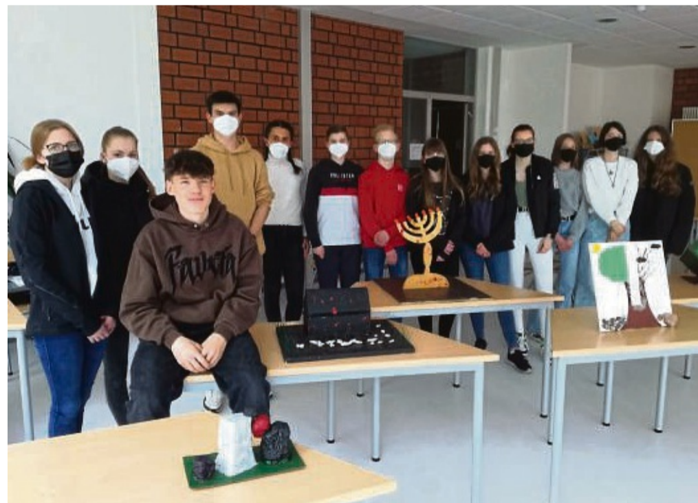
Haben Holocaust-Mahnmale entworfen: Schüler der Klasse 10aG an der Adam-von-Trott-Schule.

Von einer gebrochenen Menora, einer schwarzen KZ-Baracke und einem Gedächtniswürfel, der zum Beispiel an den Theologen Dietrich Bonhoeffer erinnert, gehen die gestalterischen Ideen hin zu einer Darstellung des einstürzenden Naziregimes oder eines zersplitterten Baums, der die Zerrissenheit der Gesellschaft im Nationalsozialis-