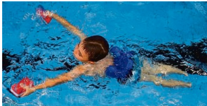
Schwimmen lernen: Im Freibad in Sontra gibt es Anfängerkurse.