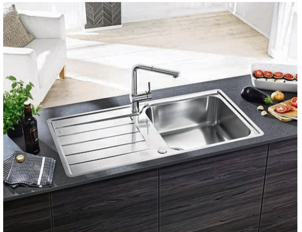
Robuster Edelstahl ist der Klassiker unter den Spülenmaterialien.

Granit: Granit ist extrem hart - und so auch sehr strapazierfähig, bruch- und kratzfest. Die Auswahl an außergewöhnlichen Farben ist bei Granit-Spülen aus Quarzkomposit besonders groß. Das Material ist farb- und UV-beständig. Glatte Oberflächen sind angenehm temperiert. Gleichzeitig sind sie unempfindlich gegenüber Hitze oder Kälte. Das Material ist zudem nachhaltig - es besteht zu 99 Prozent aus natürlich nachwachsenden Rohstoffen und kann in einen geschlossenen Recycling-Kreislauf zurückgeführt werden. tmn