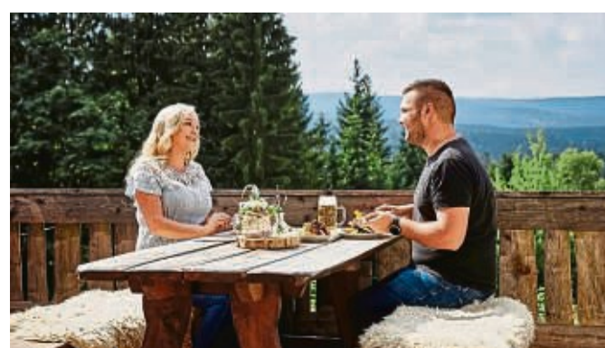
Typisch Dreiländereck: ausruhen, genießen und die Landschaft auf sich wirken lassen.

Hier einige Highlights: 1. Das 600 Kilometer lange Wanderwegenetz ist ausgeschildert und bietet immer wieder spektakuläre Ausblicke. Mehr Infos bietet