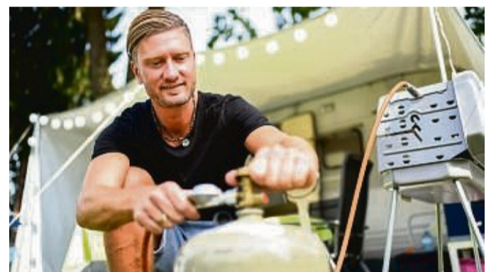
Sparsamer Spaß: Noch mehr Freude am Grillen gibt es, wenn der Gasvorrat länger hält.