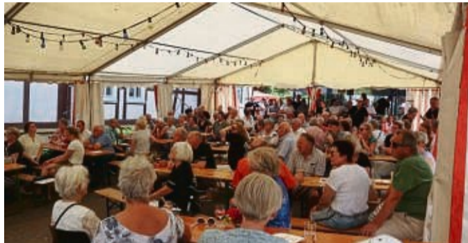
Gut besucht: Viele Gäste kamen, um das große Jubiläum gemeinsam zu feiern.