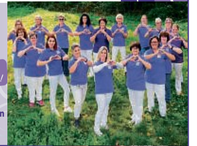
Unser Team für Sie in Gemeinden!

Lindenstraße 17 • 35285 Gemünden Tel. 0 64 53 / 9 10 55 www.diakoniegesellschaft.de