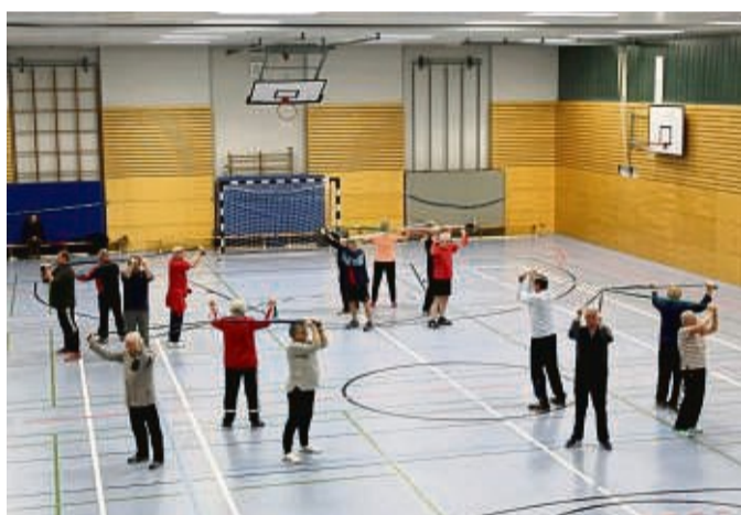
Herzsportgruppe Frankenberg: Weil der Übungsleiter aufgehört, muss die Sparte zum 30. Juni aufgelöst werden.

Um die Herzsportgruppe zu leiten, bedürfe es einer speziellen Schulung. „Der Lehrgang ist nicht leicht“, räumt Bende ein. Man benötige zwar keine medizinischen