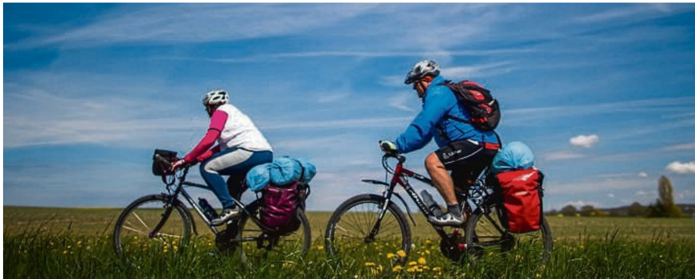
Auf großer Fahrt: Für Radreisen gibt es viele verschiedene Anbieter, die den Radelnden unterschiedliche Schwerpunkte anbieten - von Sport bis Genuss.