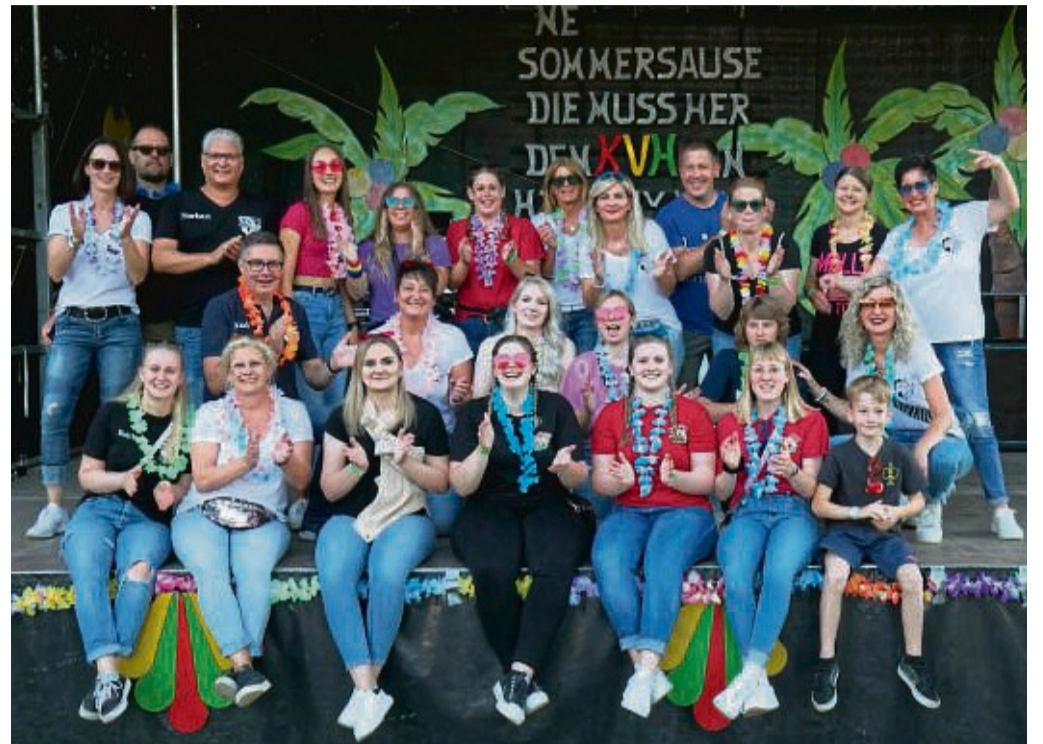
Die Freude war groß bei der Sommersause der Karnevalisten, das in Holzhausen auf dem Vereinsgelände der Karnevalsvereinsgemeinschaft Holzhausen (KVH) stattfand.

Megastimmung bei der Sommersause in Holzhausen