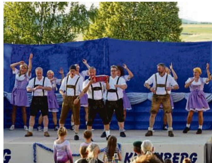
Gehört zum Kirchberger Karneval einfach dazu: Das Männerballett im bayerischen Outfit.

Kirchberger feiern ausgelassen auf der Festwiese