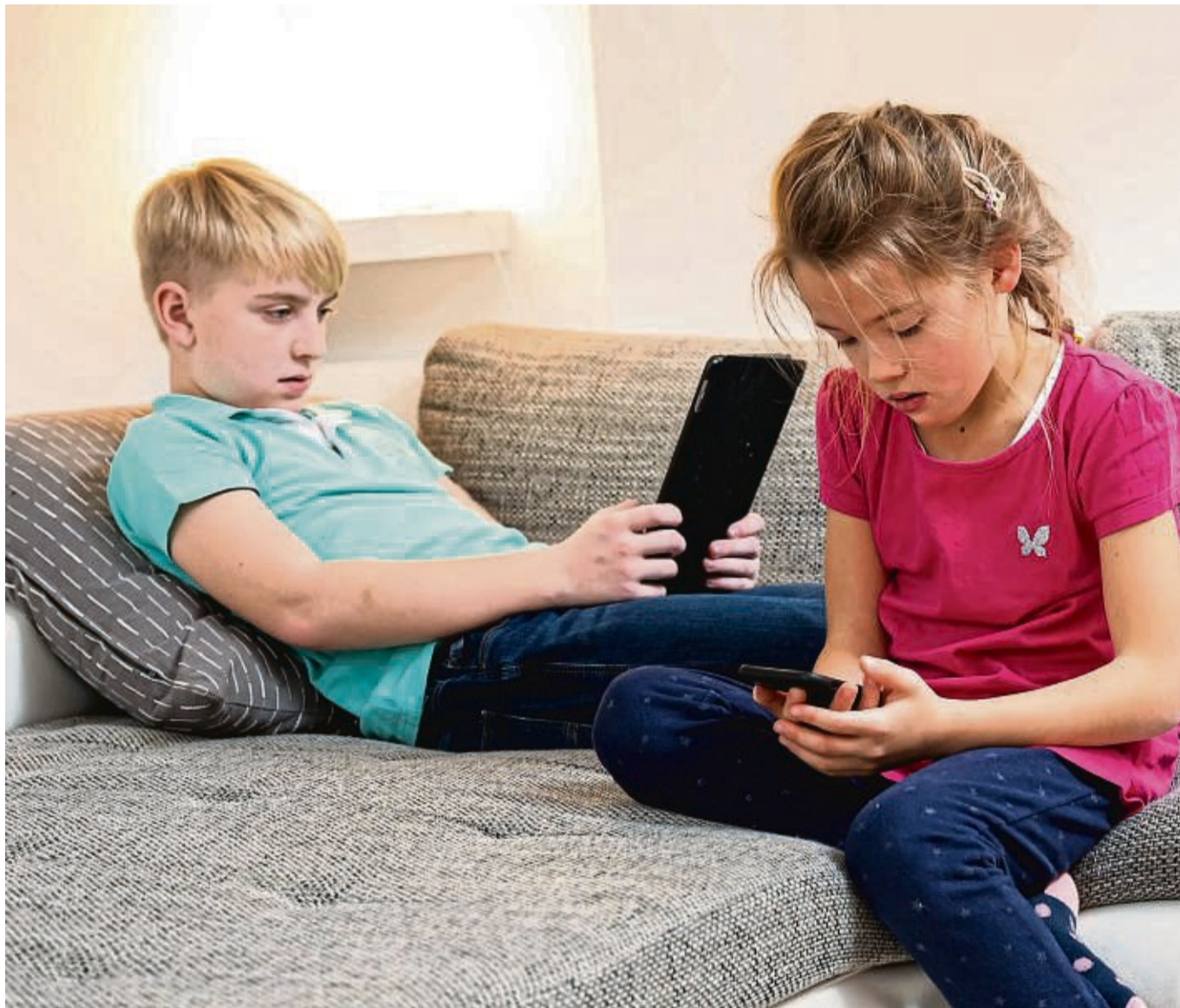
Damit Kinder mit Social Media richtig aufwachsen, sollten Eltern von Beginn an wachsam sein und Regeln setzen.

Auch über die Gefahren des Internets und Social Media von jugendgefährdenden Inhalten über den Umgang mit Fotos und Videos, Cybermobbing, übertriebener Selbst-