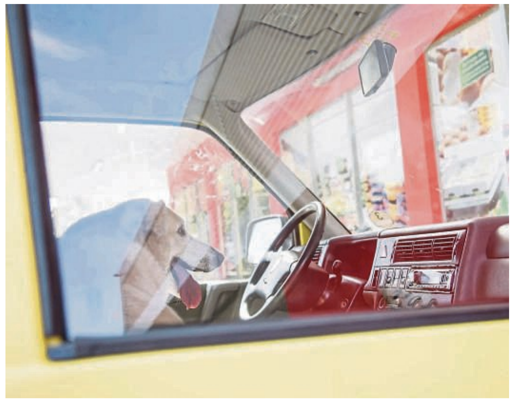
Gefährliches Gefängnis: Werden Kinder und Tiere im Sommer im Auto zurückgelassen, kann der sich aufheizende Innenraum schnell zur Gefahr werden.

Blieben die Fenster zu, stieg die Temperatur schon nach zehn Minuten auf 38 Grad. Und nach 20 Minuten zeigte das Thermometer 45