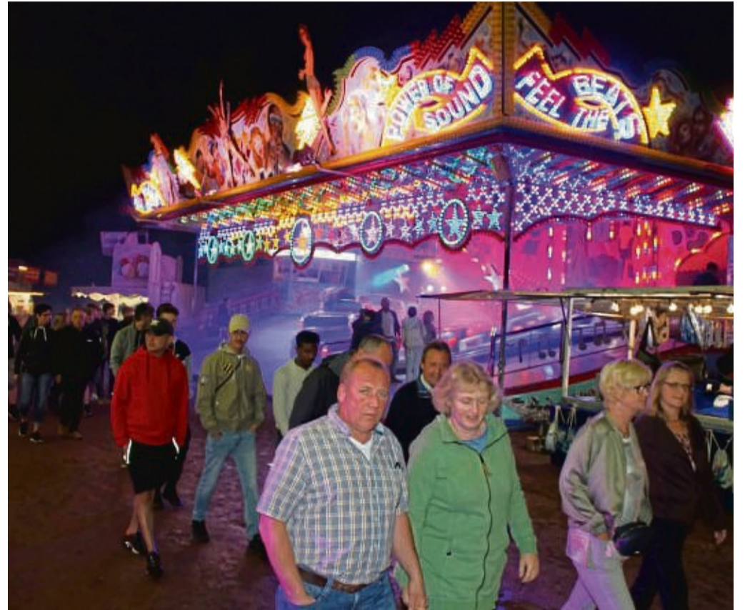
Vergnügen für Jung und Alt: Ein Bummel über den Festplatz ist für die Grebensteiner ein Muss. Hier kann man Schauen, Spaß haben und mit Freunden ein Gläschen heben.

Bereits vor der offiziellen Eröffnung am Freitag auf dem Marktplatz samt Bieranstich am Brunnen vor dem Burgtor öffnen die Fahrgeschäfte und Stände um 16 Uhr mit dem Markttreiben. Eines der ersten Highlights ist der Fackel- und Lampionumzug durch die Altstadt. Es folgen Partyabende mit illustren Gästen wie „Echt Stark“ und der „Familie Hossa“, die 10. Festplatzolympiade, der Familiennachmittag auf dem Festplatz mit ermäßigten Preisen und vieles mehr. Die Singstars stellen sich erstmals dem Publikum