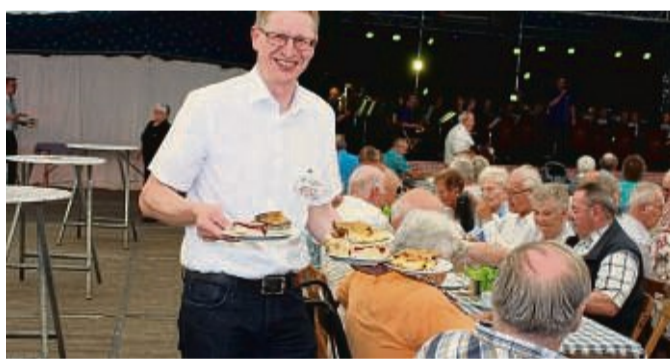
Beim Kaffeeklatsch lässt es sich der Bürgermeister nicht nehmen, die Senioren selbst zu bedienen.

Nach dem großen Erfolg in den vergangenen Jahren, wird es auch in diesem Jahr für die etwas reiferen Semester, aber natürlich auch für jüngere Gäste, den Musikalischen Kaffeeklatsch am Freitag geben. Extra dafür werden Busse der Firma Käckel-Reisen einen Pendelverkehr zwischen den Ortsteilen und dem Festplatz einrichten. Im Zelt erwartet die Gäste neben Kaffee und Kuchen zum attraktiven Preis, als musika-