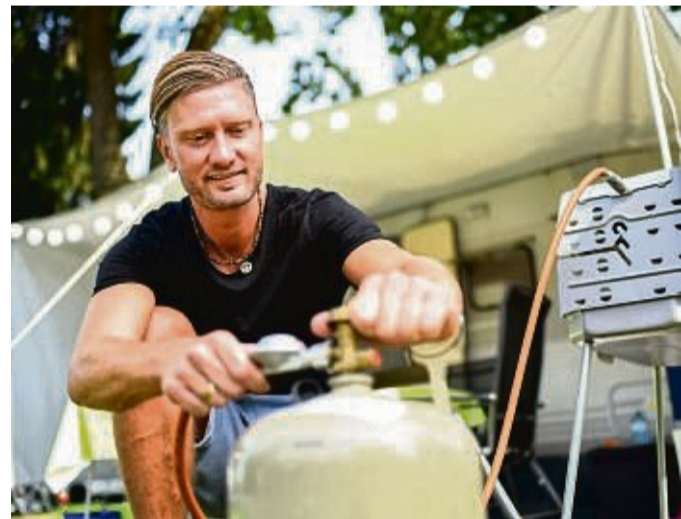
Sparsamer Spaß: Noch mehr Freude am Grillen gibt es, wenn der Gasvorrat länger hält.