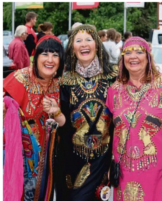
Bunt und fröhlich: Die Besucher können sich auf ein tolles und ausgelassenes Fest freuen.