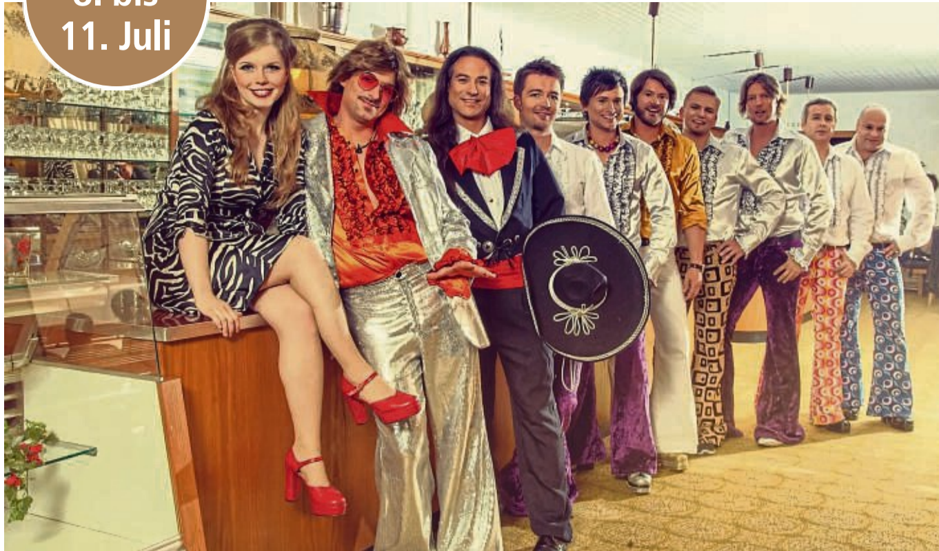
Mitreißend: Die Familie Hossa lädt ein in ihr mobiles Wohnzimmer und präsentiert Songs aus der Zeit der der Neuen Deutschen Welle und deutschsprachige Party-Hits der 80er.