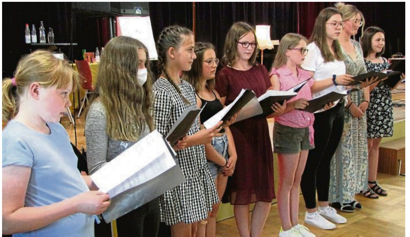
Beifall für schönen Gesang: Schülerinnen bei ihrem Auftritt am bunten Abend der Rhenanus-Schule.