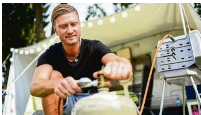
Sparsamer Spaß: Noch mehr Freude am Grillen gibt es, wenn der Gasvorrat länger hält.