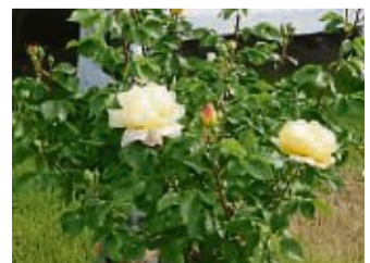
Containerrosen im Topf kommen meist bereits blühend beim Hobbygärtner an.