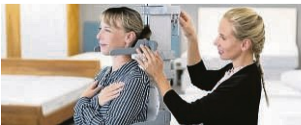
An diesem Messgerät wird bei Brack Maß genommen.

Das Bettenhaus Brack in Korbach bietet noch bis 23. Juli individuell angepasste Nackenstützkissen zum Testen an.