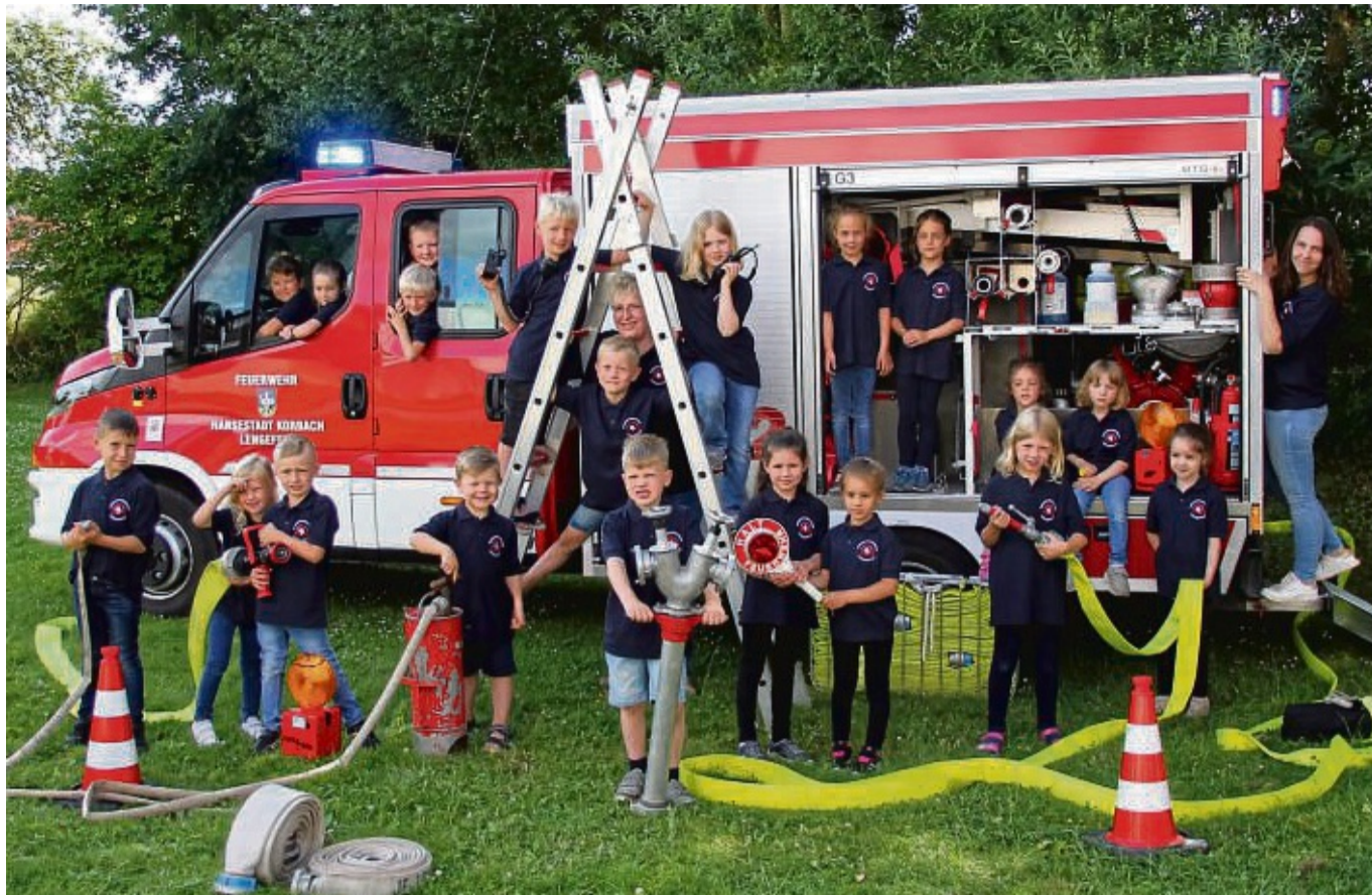
Die Kinderfeuerwehrgruppe aus Lengefeld begeistert nun schon seit 20 Jahren Kinder für den Brandschutz.