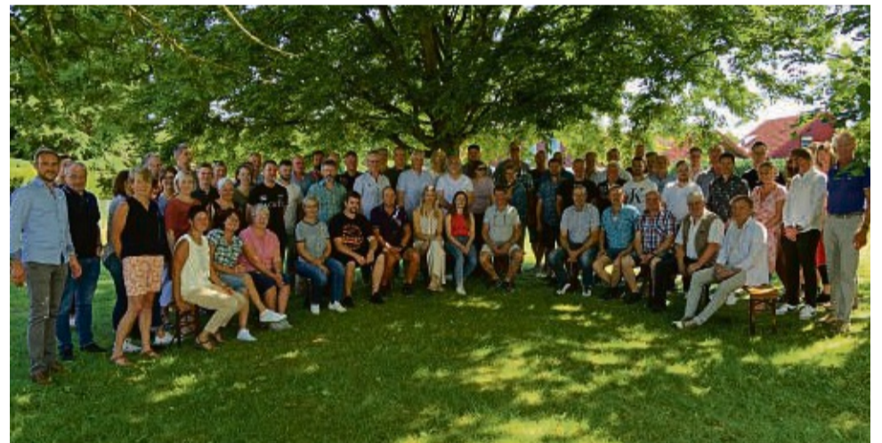
Die Möbelkreis-Familie hat mit allen Standorten gemeinsam ein Sommerfest gefeiert.