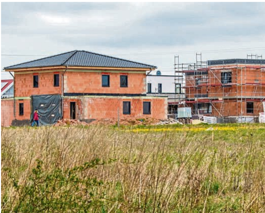
Neubaugelände Holunderflosse in Korbach: Die Nachfrage nach Baugrundstücken ist nach wie vor hoch, doch einige angehende Bauherren überdenken bereits ihre Vorhaben.