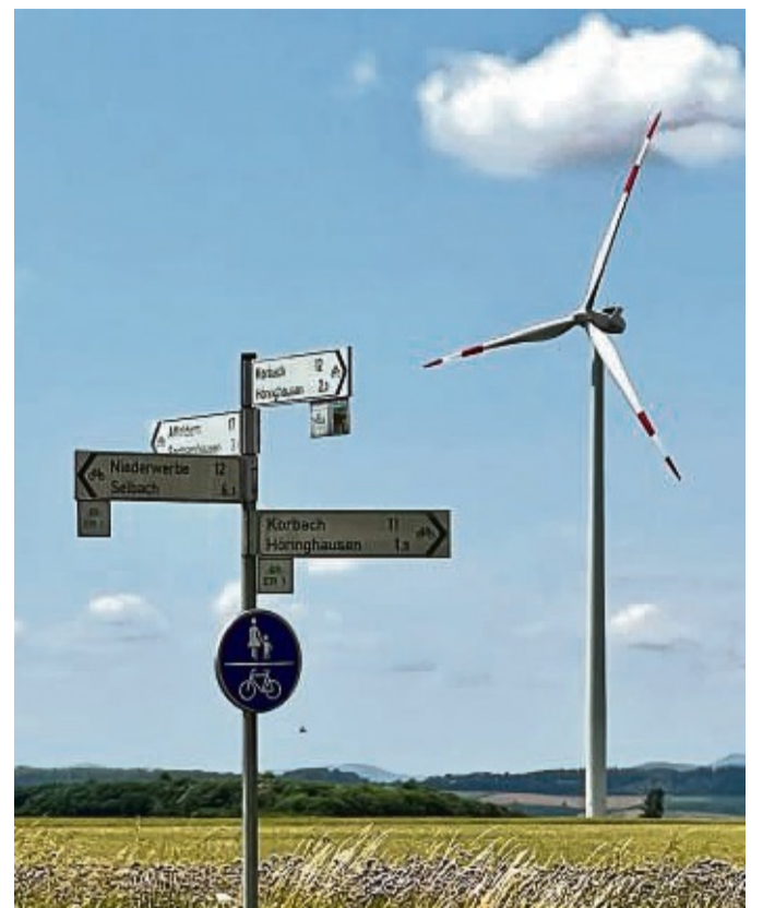
Die Windräder um Höringhausen, wie hier vom Bahnradweg Richtung Korbach aus zu sehen, bekommen Zuwachs. Das Regierungspräsidium hat vier weitere im Dreieck zwischen Höringhausen, Freienhagen und Sachsenhausen genehmigt.

Bau und Betrieb von Windkraftanlagen mit einer Gesamthöhe von mehr als 50 Metern benötigen eine Genehmigung nach Bundesim-missionsschutzgesetz, so die Behörde. Natur- und Artenschutz spielten eine große Rolle. Die nun erteilte Genehmigung bezieht sich auf vier Windenergieanlagen des Typs Vestas V162. Das Modell weist einen Rotordurchmesser von 162 Metern auf bei einer Nabenhöhe von 166 Metern und einer Gesamthöhe von 247 Metern. Jeweils 5600 kW Nennleistung bringt das einzelne Windkrafttrad. Bei einem Kraftfahrzeug entspräche das in etwa 7600 PS. red