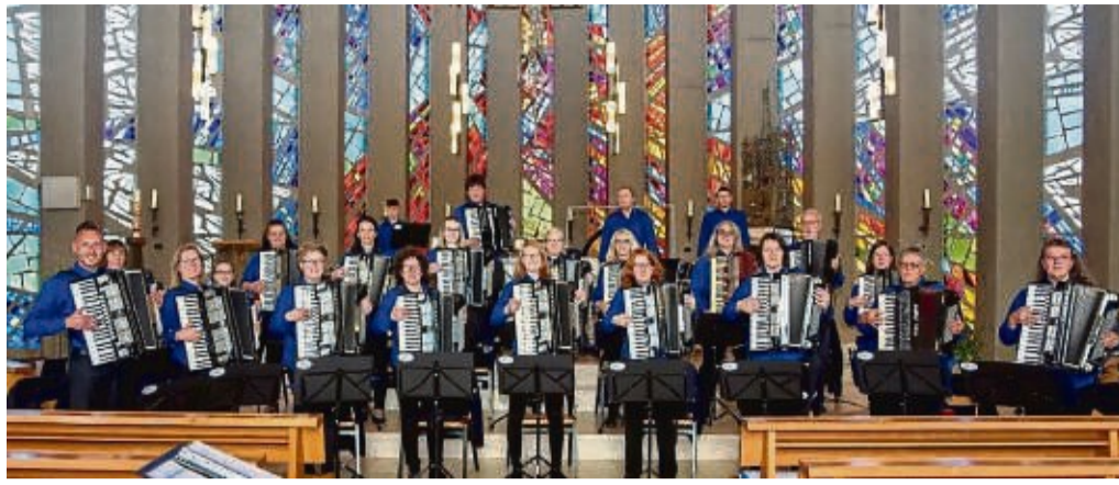
Das Akkordeon-Orchester Diemelspatzen lädt zum Open Air Konzert ein.