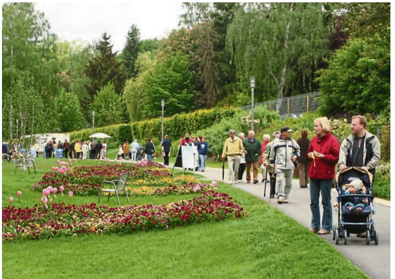
An alte Zeiten anknüpfen: Nachdem der Glanz der Landesgartenschau von 2006 schon lange verblasst ist, sind neue Ideen und Konzepte für den größten Kurpark Europas notwendig.