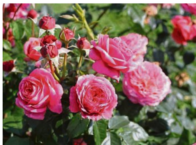
Wer sich bereits diesen Sommer über Blütenpracht in einem neu angelegten Rosenbeet freuen möchte, greift am besten zu gut vorgezogenen Containerrosen.

Für Anfänger sind besonders Containerrosen geeignet. Ab Mitte Mai im Handel erhältlich, haben sie bereits einen festen Wurzelballen im Topf und sind daher leicht und ohne größere Vorbereitungsarbeiten einzusetzen. Sie können fast die gesamte Vegetationsperiode über in den Boden eingebracht werden, lediglich heiße Sommertage oder die pralle Mittags-