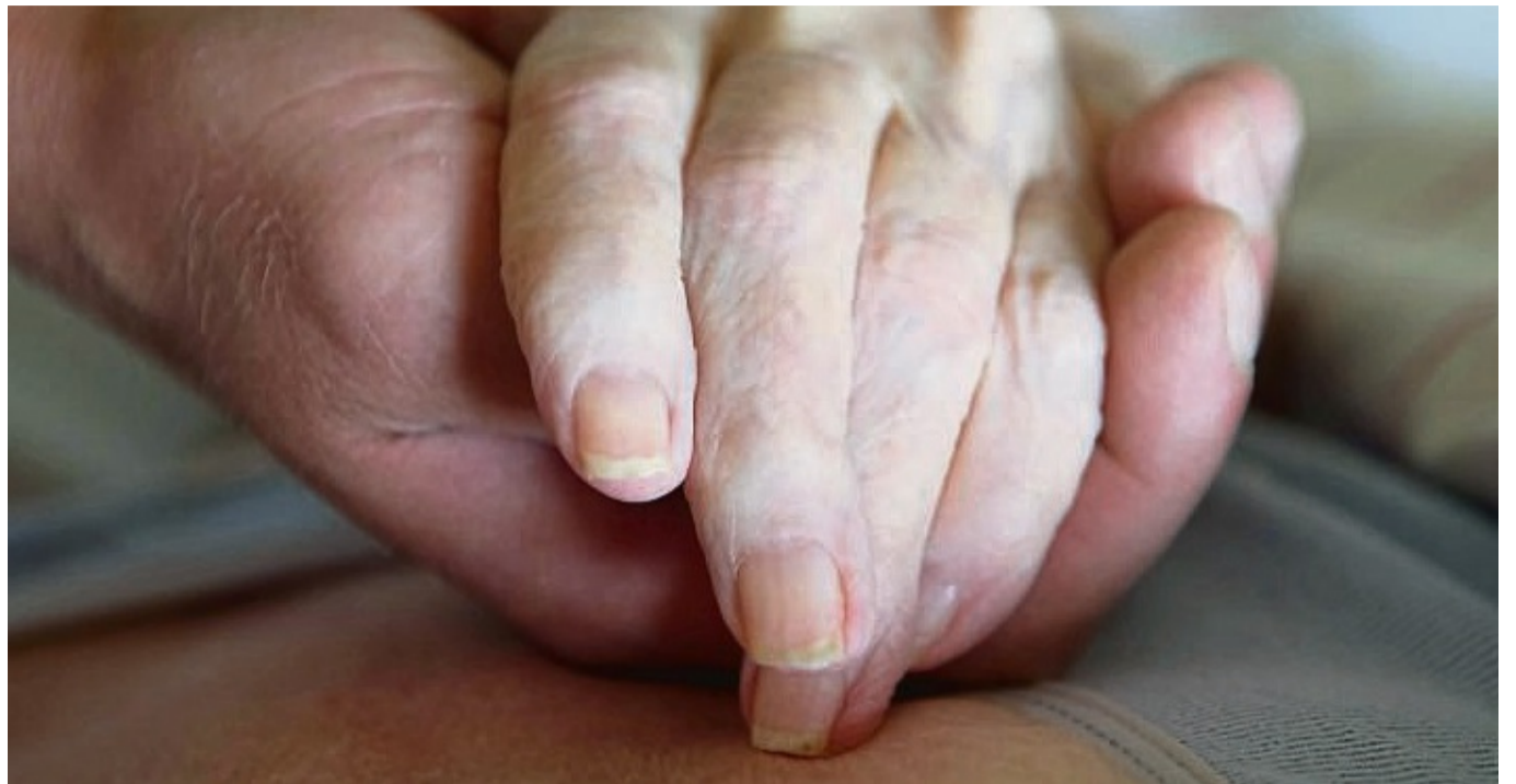
Neuer Ausbildungskurs für Hospizbegleiter: Am 14. Juli findet für Interessierte ein Informationsabend statt.

Zunächst mal stehen jederzeit die Koordinatorinnen im Hospizbüro zu einem Gespräch zur Verfügung. Ein-