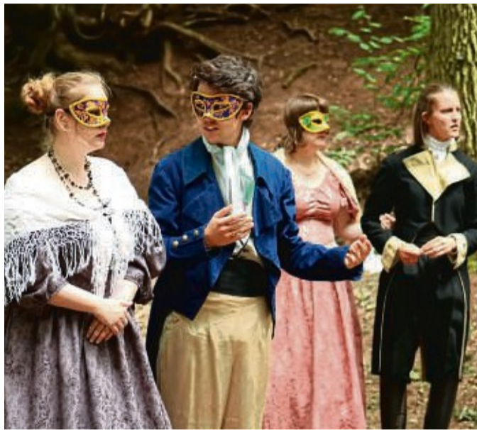
Prädikat „absolut sehenswert“: Der Shakespeare-Klassiker „Viel Lärm um Nichts“ wird ab sofort auf der Waldbühne aufgeführt.

Aktiv ist dabei – wie bei jedem Inszenierung des Jungen Theaters für die Waldbühne – das große Ensemble mit zirka 30 Mitgliedern. Einige von ihnen warben am 11. Juni in historischen Kostümen in Eschwege für die Komödie. Für das Ensemble ist klar,