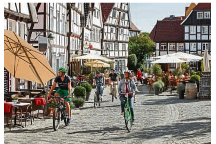
Auf der rund 45 Kilometer langen Rundtour lernen Radfans drei der schönsten Orte der Soester Börde kennen – wie etwa die Stadt Soest mit ihren Fachwerkhäusern.

In der alten Hansestadt Soest locken Altstadtpracht und ein Spaziergang auf dem mittelalterlichen Stadtwall, während in Bad Sassendorf der blütenreiche Kurpark mit dem Gradierwerk zum Verweilen einlädt. Am Möhnesee wiederum können Radler die imposante Talsperre bestau-