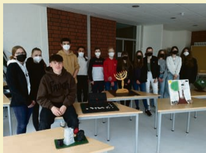
Religionslehre. Von einer gebrochenen Menora, einer schwarzen KZ-Baracke und einem Gedächtniswürfel, der z.B. an den Theologen Dietrich Bonhoeffer erinnert, gehen die gestalterischen Ideen hin zu einer Darstellung des einstürzenden Naziregimes oder eines zersplit-

Eine Gemeinschaftsaktion der Sontraer Schulen, der untenstehenden Unternehmen und des