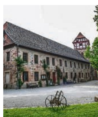
Boyneburger Schloss: Museum ist geöffnet.