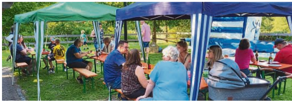
Gute Stimmung beim Grillfest in Hoheneiche.

Hoheneiche – Am Samstag, 25. Juni, trafen sich die Mitglieder des Musikzug Reichensachsen 1960 e.V. zu einem Grillfest an der Grillhütte in Hoheneiche.