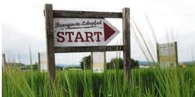
Neuer Braugerste-Infopfad in Grebendorf kann ab sofort zu Fuß oder mit dem Rad erkundet werden.