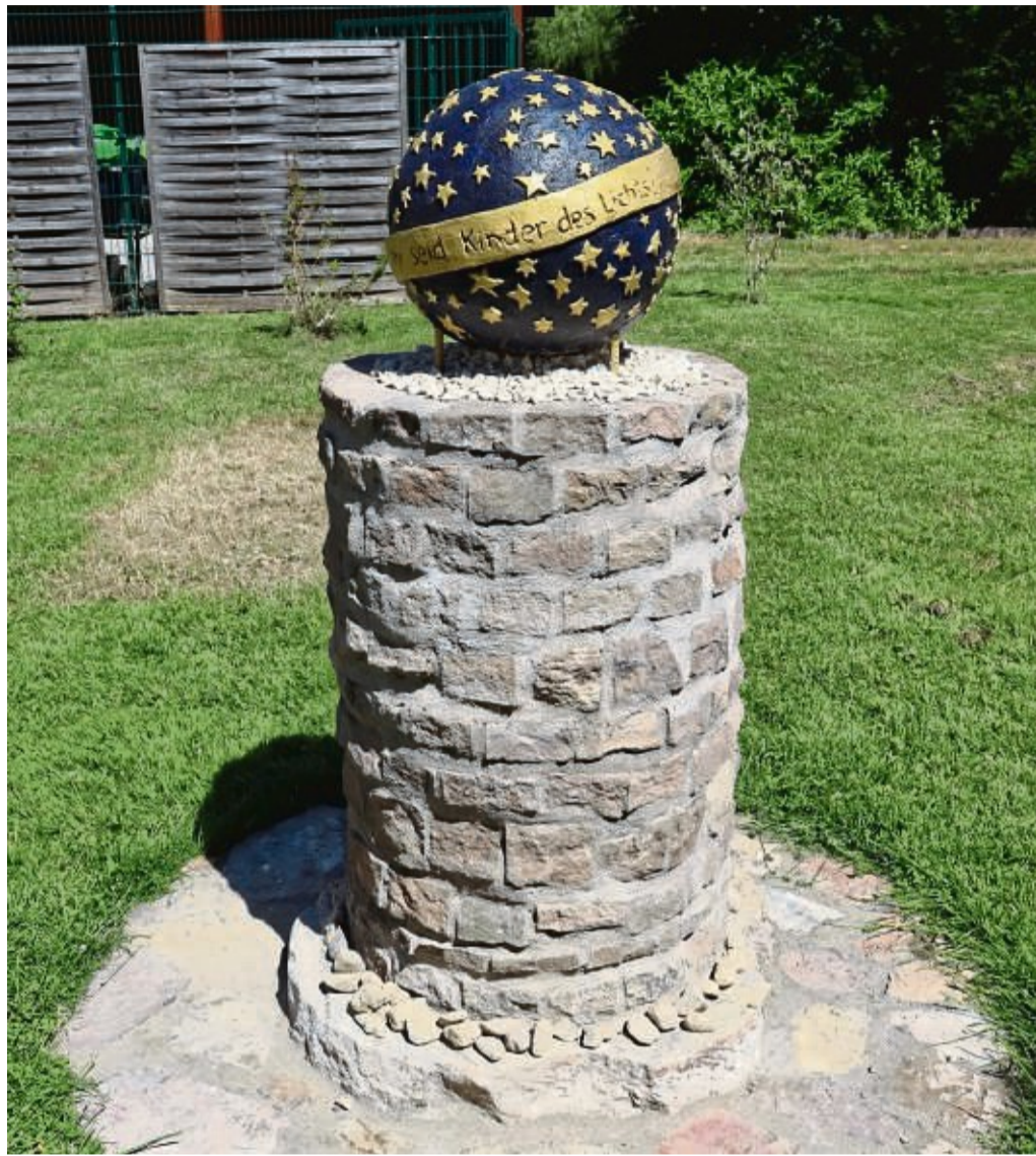
Für Sternenkinder wurde auf dem Friedhof Wanfried ein Denkmal errichtet. Der Trauer, aber auch der Kraft soll damit ein Ort gegeben werden.

Auf dem Friedhof in Wanfried gibt es nun einen Ort zum Trauern