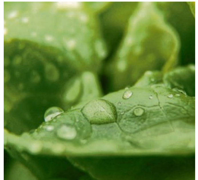
Knackig und frisch: So wünscht man sich seinen Salat. Gut, dass man nachhelfen kann, wenn die Blätter etwas schlapp geworden sind.