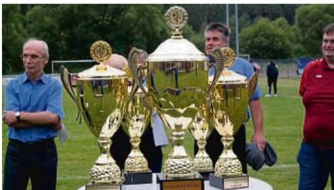
Kahl- und Schlichterle-Cup: Um diese begehrten Pokale geht es vom 12. bis 17. Juli. Zudem ist das hochkarätig besetzte Turnier mit 5000 Euro dotiert.