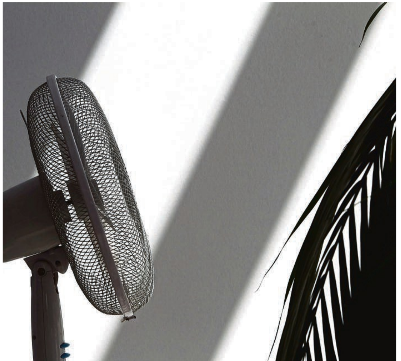
Ventilatoren sorgen an heißen Tagen für eine kühle Brise.

Gemeindevorstand der Gemeinde Schrecksbach Immichenhainer Straße 1, 34637 Schrecksbach Ausführliche Informationen erhalten Sie unter: www.schrecksbach.info