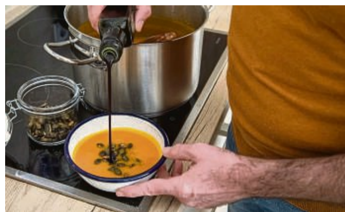
Auf den Speiseplan gehören für ältere Menschen vor allem Gerichte, auf die sie richtig Appetit haben. Ausgewogen sollte die Ernährung aber dennoch sein.

Wasser ist die erste Wahl - es lässt sich gut aufpeppen: „Geben Sie zum Beispiel Zitronen- oder Gurkenspalten ins Wasser oder frische Kräuter wie Minze oder Melisse“, sagt Stachelscheid. Für Abwechslung sorgen etwa unge-süßte Kräuter- oder Früchte-tees sowie Saftschorlen.