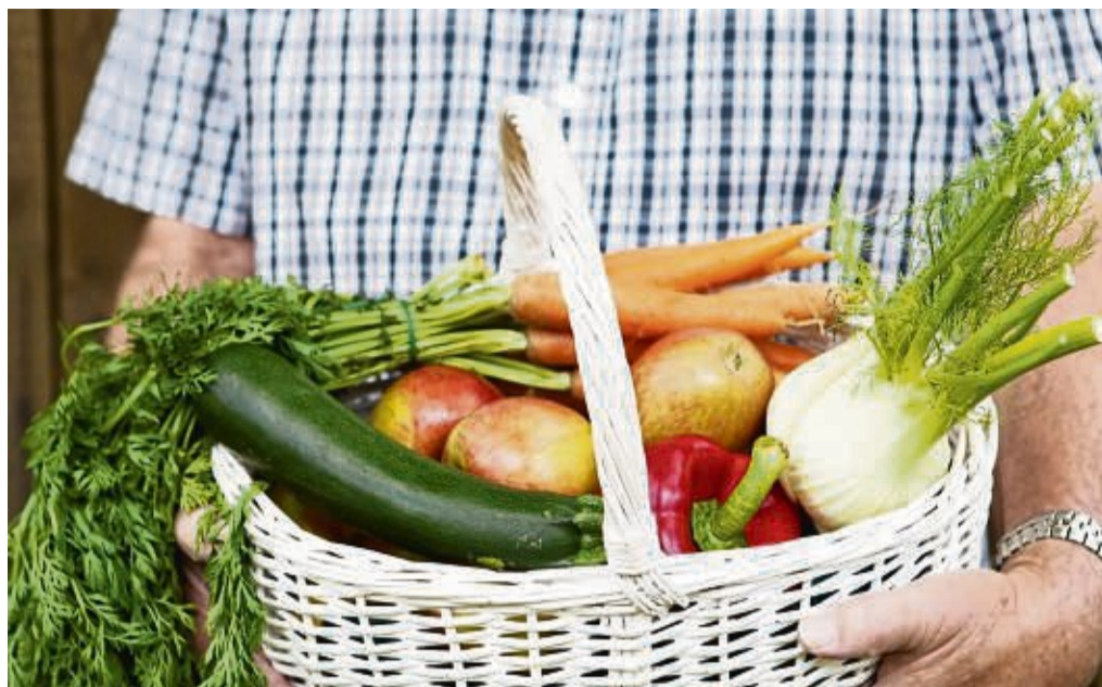
Frisches Gemüse ist natürlich immer eine gute Wahl. Aber: Es darf auch mal Tiefkühlware sein, dann aber bitte so wenig verarbeitet wie möglich.