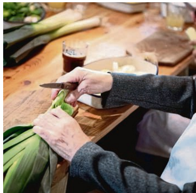
Auch bei Kau- und Schluckbeschwerden sollten ältere Menschen nicht auf Gemüse verzichten. Es lässt sich zum Beispiel weich dünsten oder zu einer Suppe pürieren.