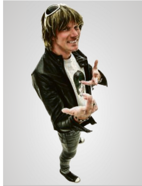
Mickie Krause ist als Party-Entertainer bekannt.