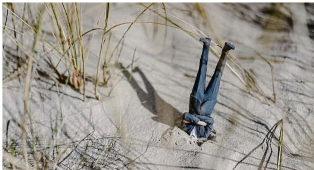
Ruhe, bitte: Energie schöpfen Introvertierte, wenn sie Zeit für sich haben - auch am Arbeitsplatz.