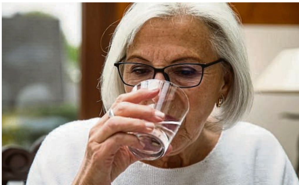
Zur Ernährung gehört auch das Trinken. Rund 1300 Milliliter sollte ein Erwachsener am Tag zu sich nehmen, besser noch 1500.