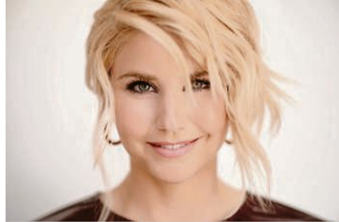
Schlagerstar Beatrice Egli kommt am Samstag nach Ziegenhain.