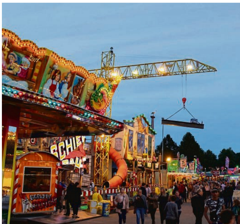
Der Viehmarkt in Wolfhagen lockt mit einem bunten Programm.

14.30 Uhr: Seniorentreff im Festzelt mit buntem Rahmenprogramm.