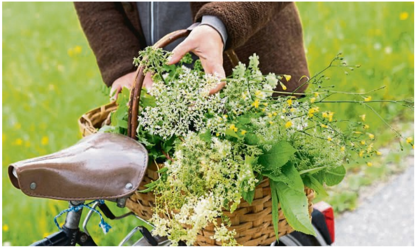
Wildkräuter müssen nicht weit transportiert werden und brauchen keine Verpackungen. Auch enthalten sie in der Regel mehr Vitamine und Mineralstoffe als Kulturgemüse.