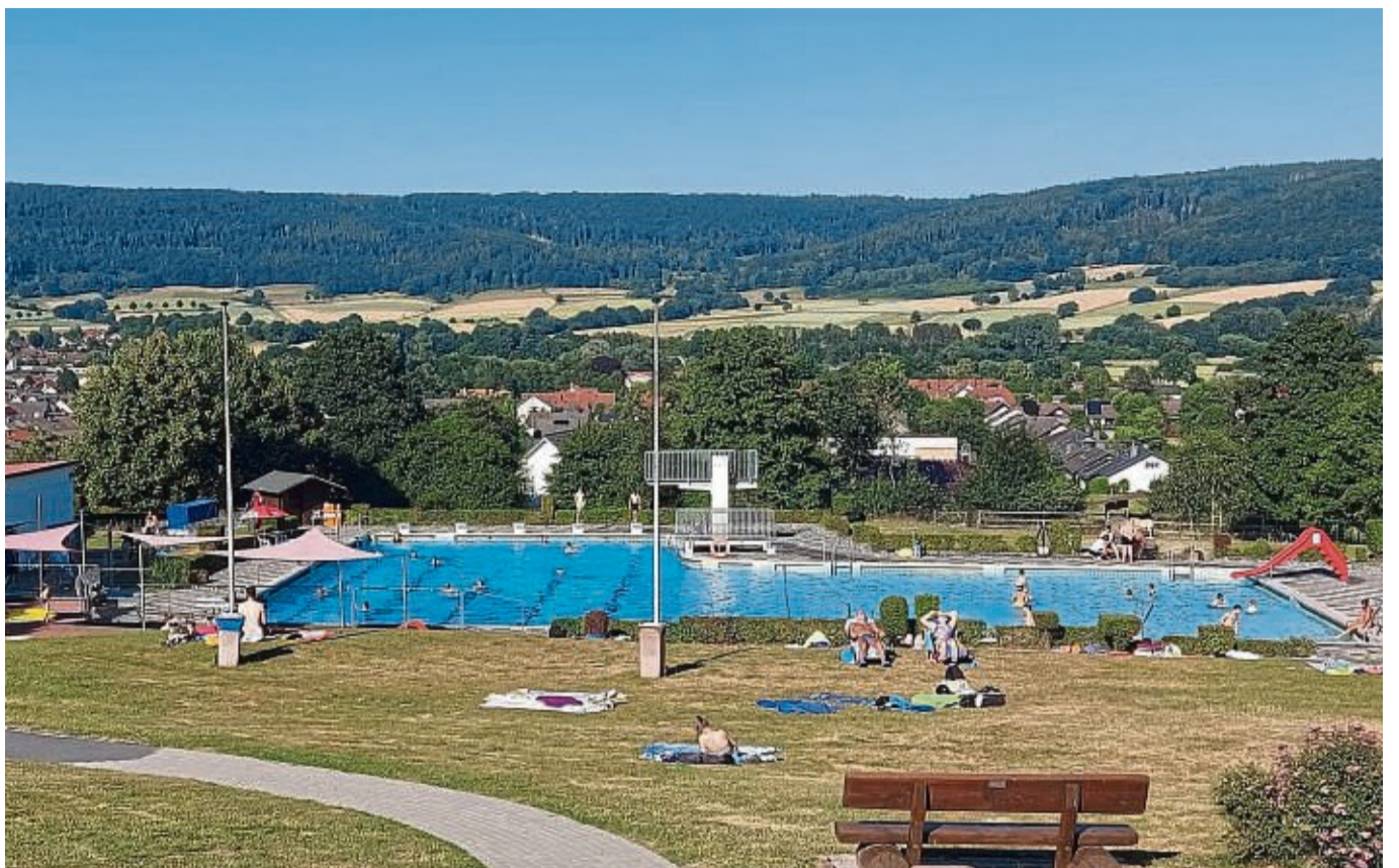
Das Veckerhagener Freibad mit Blick auf den Bramwald: Das Schwimmbad ist eins der wichtigen Kriterien für die weitere Anerkennung Reinhardshagens als Erholungsort.

Wir suchen Raumpfleger (m/w/d) Vollzeit oder Teilzeit für den Bereich Trendelburg & Umgebung. Nettes Team, übertarifliche Bezahlung Tel.: 0561-7015965 Mail: picobello-service@t-online.de Wir freuen uns auf Ihre Bewerbung!