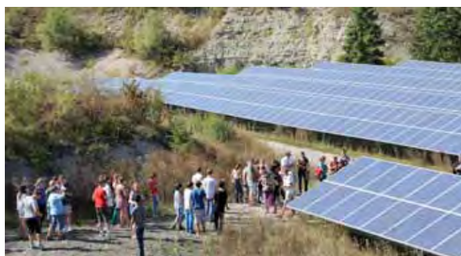
Bei strahlendem Sonnenschein ging es für die Gruppe zum Solarpark nach Gernsheim.