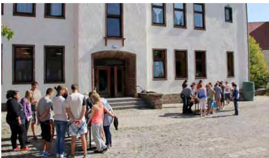
In Kleingruppe und unter Anleitung machten sich die Schüler ans Werk und lernten dabei nicht nur viel über Energie und Stromverbrauch, sondern auch über sich und die anderen Jugendlichen und ihre Lebensweise.