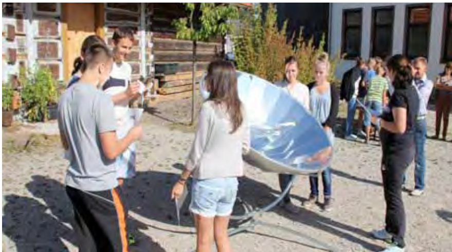
An der frischen Luft im Hof des Schullandheims Spohns Haus erforschen die Jugendlichen ganz praktisch das Geheimnis erneuerbarer Energie.

Am Freitag, dem letzten Arbeitstag, wurden im Schullandheim alle Ergebnisse zusammen gefasst.