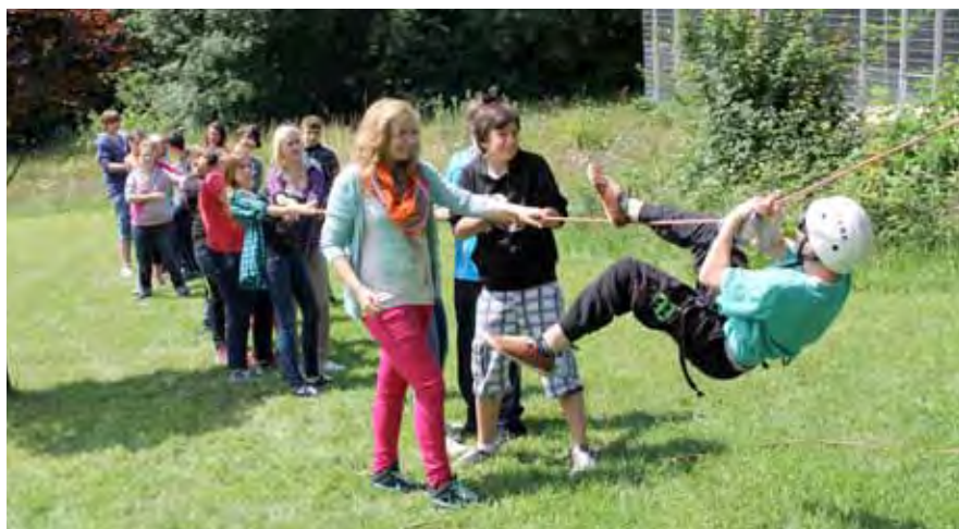
An der frischen Luft im Hof des Schullandheims Spohns Haus erforschen die Jugendlichen ganz praktisch das Geheimnis erneuerbarer Energie.

Wenn es um Erlebnispädagogik im Saarland geht, können die Schullandheime Oberthal, aber auch die Biberburg Berschweiler mit tollen Angeboten aufwarten. Steht in Oberthal der höchste Kletterturm im südwestdeutschen Raum mit vier Schwierigkeitsstufen, so kann Berschweiler mit einem Niedrig- und Hochseilgarten aufwarten. Von beiden Schullandheimen ist der Bostalsee gut zu erreichen mit den Möglichkeiten Kanu zu fahren und zu segeln, Mountainbiken ist ebenso möglich wie Segelfliegen, Wald- und Wildnispädagogik, Outdoor-Teamtraining sowie Abenteuer- und Kooperationsübungen werden angeboten. Hinter allen Programmen steht das Erlebnispädagogische Zentrum (EPZ) , das erst diese Aktivitäten zu sinnvollen pädagogischen Aktivitäten werden lässt. Die Klassengemeinschaft wächst zusammen, die Schüler/innen lernen Verantwortung zu übernehmen, aufeinander Rücksicht zu nehmen, das gegenseitige Vertrauen wird gestärkt, ebenso das