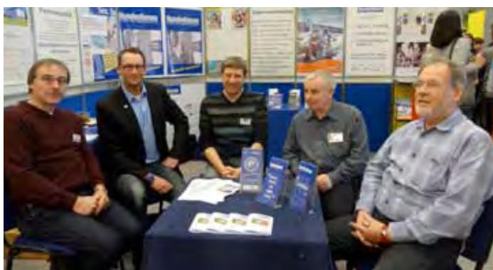
Im Team für die Schullandheime unterwegs.