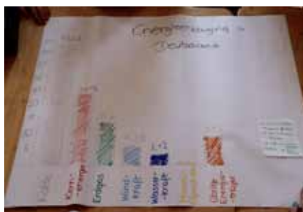
Gemeinsam entstehen bunte Diagramme zur Stromversorgung.