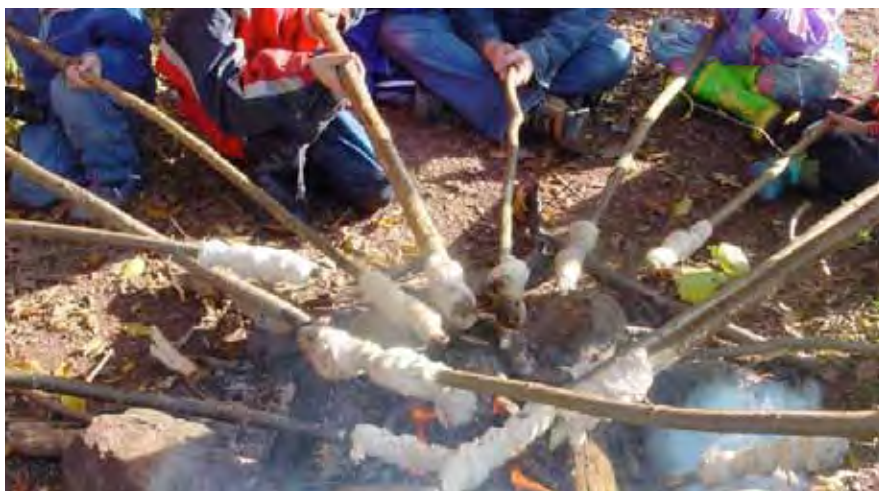
Am Lagerfeuer genießen die Kinder die Natur hautnah.

Die Schüler erleben die BiberBurg Berschweiler mit Herz, Hand und Kopf.