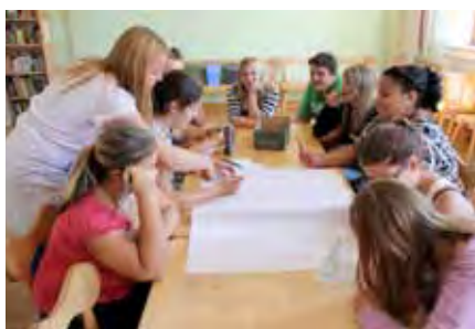
Vertieft in die Arbeit: Die Jugendlichen machen sich Gedanken.