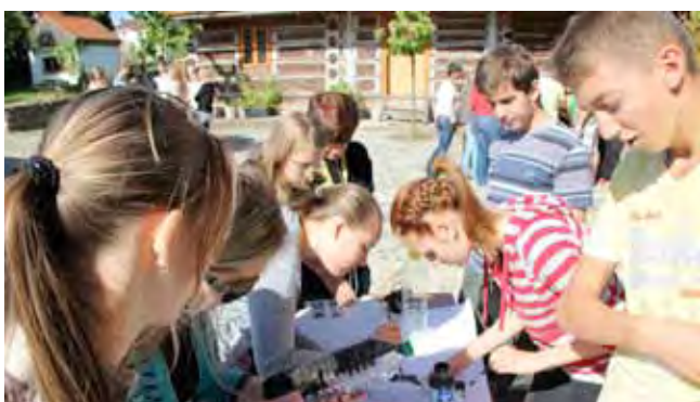
Erneuerbare Energien und fossile Brennstoffe standen im Fokus beim Thementag im Schullandheim.