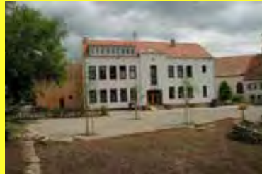
Spohns Haus in Gersheim