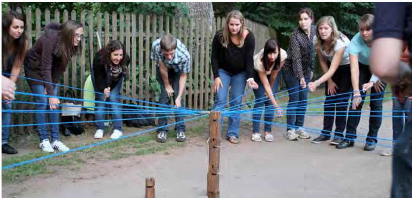
Mit dem „Fröbelkran“ trainieren die angehenden Lehrer und Lehrerinnen ihre Teamfähigkeit.

Die Bedeutung der Schullandheime für die Erziehung und Bildung der Schüler steht außer Frage. Dies haben die für Bildung Verantwortlichen im Saarland erkannt. Seit sieben Jahren läuft hier ein Leuchtturmprojekt, das in der Bundesrepublik seines gleichen sucht: Die Ausbildung der Referendare aller Schulformen in Schullandheimpädagogik sowie die Vermittlung von Handlungskompetenzen.