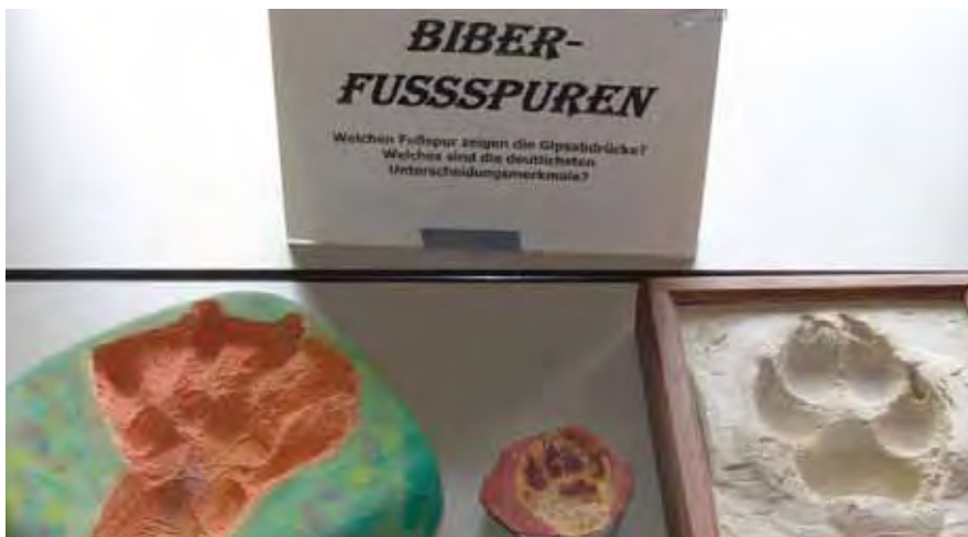
So sehen die Spuren eines Bibers aus: Im Schullandheim Biber-Burg kommen die Schulklassen dem scheun tier ganz nah.