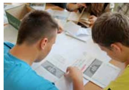
Vor der Praxis kommt die Theorie.

Sollen wir nach den Unfällen von Tschernobyl und Fukushima aus der Atomkraft aussteigen?