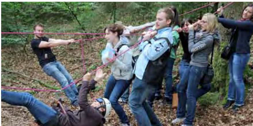
Beim Seillaufen geht es nicht nur um Kraft, sondern auch um Vertrauen.