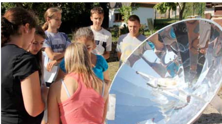
Das Wetter spielte mit und so konnten die Jugendlichen unter anderem Sonnenlicht in Energie umwandeln.