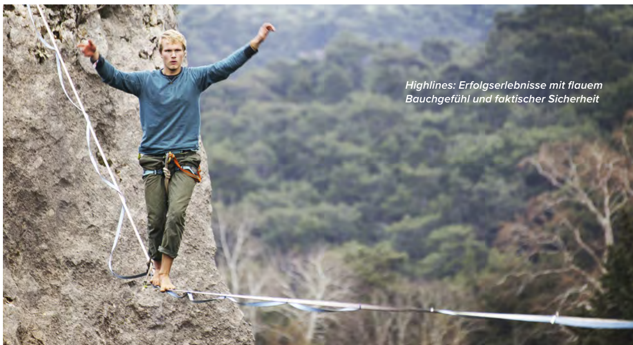
Highlines: Erfolgserlebnisse mit flauem Bauchgefühl und faktischer Sicherheit