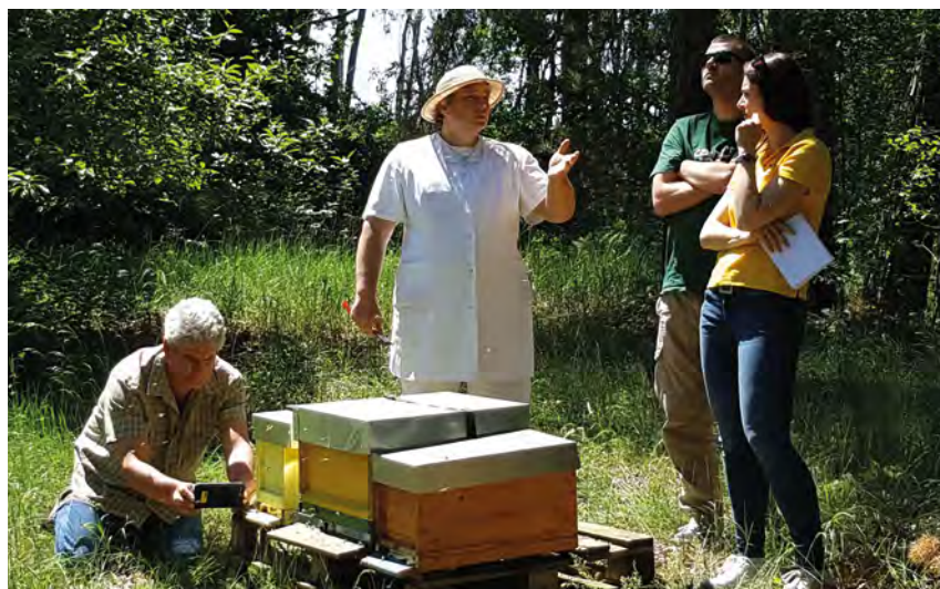
Auch Imker waren mit Ihren Völkern dabei und beantworteten alle Fragen.

An unserem Weltbienentag konnten die Kinder selbst helfen beim Schleudern und Honigabfüllen.