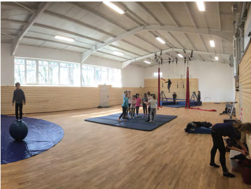
Platz für Spiel, Sport und Veranstaltungen in der neuen Mehrzweckhalle