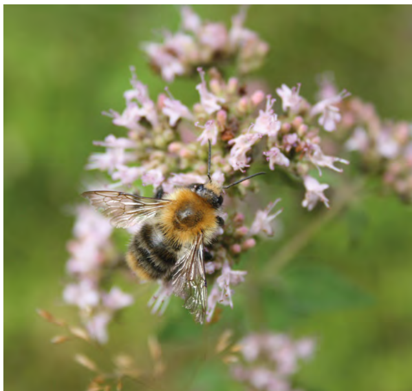
Hummeln sind mit ihren rund 40 Arten in Deutschland neben Bienen und Wildbienen die wichtigsten Bestäuber

Noch viel dramatischer fällt der Artenschwund bei den sensibleren Wildbienenarten aus. Hier stehen von den rund 550 in Deutschland vorkommenden Arten bereits knapp 200 auf der Roten Liste. Über 30 Wildbienenarten sind deutschlandweit sogar schon vom Aussterben bedroht, in Europa ist dies fast jede zehnte Wildbienenart. Dabei sind neben zahlreichen anderen Pflanzenarten allein zwei Drittel unserer Nutzpflanzen auf die Bestäubung durch Insekten angewiesen. Sie sind die unverzichtbaren Helfer in Bezug auf stabile Ökosysteme sowie eine weltweit gesicherte Ernährung unserer Bevölkerung. So wird der Wert der Bestäubungsleistung durch Insekten auf unserem Globus jährlich auf bis zu 500 Milliarden Euro geschätzt.