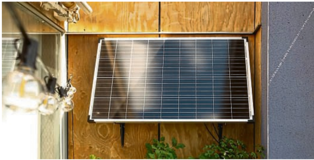
Sogar Mieter können auf dem Balkon Solarstrom erzeugen - mit solchen Paneelen mit gewöhnlichem Schuko-Stecker.