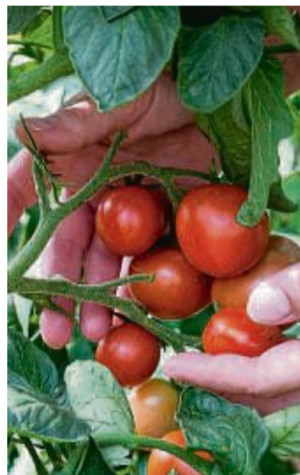
Tomaten lassen sich im Garten ebenso anbauen wie auf dem Balkon.

Hoch ist diese Gefahr übrigens bei schwarzen Töpfen. Sie erwärmen sich besonders stark in der Sonne. Die Akademie rät deshalb, vor die Kübel mit Tomatenpflanzen weitere Töpfe als Schattenspende zu stellen. Wie gut die Tomate mit Nährstoffen versorgt ist, lässt sich an der Farbe ihrer Blätter erkennen. Dunkelgrün heißt: Alles okay. Färben sich die Blätter hellgrün, ist das kein gutes Zeichen. Dann empfiehlt die LWG die Tomaten mit einem handelsüblichen Flüssigdünger zu düngen.