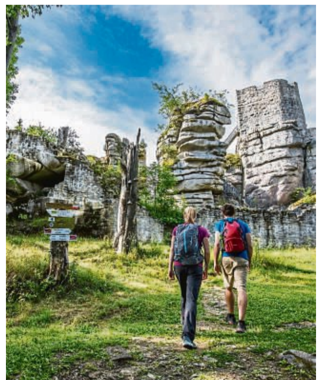
Auf der ersten Etappe des Goldsteigs liegt eingebettet in markante Gesteinsformationen die Burgruine Weißenstein.

wald.de/natur-navi gibt es eine digitale Wanderkarte und Informationen zu Sehenswürdigkeiten und Einkehrtipps. Heimische Spezialitäten wie Bauernseufzer und Zoiglbier warten als Stärkung in den vielen gemütlichen Orten am Wegesrand.