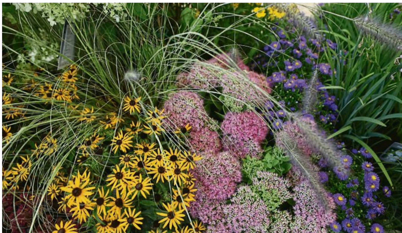
Einige Pflanzen spielen die Hauptrolle, andere sind Komparsen: Werden Beete wie eine Bühne gestaltet, wirken sie besonders prachtvoll.