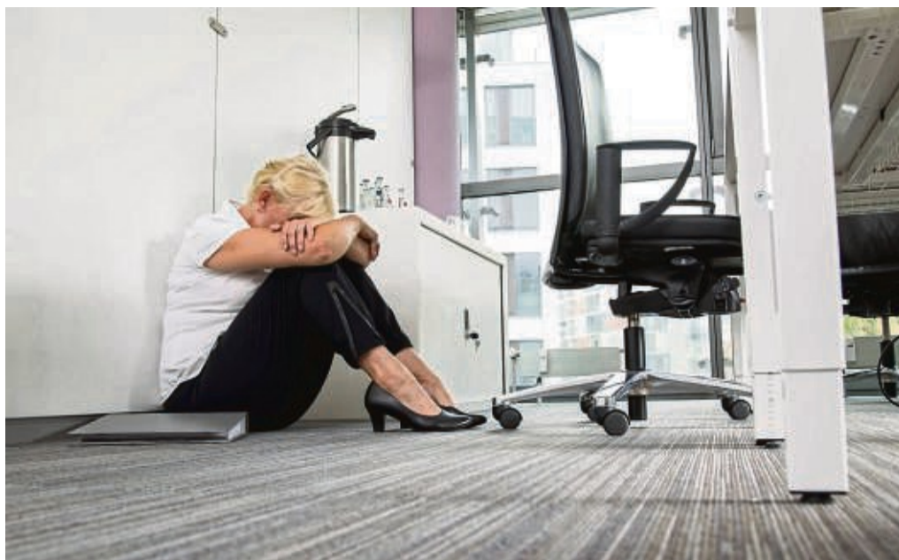
Die ständige Demütigung durch Mobbing ist für Beschäftigte eine einschneidende Krise mit Folgen für Beruf und Gesundheit.

Die persönlichen Folgen für Betroffene sind oft fatal. Laut DGB empfinden die Opfer die Angriffe und Schikanen oftmals als einschneidende Krise. Mit jeder Attacke erleben sie erneut Demütigung. Die Folge können Herzrasen, Schlafstörungen, Nervosität, Konzentrationsschwäche sowie Kopf- und Magenschmerzen sein.