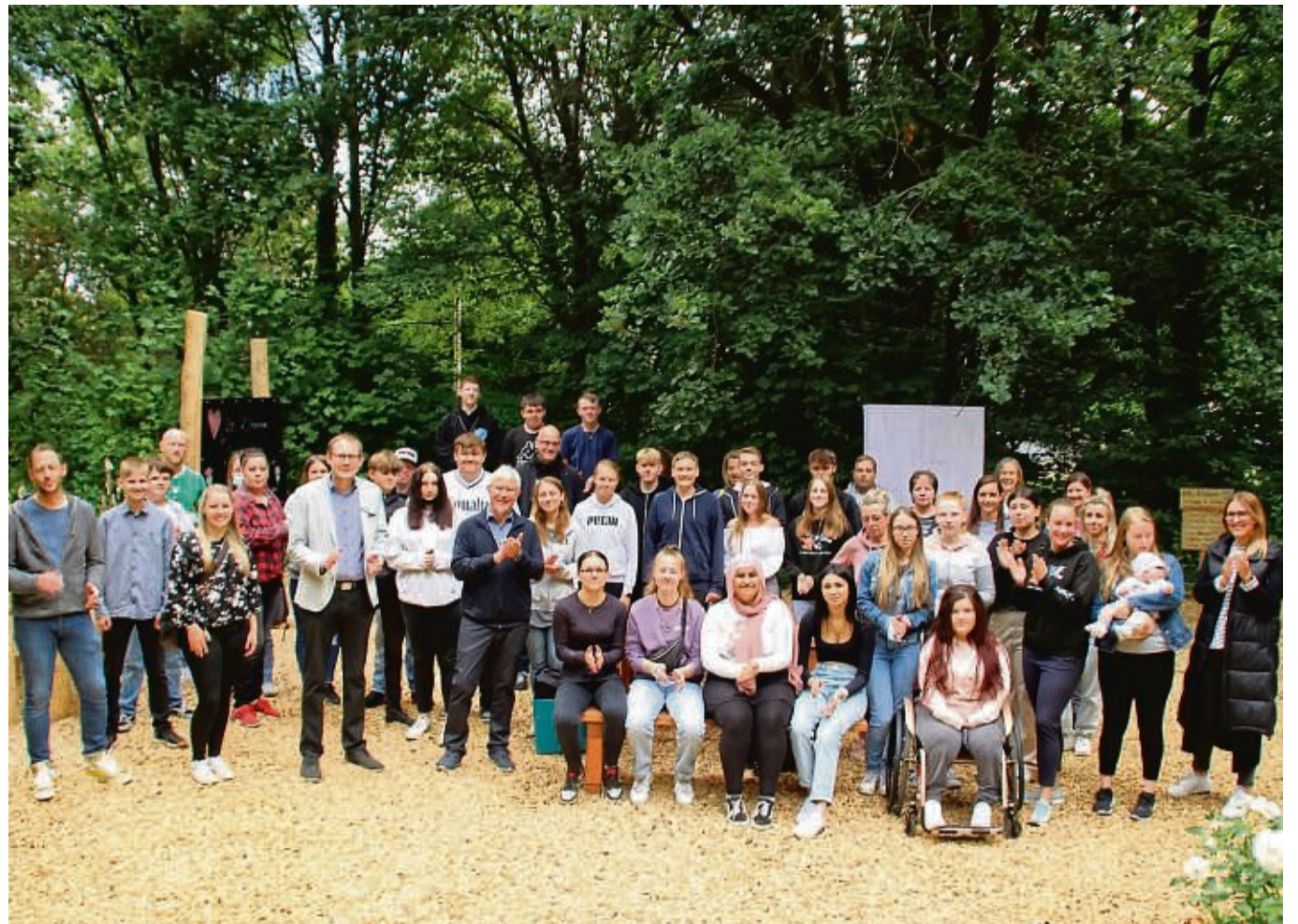
Große Freude über das grüne Klassenzimmer: Die Klasse R 10 a und weitere Schülerinnen und Schüler der Drei-Burgen-Schule mit Sponsoren und Lehrern. Das grüne Klassenzimmer entstand zwischen Schule und Rhododendrentangarten auf einer Fläche, die verwildert war. Daraus entstand ein Schmuckstück.

Türkischer Gold Basar GOLD- ANKAUF Goldpreis auf Rekordhöhe! Bei uns zu vergleichen, lohnt sich immer! DIE BESTE ADRESSE für Goldankauf! Sofort Bargeld!!! Rufen Sie gleich an! Telefon 05 61-161 75 Werner-Hilpert-Str. 9 (nahe Kultur-Bahnhof), Kassel Mo.-Fr. 10.00 bis 18.00 Uhr - Sa. 10.00 bis 15.00 Uhr