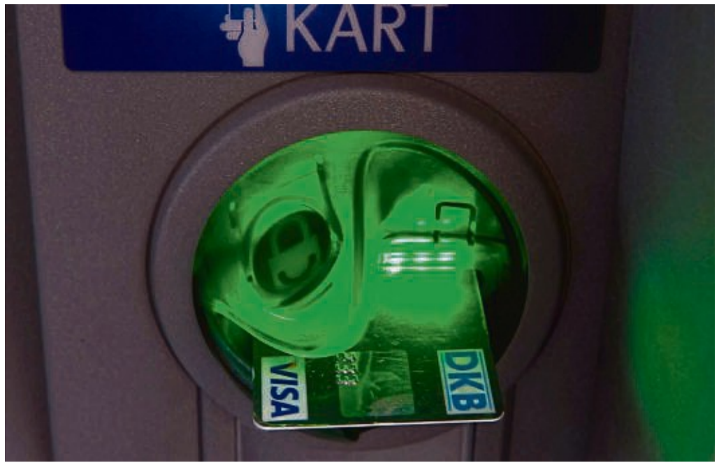
Giro- oder Kreditkarte? Beim Geldabheben und Bezahlen im Urlaub ist einiges zu beachten.