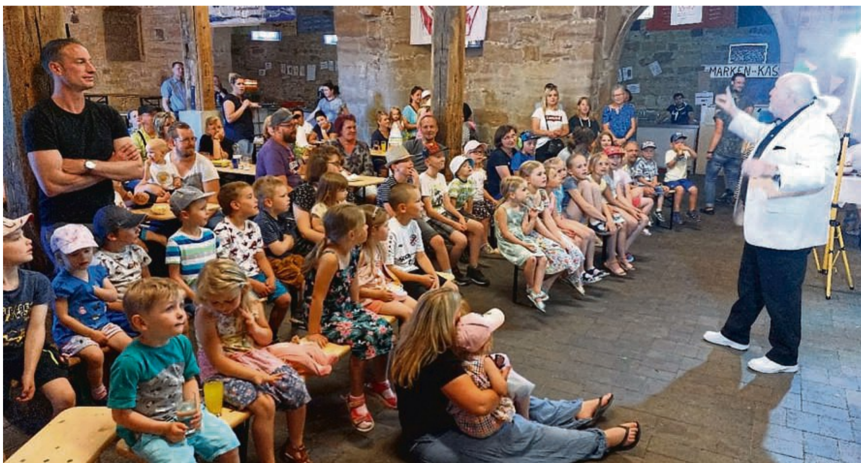
Feierten den 111. Geburtstag der Kita in der Zehntscheune im Fritzlarer Stadtteil Züschen: Die Kinder von der Kindertagesstätte Am Eulenturm.