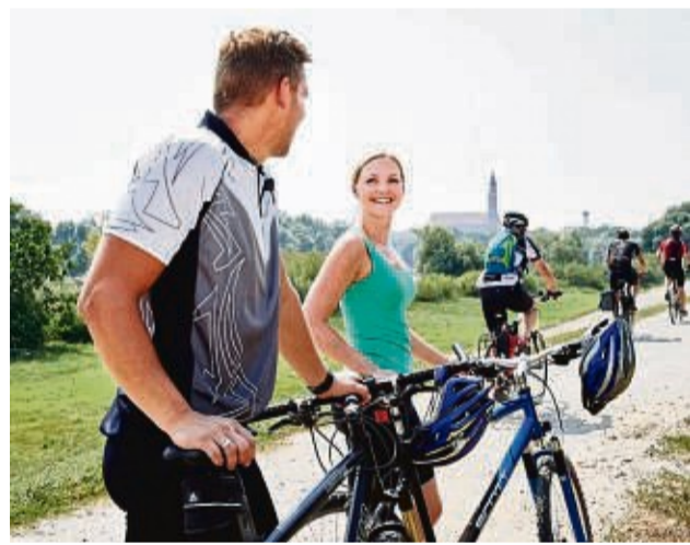
Radfahren gilt als beliebte Freizeitmöglichkeit in und um Straubing.