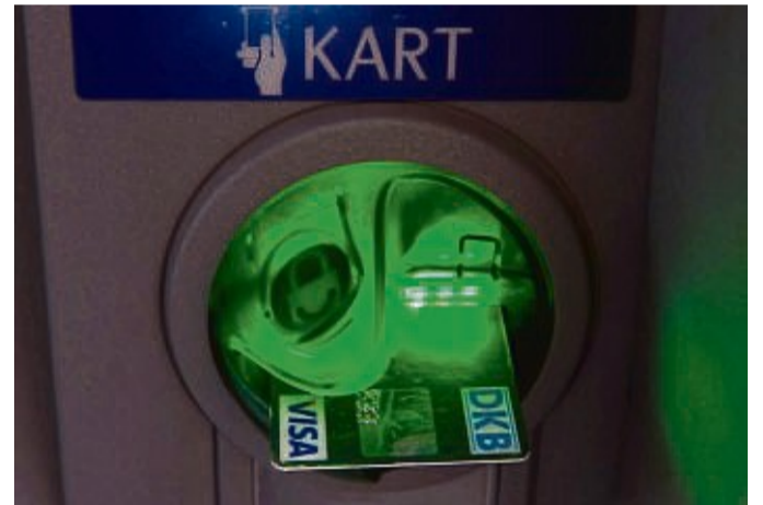
Giro- oder Kreditkarte? Beim Geldabheben und Bezahlen im Urlaub ist einiges zu beachten.