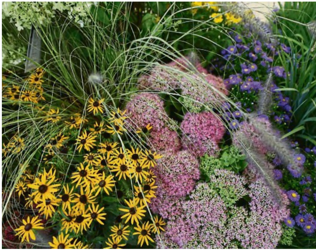
Einige Pflanzen spielen die Hauptrolle, andere sind Komparsen: Werden Beete wie eine Bühne gestaltet, wirken sie besonders prachtvoll.

Nicht jede Pflanze ist optisch dafür gemacht, im Mittelpunkt eines Beetes zu stehen. Aber erst durch sie kommt der Star in der Mitte zur Geltung - klar, er braucht eine Bühne.