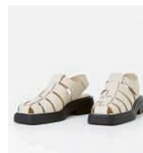
Fisherman-Sandalen sind eine Mischform aus Sandale und Halbschuh, die vorne geschlossen ist. Hier ein Beispiel von Vagabond.