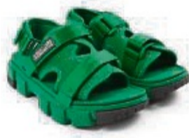
Ein Hingucker, nicht nur wegen der Farbe: Mit Chunky Sandals hat man viel Material am Fuß. Dieses Beispiel stammt von Baum und Pferdgarten.