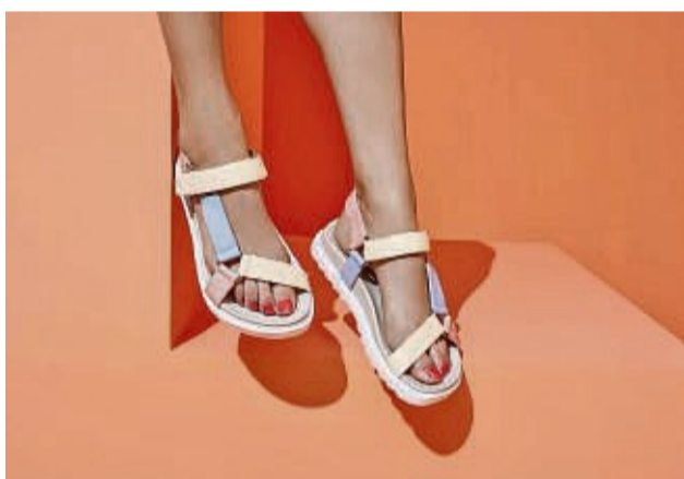
Sie haben auch dicke Sohlen und gehören seit geraumer Zeit schon zu den angesagten Schuhmodellen: Die Chunky Sandals. Hier ein Beispiel von Deichmann.