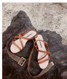
Viele dünnen Riemchen finden sich an den trendigen Sommersandalen, zum Beispiel an diesem Modell von Bonprix.