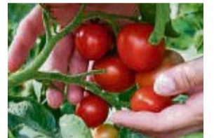
Tomaten lassen sich im Garten ebenso anbauen wie auf dem Balkon.

Um knackige Früchte ohne Risse zu pflücken, sollte die Erde der Pflanzen deshalb immer gleichmäßig feucht sein, wie die Bayerische Gartenakademie rät. Das heißt: Die Tomatenpflanzen besser regelmäßig gießen, als sie in trockenen Wochen nur einmal zu bewässern, dafür aber gründlich.