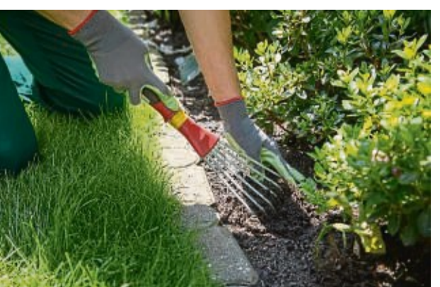
Das Auflockern des Beetbodens um die Pflanzen herum hilft diesen an trockenen Sommertagen.