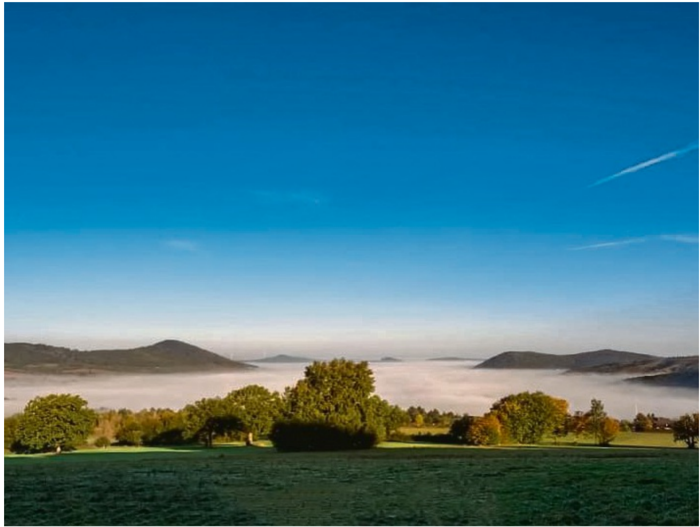
50 Jahre Großgemeinde Habichtswald: Das wird am Festwochenende, 22. bis 24. Juli, ausgiebig gefeiert.

Nach der hessischen Landtagswahl 1970 plante die neue Regierung eine umfassende Gebietsreform. Mittels größerer Verwaltungseinheiten sollten leistungsfähigere Gemeinden und Landkreise geschaffen werden. In den Landgemeinden herrschte große Skepsis gegenüber diesem Projekt. Doch die Entwicklung nahm ihren Lauf, die 2642 Gemeinden und 39 Landkreise wurden auf 421 Gemeinden und 21 Landkreise reduziert.