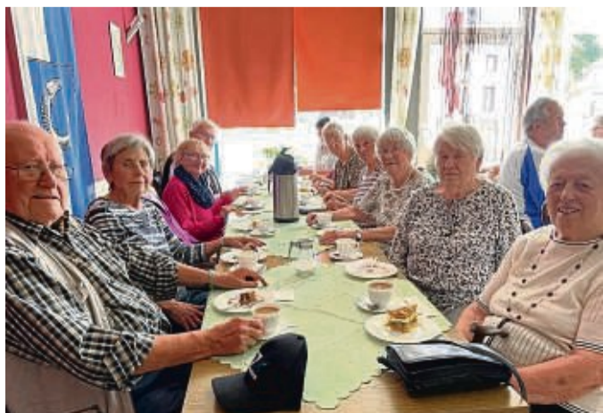
Nach langer Pause gab es wieder einen Seniorenachmittag in Gimte.

Gimte – Nach zwei Jahren wieder schnuddeln und Zwangspause endlich mal Neuigkeiten aus dem Dorf