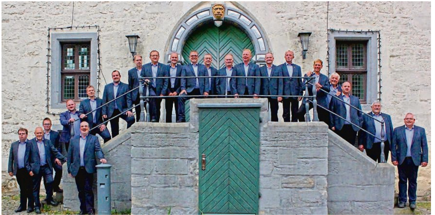
Chormusik in Hann. Münden: Der MGV „Heimattreu“ nach dem 28. Bundes-Chorkonzert vor dem Historischen Rathaus.