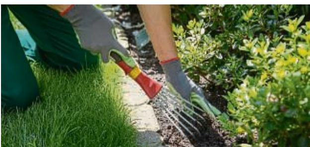
Das Auflockern des Beetbodens um die Pflanzen herum hilft diesen an trockenen Sommertagen.