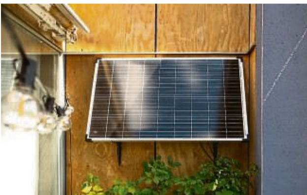
Sogar Mieter können auf dem Balkon Solarstrom erzeugen - mit solchen Paneelen mit gewöhnlichem Schuko-Stecker.