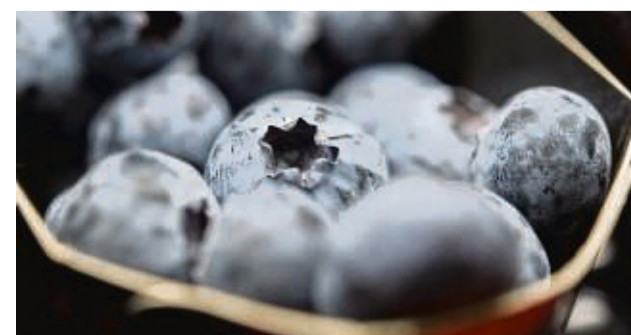
Frische Heidelbeeren halten sich bis zu zwei Wochen im Kühlschrank.

Danach die Früchte auf einem Tuch abtropfen lassen