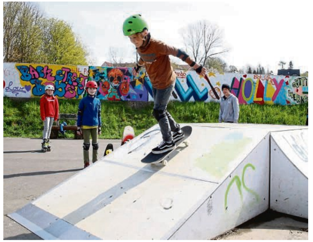
Skateboarden in Dransfeld ist auch diesen Sommer möglich. Das Foto zeigt Teilnehmer bei einem ehemaligen Workshop dort.

• Dienstag, 23. August: Kart Grand Prix in Hildes-