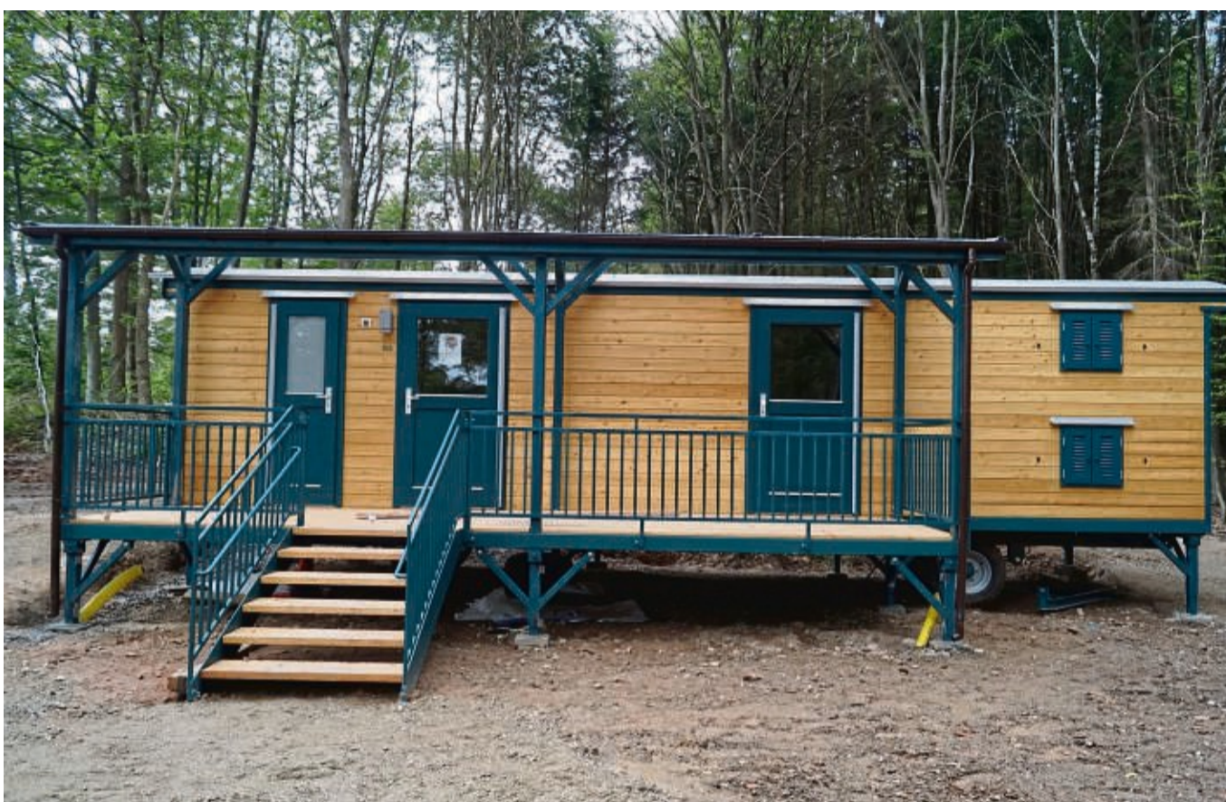
Rückzugsort: Ein solcher Bauwagen ist unerlässlich für eine Waldkita. Eine solche ist in Bonaforth geplant (Symbolbild)

Bei dem Treffen in lauer Sommerabendatmosphäre wurde auch Infomaterial herumgereicht. Eine Bedingung für eine Waldkita ist ein fester Schutzraum. Dazu eignet sich ein Bauwagen, der etwa