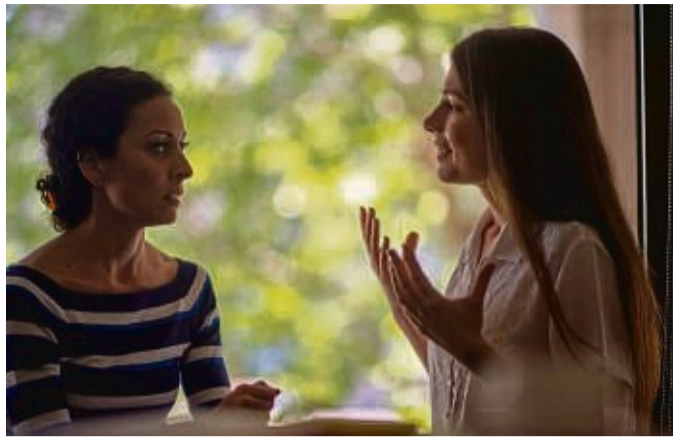
Wie nimmt man Kritik am besten auf? Es kann helfen, sich ein paar Momente Zeit zu nehmen und die Gedanken zu sortieren.