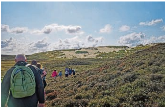
Auf geführten Touren können Urlauber die Geheimnisse der Wanderdüne erkunden.