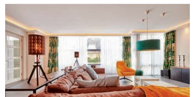
Mit Licht dein Wohnzimmer verzaubern.

Plameco bietet dir dazu flexible Zimmerdecken in vielen verschiedenen Farben und Designs. Ob matt, hochglänzend, mit Zierprofilen, oder LED-Beleuchtung: Die Decken sind so vielseitig, dass du sie harmonisch jedem Wohnstil anpassen kannst. Wohn-, Schlaf- und Esszimmer sowie Küche, Flur und Bad erhalten damit schnell ein neues Gesicht. Montiert werden sie einfach unterhalb der vorhandenen Decke. Kein ausräumen nötig, lediglich die Möbel werden ab-