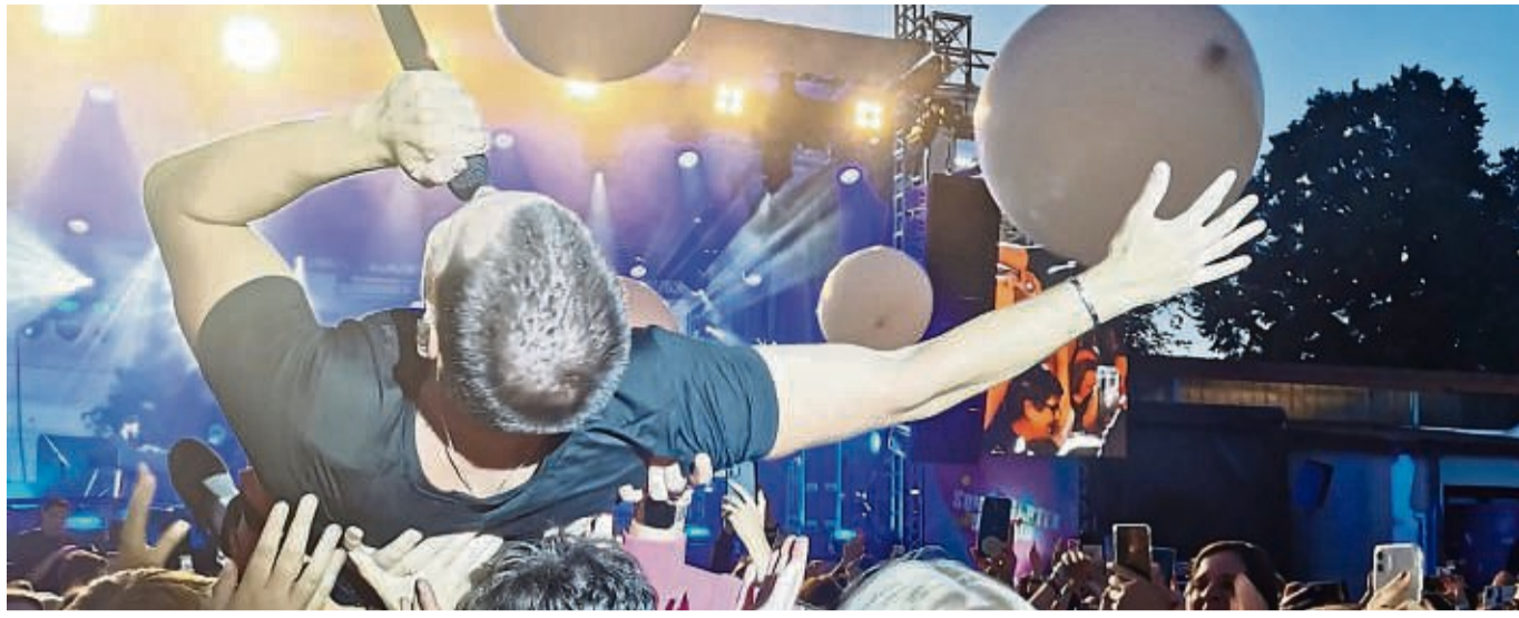
Ein Star zum wortwörtlich Anfassen: Wincent Weiß beim Stage Diving in Bad Sooden-Allendorf.