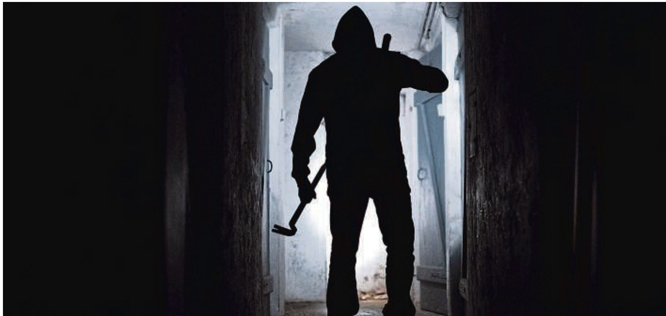
Ein Kellereingang liegt oft etwas versteckt und eher im Dunkeln - und ist auch deswegen ein guter Einstiegsort für Einbrecher.

Selbst wenn es keine Verbindungstür zur Wohnung