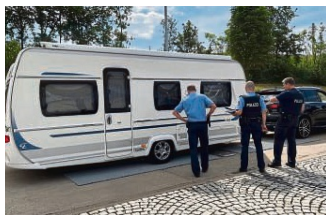
Reiseverkehr im Fokus: Beamte der Autobahnpolizei Bad Hersfeld überprüfen am Kirchheimer Dreieck ein Wohnwagengespann.

Bei der Kontrolle der bei-den Insassen war schnell klar, dass hier Drogen im Spiel waren und auch bei der Durchsuchung des Autos wurden die Beamten sofort fündig. Kurzerhand wurden Auto, Insassen und der Dro-genfund zur Autobahnpoli-zeistation nach Bad Hersfeld gebracht, wo weitere Beweise gesichert wurden. Auch der nächste Pkw, der den Beam-ten auffiel, war wieder kein Wohnwagengespann. Viel-mehr kam der Fahrer wegen seiner Fahrweise nicht um ei-ne Kontrolle herum. Die Be-amten stellten Atemalkohol fest und mussten auch diesen Autofahrer zwecks Blutpro-benentnahme zur Station bringen. Zwischenzeitlich wurden aber auch die ersten Urlaubsreisenden mit ihren