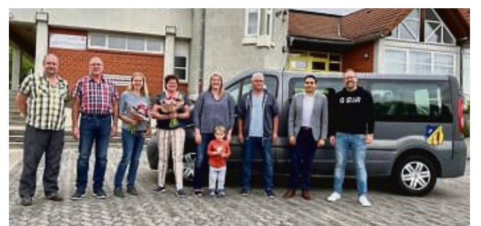
Zufrieden: Die Beteiligten des von der Schenklengsfelder Bürgerliste initiierten Bürgerbus-Probemonats zogen nach dem Testlauf ein positives Fazit.

„Auch nach Ablauf unseres Angebots gehen erfreulicherweise immer wieder Anfragen ein, was uns in der weite-