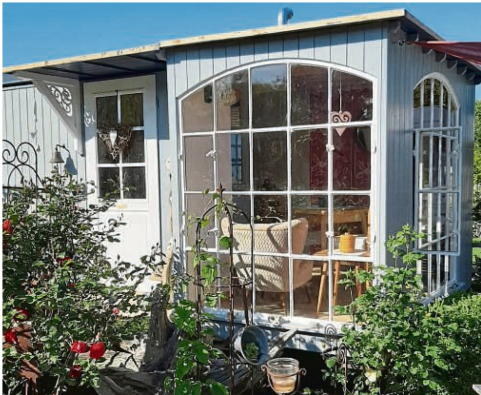
Viele Menschen nutzen für die kleine Flucht aus dem Alltag ihre Schrebergartenlaube. Mit einer guten Ausstattung wird es erst richtig gemütlich.