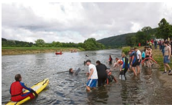
Es kostet eine gewisse Überwindung: Beim Weserschwimmen haben sich insgesamt rund 40 Menschen in den Fluss getraut, obwohl alles andere als sommerliche Temperaturen herrschten.

Wesertal/Bodenfelde – Die ersten sind schon vor 10 Uhr bereit. Sie stehen in Badehose oder Badeanzug auf der Weserpromenade und bibbern leicht in sich hinein. Im 14 Grad kühlen Luftzug ist es hier oben am Fähranleger in Oedelsheim noch um zwei Grad kälter als unten im Wasser. Aber bevor die DLRG den Start freigibt, muss Klaus Gronemann noch die Bedingungen des nunmehr elften Weserschwimmens erläutern. Das Wichtigste: Alle Teilnehmer sollen sich innerhalb der von den DLRG-Booten abgesicherten Bereiche bewegen.