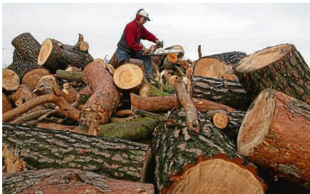
Wer das Holz direkt im Wald transportgerecht zerkleinern möchte, braucht einen Motorsägenschein.

Privatleute können festgelegte Menge selbst abholen