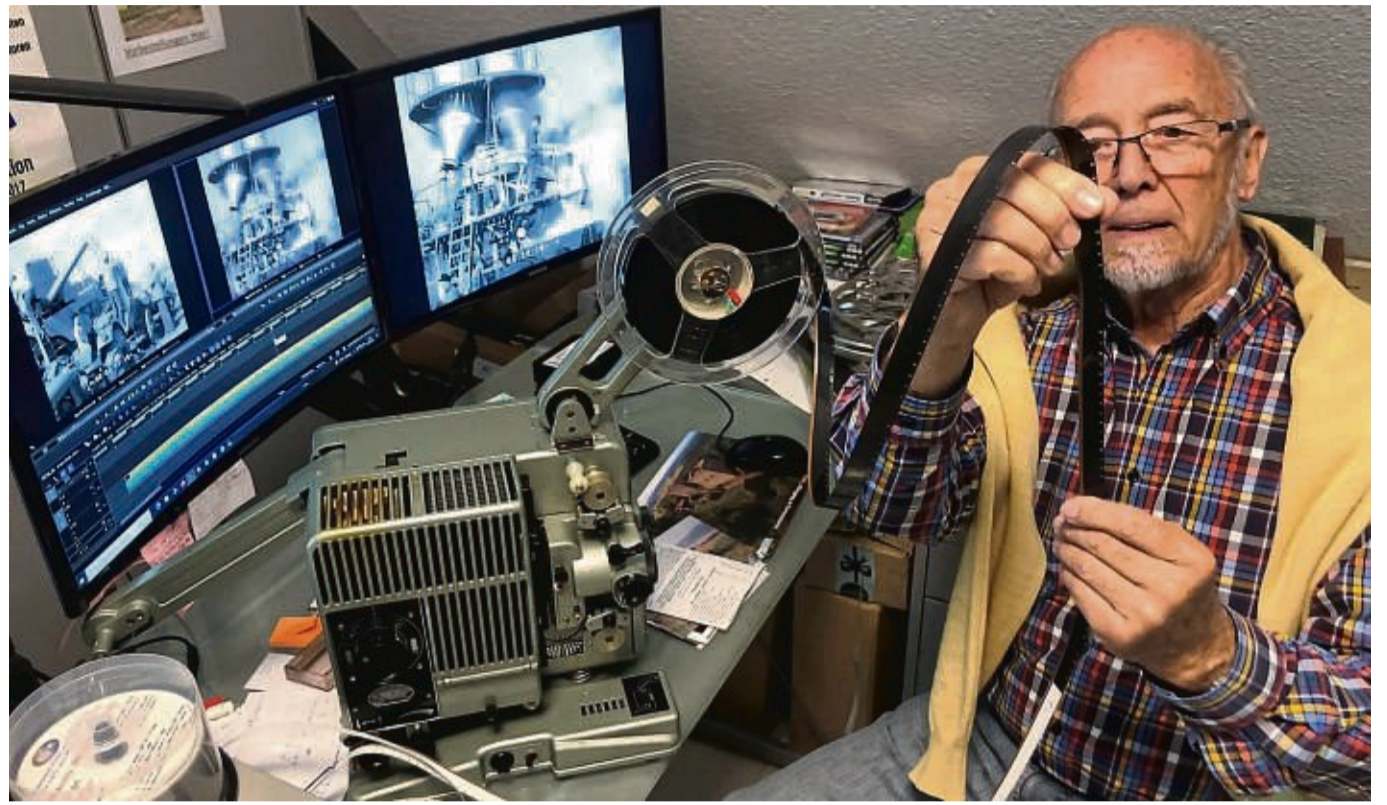
In HD-Qualität: Das Bild stammt aus einem Film von 1964, den Rudi Killian erstellt hat. Zu sehen sind zwei Frauen vor einem Fachwerkhaus in Leckringhausen.

talisiert hat. Nun hat sich der 80-jährige ein neues Projekt vorgenommen – „eine letzte Lebensaufgabe“, wie er sagt: Er möchte den alten Filmen mithilfe einer neuen Digitalisierungstechnik nun zu einer so hohen Bildauflösung verhelfen, dass sie ohne Flimmern und Wackeln im Kino vorgeführt werden können. Bei seinen Recherchen ist