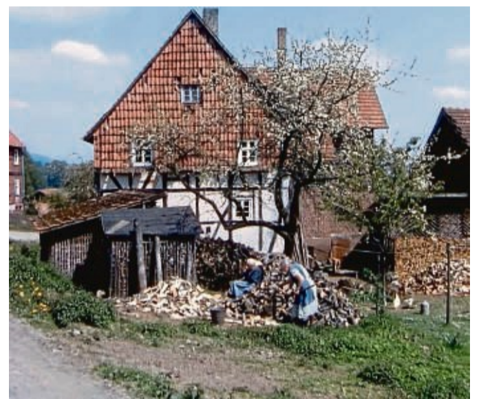
Heimatfilmer Dirk Lindemann: Der 80-Jährige beim Sichten einer alten Filmrolle. Knapp 200 Filme möchte er in HD-Qualität digitalisieren lassen und dann neu vertonen.

Die Bilder sind gestochen scharf, nichts ruckelt oder springt. Die handelnden Personen könnten Schauspieler sein, die das Leben der 1950er-Jahre in Wolfhagen und den umliegenden Dörfern nur nachstellen. Gebäude, Maschinen, Fahrzeuge, Landschaft wirken wie das Resultat eines aufwendig gestalteten Filmsets. Die hohe Auflösung macht die historischen Aufnahmen modern. Wenn Dirk Lindemann einen digitalisierten Film aus Lübeck bekommt, macht er