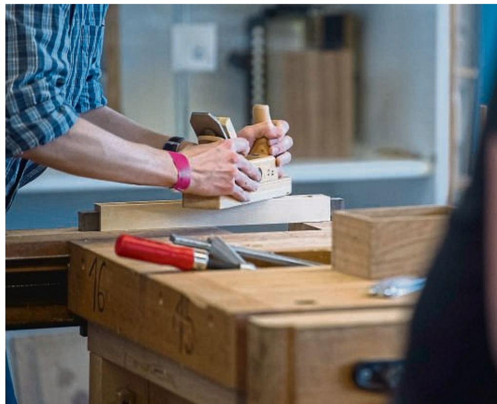
Bevor es an die Arbeit geht , sollten angehende Azubis ihre Rechte zu Vergütung, Urlaub und Co. kennen.

Der Urlaubsanspruch ist im Ausbildungsvertrag festge-