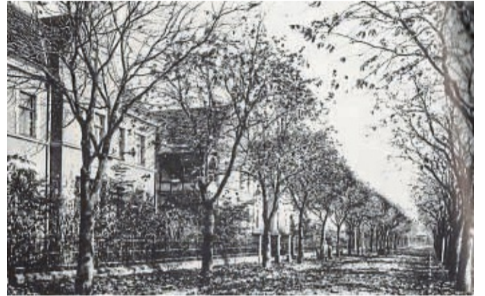
Diese Aufnahme aus dem Archiv von Klaus Leise stammt aus dem Jahr 1909 und zeigt große Kastanienbäume links und rechts der schönen Fritzlarer Allee.