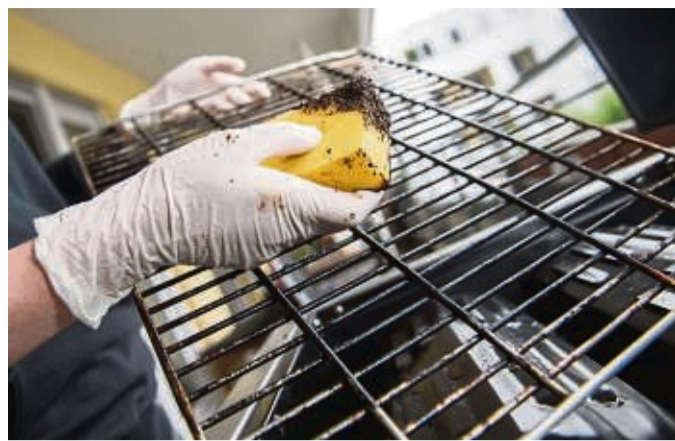
Kaffeessatz lässt sich als Scheuermittel für Grillrost und Herdplatte weiterverwenden.

Diese fünf Punkte sind für Azubis wichtig