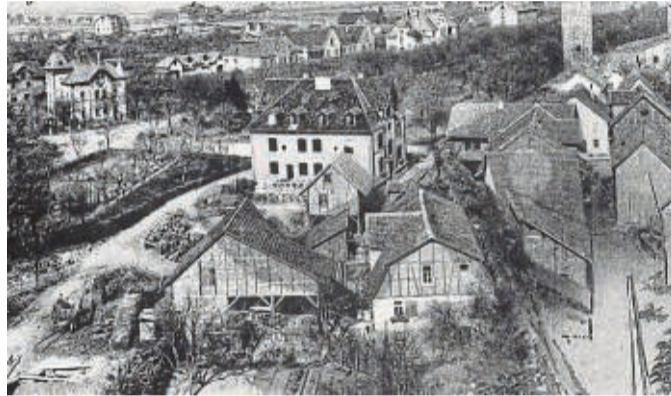
Die Aufnahme von 1907 zeigt den Verlauf der Allee. Am Nordrand sind das Haus Stegner – die Villa Dora – sowie die damaligen Offiziershäuser und das Offizierskasino zu erkennen.

historischer Stadtmauer und dem davor befindlichen Baumbestand bietet sie mit ihrem parkähnlichen Charakter eine schöne Kulisse für Begegnungen und Gespräche, zum Ausruhen und Spielen, aber auch für Veranstaltungen. Dementsprechend wurde die Allee im Laufe der Jahrhunderte für die unterschiedlichsten Zwecke genutzt. So wurde hier unter anderem viele Jahre lang der Pferdemarkt abgehalten, Künstler traten auf und auch das Militär präsentierte sich an diesem Ort. Ein weiteres Mal hat Klaus Leise sein Fotoarchiv geöffnet und so ist eine Zeitreise in die Geschichte der Fritzlarer Allee möglich.