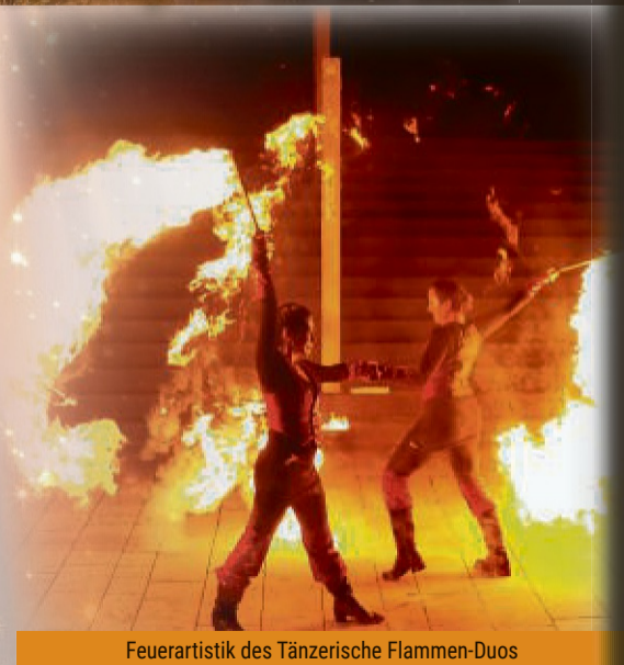
Feuerartistik des Tänzerische Flammen-Duos

Informationen erteilt: Tourist-Information, Rathaus, 34596 Bad Zwesten, Telefon 05626 773, E-Mail: tourismus@badzwesten.de , www.bad-zwesten.de