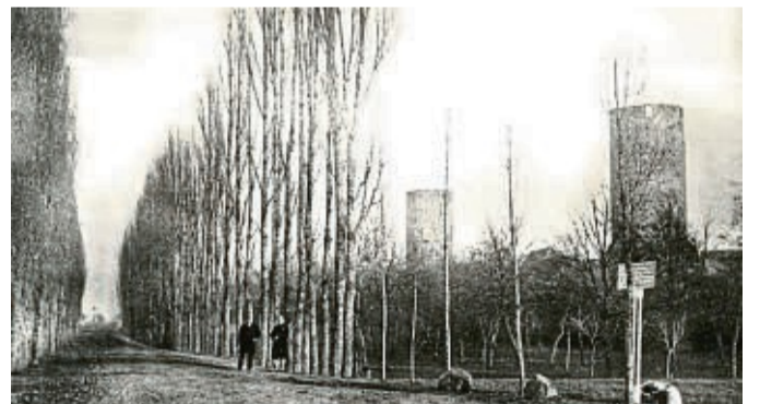
Das vermutlich älteste Foto von der Allee wurde 1868 vom Berliner Fotografen August Jablonski aufgenommen.

Speedlog GmbH Internationale Spedition sucht Kraftfahrer im Nah- und Fernverkehr, Tel.: 0561-589468107 oder bewerbung@speedlog.de