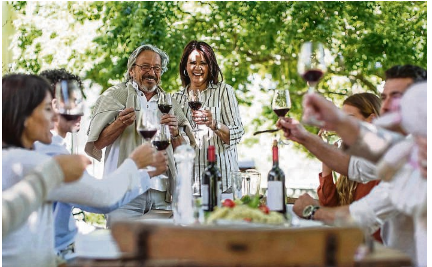
Endlich gibt es wieder große Gartenpartys! Da darf auch die Festtafel feierlich und stilvoll gedeckt werden.

Alternativ sei ein weniger stark konzentriertes Produkt die bessere Wahl. So enthält ein als Parfüm deklariertes Produkt 20 bis 40 Prozent Duftstoffe, in Eau de Parfum sind es 10 bis 20 Prozent. Eau de Toilette enthält nur 8 bis 10 Prozent Duftstoffe, Eau de Cologne 3 bis 8 Prozent. Generell benötigt man also von einem Parfüm mit höherer Duftkonzentration weniger.