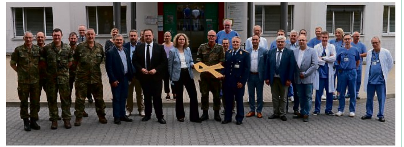
Gelbe Schleife für Asklepios: Soldaten, Angehörige der Klinik sowie Vertreter aus Politik und anderen Gremien setzen gemeinsam ein Zeichen der Solidarität und Wertschätzung.