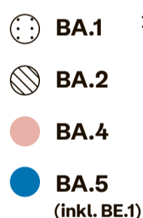
Entwicklung der Omikron-Varianten

Omikron war schon immer ansteckender als frühere Virusvarianten. Die Sublinie BA.5 (inkl. BE.1) von Omikron macht einen großen Teil der Sommerwelle aus und verbreitet sich rasant, auch weil persönliche Schutzmaßnahmen abgenommen haben und weniger Menschen Maske tragen. Auch wer 3-fach geimpft oder genesen ist, kann sich mit BA.5 (inkl. BE.1) anstecken.