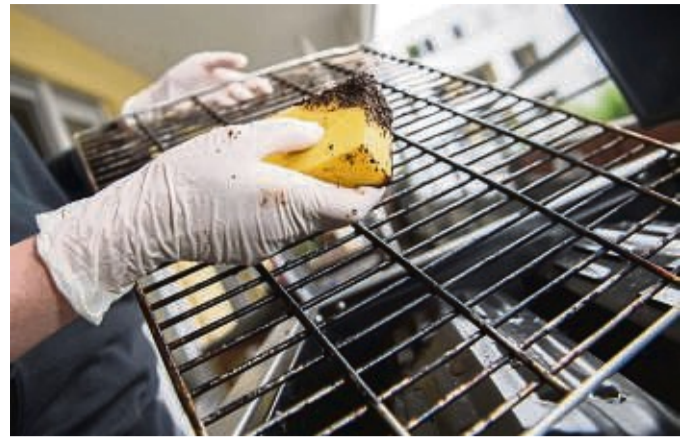
Kaffeesatz lässt sich als Scheuermittel für Grillrost und Herdplatte weiterverwenden.