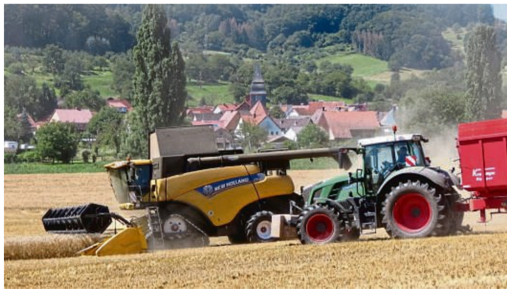
Sommerzeit ist Erntezeit: Aktuell ist überall im Kreis auf den Feldern viel los, die Ernte steht an.

Aufgrund der unmittelbar bevorstehenden Reform der Gemeinsamen Agrarpolitik (GAP) können die Module C.2 - Beibehaltung von Zwischenfrüchten, C.3.1 - einjährige Blühflächen und C.3.4 - Ackerrandstreifen nicht mehr angeboten werden, die Maßnahme C.1 - vielfältige Kulturen im Ackerbau wird für dieses Jahr ausgesetzt und kann voraussichtlich in 2023 wieder neu beantragt werden. Im Übrigen gibt es keine wesentlichen inhaltlichen Änderungen. Weitere Informationen sind im Fachdienst Ländlicher Raum, Friedloser