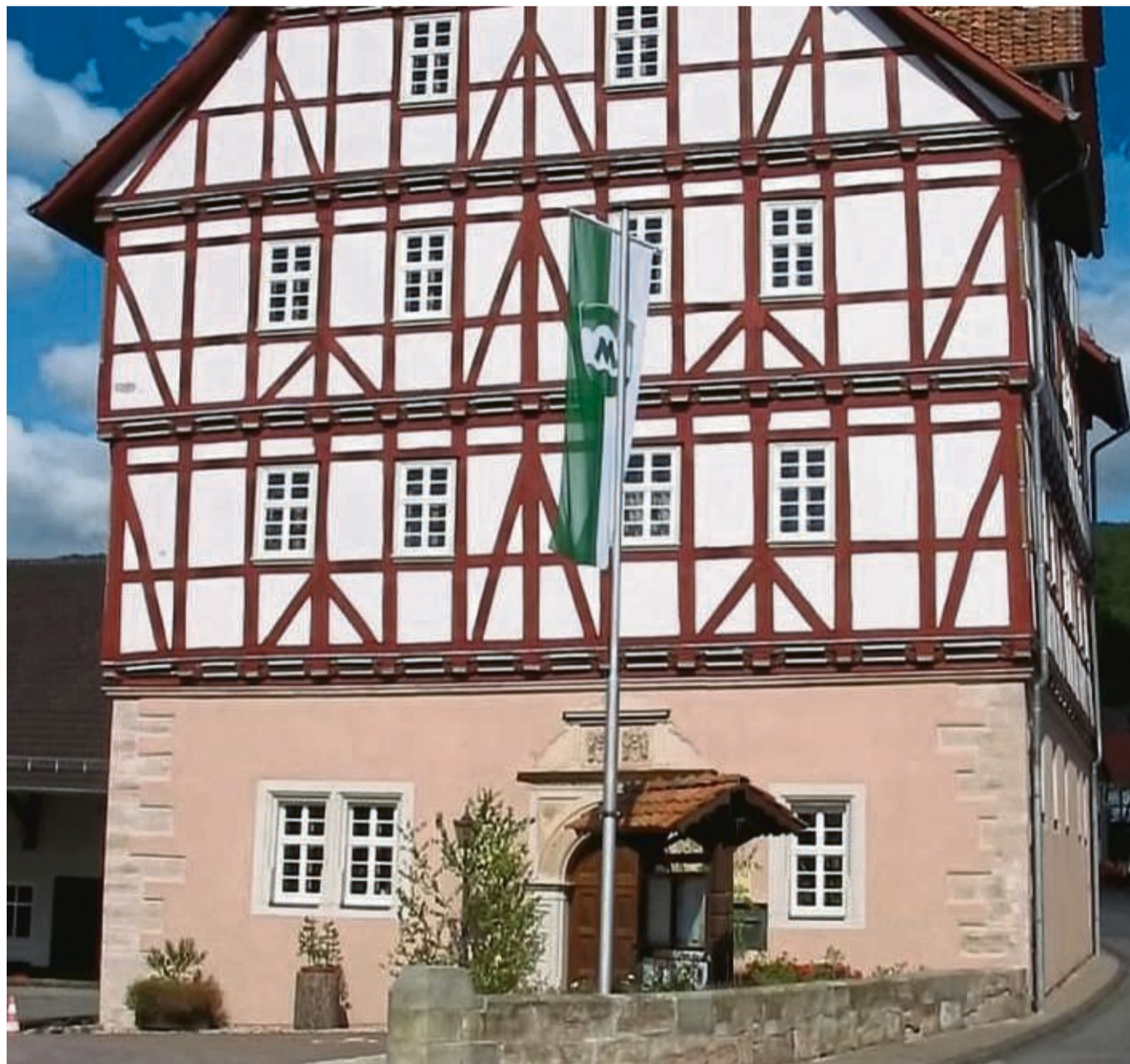
Hier könnte es kühler werden: Aktuell suchen die Gemeinden nach Einsparmöglichkeiten in Sachen Energie. Eine Variante wäre die Raumtemperatur wie hier im Rathaus von Grebendorf zu senken.

Im Zuge des Beitritts Meinhardts zu den Klimakommunen habe die Gemeinde jetzt den gesamten Energieverbrauch von Liegenschaften bis zu Fahrzeugen gelistet. Nach der Sommerpause will der Gemeindevorstand dem Parlament dazu Details sowie