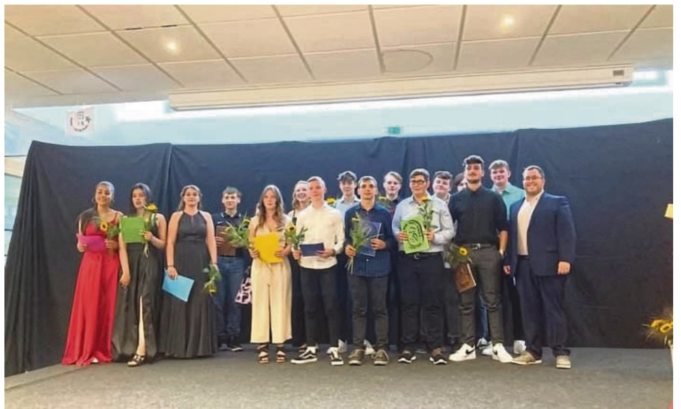
Und auch für sie gab es Grund zur großen Freude: Die Schüler der Abschlussklasse 10aR mit ihren Zeugnissen in der Hand.