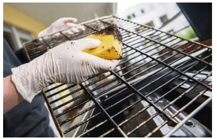
Kaffeesatz lässt sich als Scheuermittel für Grillrost und Herdplatte weiterverwenden.