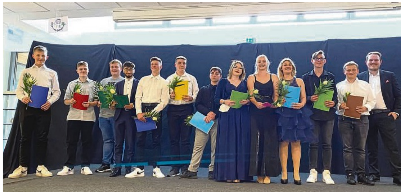
Haben ihren Abschluss in der Tasche: Die Schüler der Klasse 9aH der Adam-von-Trott-Schule Sontra können nun den nächsten Schritt angehen.

Für die musikalische Umrahmung sorgte die neue Förderstufenschulband.