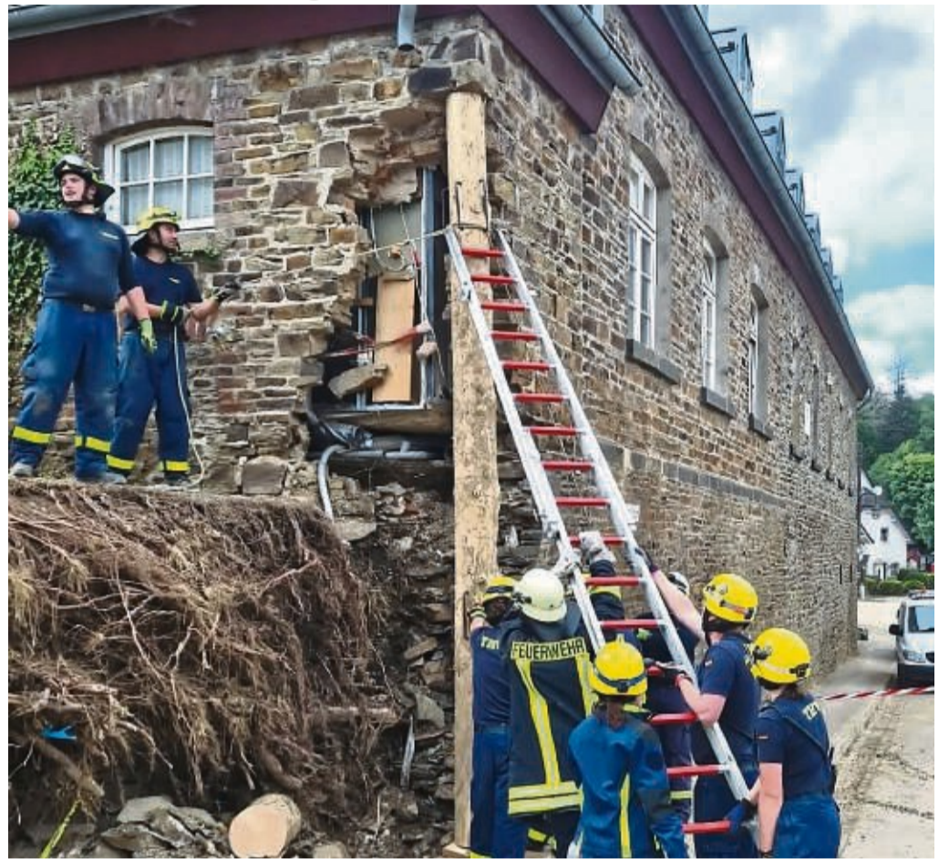
Gemeinsam stark: Zusammen mit Feuerwehrmännern, die zufällig vorbeikamen, stützt das Eschweger THW ein Haus ab. Das Holz hatten sie zuvor im Wald geschlagen. Nebenbei haben die Eschweger an diesem Tag zwei Wochen nach der Flut auch noch eine Katze gerettet.

Gut, wenn die ehrenamtlichen Hilfskräfte da auf Verständnis von Familien und Arbeitgebern treffen. ts