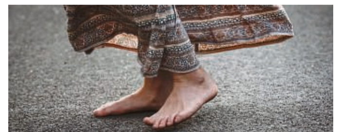
Tanzen als Hobby: Ob Walzer, Standard oder Jazz, Tanzen gibt es in vielen Formen.