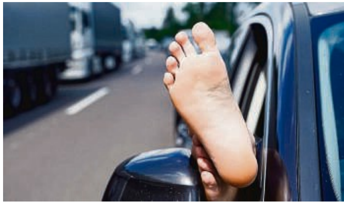
Gut gelüftet: Füße hochlegen beim Autofahren mag für Beifahrer bequem und erfrischend sein, kann aber sehr schnell extrem gefährlich werden.