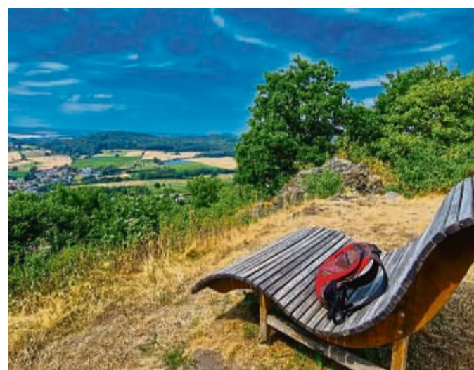
Durchatmen: Rund um den Hessenturm laden zahlreiche Holzliegen zur Verschnaufpause ein.

„Ich habe noch niemanden erlebt, der nicht aus der Puste war, als er den Gipfel erreicht hat“, so die begeisterte Wanderin, die dennoch jedem rät, die Anstrengung auf sich zu nehmen – denn: „Wenn man wieder zu Atem gekommen ist, lohnt sich ein Aufstieg auf das Wahrzeichen Niedensteins – den Anfang des 20. Jahrhunderts von Niedensteinern in Eigenleistung komplett aus Holz erbauten Hessenturm.“ Ganz oben bietet sich eine faszinierende Aussicht. „Ich liebe es, nach dem steilen Aufstieg durchzuatmen, um dann den Blick ins Hessenland schweifen lassen zu können.“ Das Wörtchen „Hessenland“ benutze sie