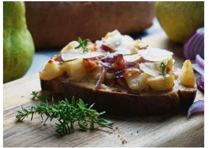
Für die Birnen-Thymian-Stulle werden drei Sorten Käse verwendet.