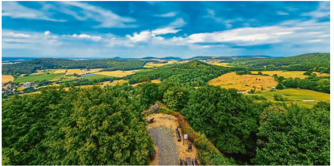
Muss man gesehen haben: Der Hessenturm bietet weite Ausblicke.

Weiter unterstützte die Kreissparkasse Schwalm-Eder mit einer zweckgebundenen Spende von 1500 Euro die Umrüstung. Der Rest wird aus der Vereinskasse bezahlt.