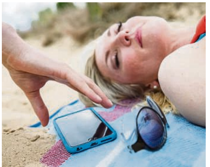
Im Urlaub ist es schnell passiert: Das Handy wurde gestohlen. Umso wichtiger ist ein guter Schutz der Daten.

Radurlaub im Oberpfälzer Wald Radurlaub ist beliebt, nicht nur, weil sich Land und Leute dabei ganz unmittelbar kennenlernen lassen. In ursprünglichen Mittelgebirgsregionen wie dem Oberpfälzer Wald radelt man durch stille Wälder, idyllische Flusstäler und über aussichtsreiche Höhenrücken. Die Genussstour „Vom Zoiglbier zum Bockl“ ist eine von sechs „Wirtshausstouren“. Sie führt über den längsten Bahntrassen-Radweg Bayerns sowie zu vielen traditionsreichen Biergärten, Dorfwirtschaften und Zoiglstuben. Aber auch in der „Oberpfälzer Radl-Welt“ mit ihren thematischen Erlebniswelten warten eine große Auswahl an radlerfreundlichen Gastgebern und viel regionale Kulinarik. Im Internet gibt es weitere Informationen zu allen Touren, informatives Prospektmaterial sowie ein Radl-Navi. djd-k