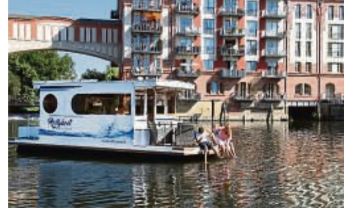
Freizeitkapitäne können führerscheinfrei Hausboote mieten und immer woanders ankern.

Stand-up-Paddling, ein Segeltörn oder eine Fahrt mit dem Tretboot: In Brandenburg an der Havel gibt es für Wassersportfans viele Möglichkeiten zur aktiven Erholung. Fast 20 Prozent der Stadtfläche sind vom blauen Nass bedeckt. Und so bewegt man sich in und um die drei historischen Stadtkerne der Altstadt, Neustadt und Dominsel am besten auf dem Wasser fort - Kajaktouren durch historische Kanäle und die Havel, ein Drive-in-Supermarkt für Hausboote und Anlegemöglichkeiten mitten in der Stadt inklusive. Unter erlebnisbrandenburg.de finden Touristen Informationen zu Bootsvermietungen und schönen Routen. An Land bewachen die Möpse des Brandenburger Ehrenbürgers Vicco von Bülow alias Loriot den gesamten Innenstadtbereich, an der Johanniskirche sind sie sogar im Rudel anzutreffen. djd