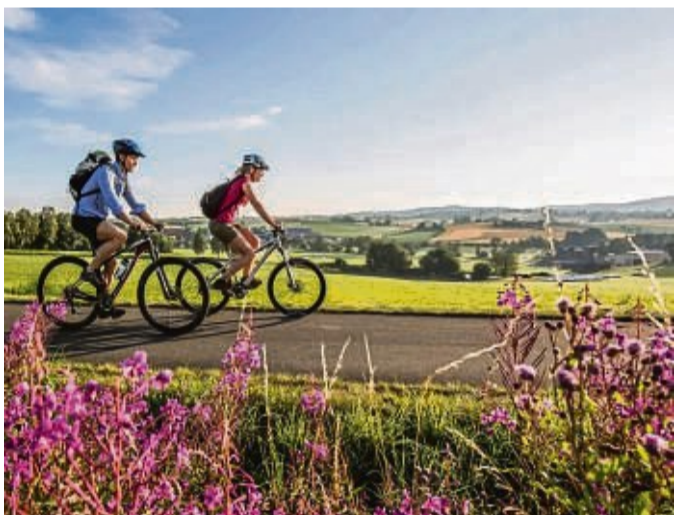
Die Oberpfälzer Radl-Welt können Radurlauber intensiv und genussvoll zugleich kennenlernen.