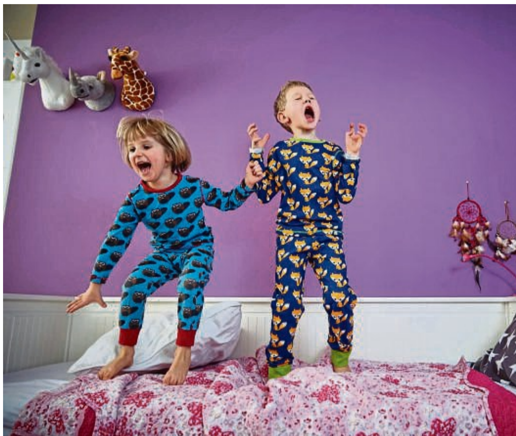
Alarm im Kinderzimmer: Jungen sind oft die impulsiveren Kinder. Aber auch Mädchen können sich kämpferisch zeigen, wenn sie gleichgeschlechtliche Vorbilder haben.

Bei Jungen, die mit Autos hin- und herfahren, sei das Spiel oft begrenzt. Jungenexperte Winter empfiehlt, das Spiel zu erweitern: „Dann sind da nicht nur Autos, die