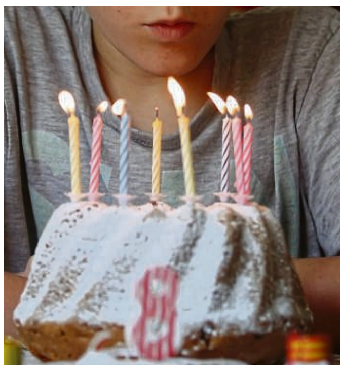
Schön die Kerzen ausblasen: Ab dem vierten Geburtstag müssen dann auch die Eltern nicht mehr dabei sein.

Das Fest sollte aber ohnehin nicht zu lange gehen. Maximal zwei bis drei Stunden, rät die Entwicklungspsychologin.