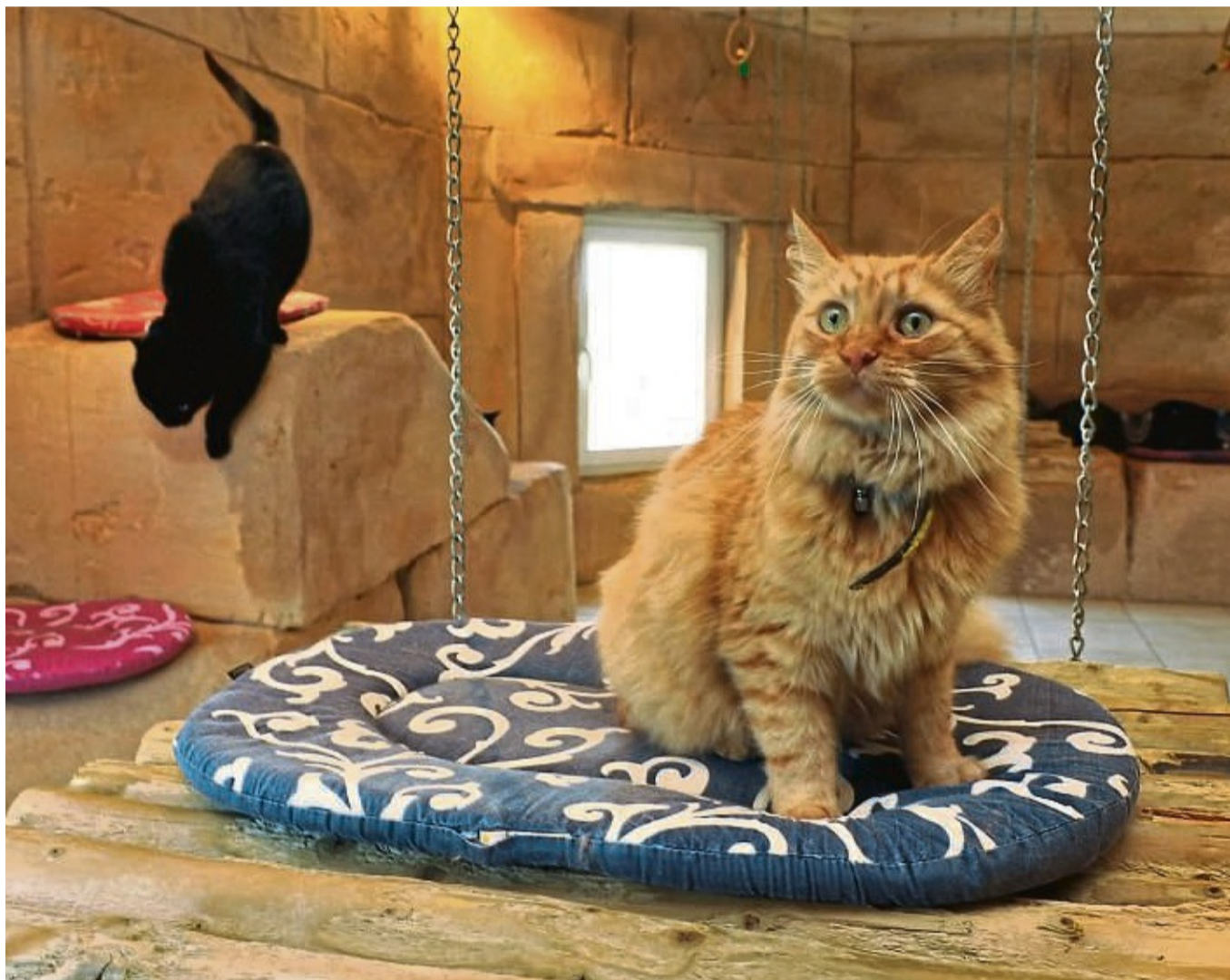
In der Urlaubszeit steigt die Nachfrage nach Plätzen in Tierpensionen und Tierheimen.