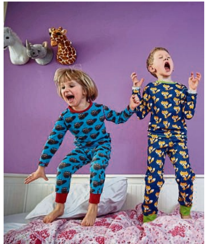
Alarm im Kinderzimmer: Jungen sind oft die impulsiveren Kinder. Aber auch Mädchen können sich kämpferisch zeigen, wenn sie gleichgeschlechtliche Vorbilder haben.

Dass Kleidung schmückt, lernen Mädchen durch Erwachsene. „Wenn man ihnen