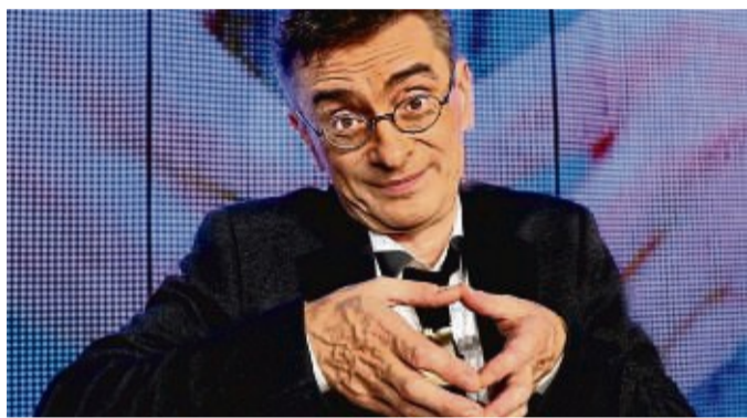
Mathias Richling: Der bekannte Star-Kabarettist und Politik-Beobachter tritt am 9. Oktober in der Frankenger Kulturhalle auf.

Karten gibt es bereits im Vorverkauf in der Buchhandlung Jakobi, in der HNA-Geschäftsstelle sowie online auf adticket und reservix zum Preis von 25, 29 und 32 Euro. Bereits für frühere Termine gekaufte Karten behalten ihre Gültigkeit.