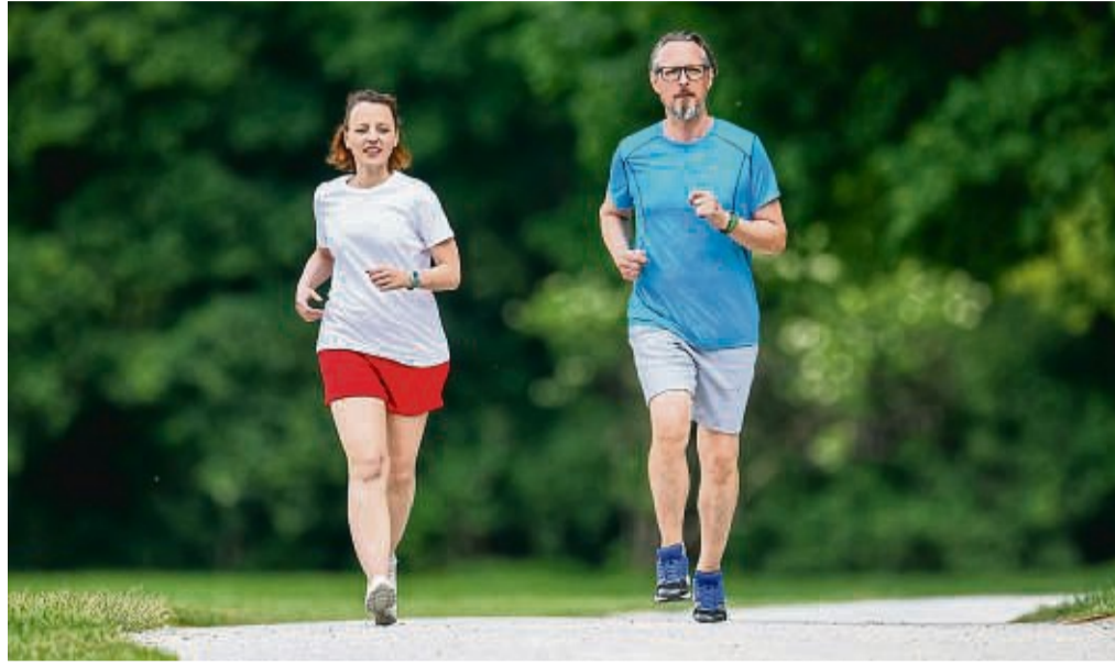
Am besten läuft es sich, wenn das Mittagessen nicht mehr schwer im Magen liegt. Daher sollten zwischen der Mahlzeit und dem Lauftraining ungefähr zwei bis drei Stunden Pause liegen.

INTERVIEW Wie man Mahlzeiten und Sport in Einklang bringt