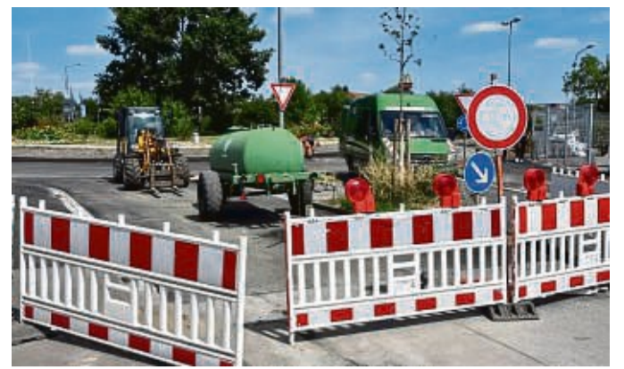
An der Baustelle in der Briloner Landstraße wird der Kreisverkehr für den Verkehr freigegeben.