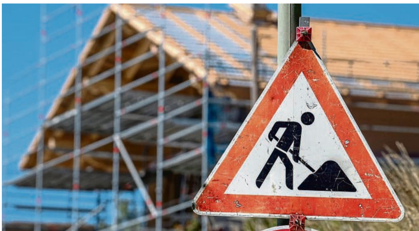
In der Ederseeregion werden viele neue Ferienhäuser, Ein- und Mehrfamiliengebäude entstehen.

Im „Sondergebiet Fremdenverkehr“ liegt auch die kürzlich fertiggestellte Adventure-Golf-Anlage, das neben geplanten Ferienresort Edersee mit Tiny-Houses sowie das ebenfalls geplante Ferien-Chalet-Dorf oberhalb des Sperrmauerparkplatzes. Sollte sich das Robeo-Projekt tat-