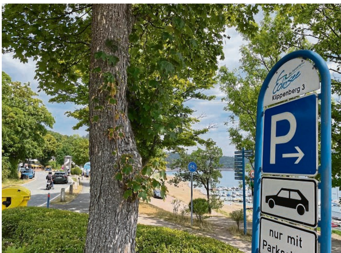
oft diskutiert, aber nie umgesetzt: Die Waldecker Stadtverordneten peilen ein autofreies Wochenende am Edersee an – möglichst in einer gemeinsamen Aktion mit Edertal, Vöhl und dem Edersee Marketing.