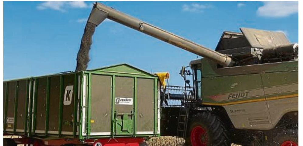
Rapserte in Mengerschinghausen: Die schwarze Ölfrucht wird vom Mähdröschler auf ein Transportfahrzeug geladen.