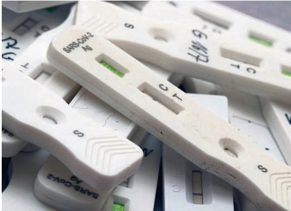
Infiziert man sich mit Corona, muss man sich laut der aktuellen Verordnung des Landes Hessen für fünf Tage in Quarantäne begeben.

Gleichzeitig weist der Kreis darauf hin, dass auch der Nachweis über einen positiven PCR-Test ausreichend sei, damit Arbeitgeber den Ver-