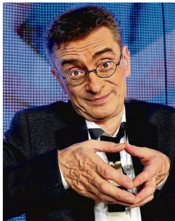
Mathias Richling: Der Kabarettist und Politikbeobachter tritt am 9. Oktober in der Frankenger Kulturhalle auf.

■ CINE K KINO Korbach Minions: Sa u. So 13, 15 u. 17.45, Mo bis Mi 15 u. 17.30 h Thor: Love and Thunder (3D): Sa bis Di 17.15 u. 19.45 h, Sa auch 22.30 h, Mi 17.15 h Bibi & Tina - Einfach anders: Tägl. 15 h, Sa u. So auch 13 h Bullet Train: Tägl. 17 u. 19.45 h, Sa auch 21.45 h DC League of Super-Pets: Sa u. So 13 u. 15.15, Mo bis Mi 15 h Der Vater der Braut: Mi 19.45 Everything Everywhere All At Once: Mi 19.45 h Gugelhupfgeschwader: Sa u. So 13, 15, 17.15 u. 19.30 h, Sa auch 22.30 h, Mo bis Mi 15, 17.15 u. 19.30 h Jurassic World - Ein neues Zeitalter: Tägl. 15 h, Mo auch 19.30 h Liebesdings: Tägl. 17.45 h Mia and Me - Das Geheimnis von Centopia: Sa u. So 13 h Monsieur Claude und sein großes Fest: Sa bis Di 19.45 h The Black Phone - Sprich nie mit Fremden: Sa 22.30 h, Mi 19.45 h Top Gun - Maverick: Sa 19.45 u. 22 h, So u. Di 19.30