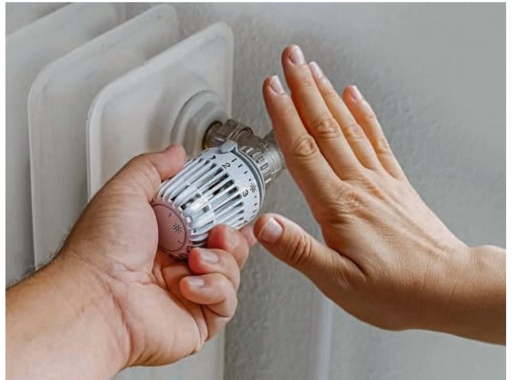
Die Kreisverwaltung in Waldeck-Frankenberg setzt als maximale Raumtemperatur in den Schulen 20 Grad an, in Verwaltungsgebäuden 19 Grad.