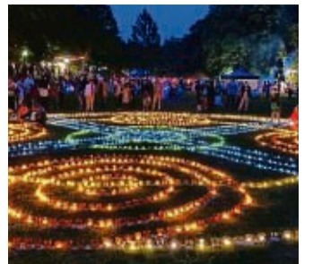
Stimmungsvolle Atmosphäre ist beim Lichterfest Programm.