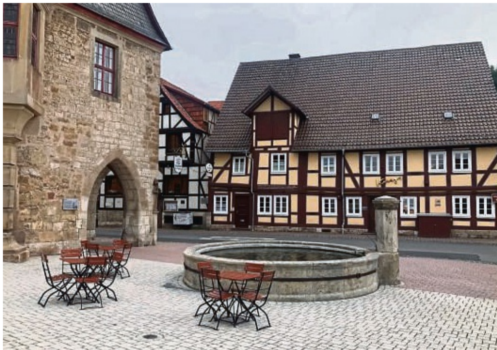
Tische und Stühle stehen schon: Auf dem neuen Rathausvorplatz in Korbach hat die Stadt zu „Test-Zwecken“ Sitzgelegenheiten aufgestellt. Sie hofft nun darauf, dass dort irgendwann auch ein Café-Betrieb realisiert wird.