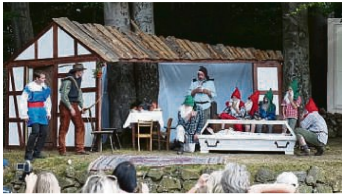
Märchen auf der Naturbühne: Nach der Corona-Pause laden die Laiendarsteller zu „Schneewittchen und die sieben Zwerge“ ein.