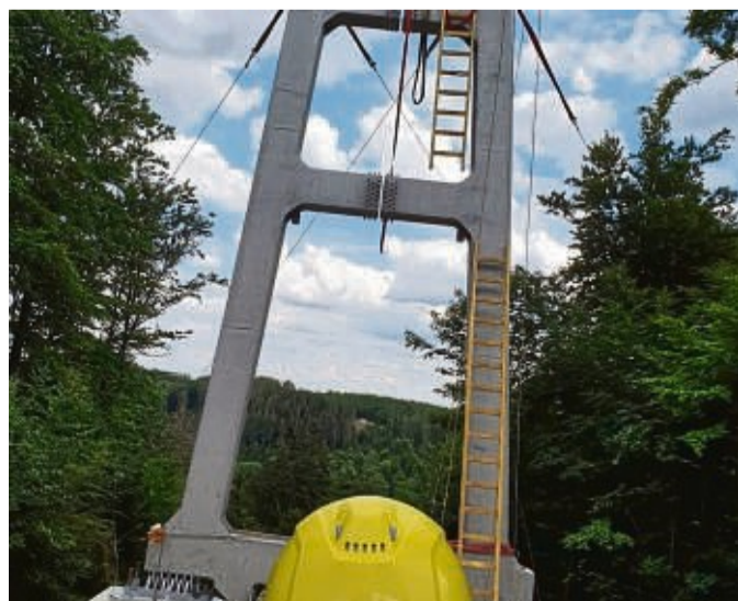
Neben der Mühlenkopfschanze wurde diese Stütze errichtet.