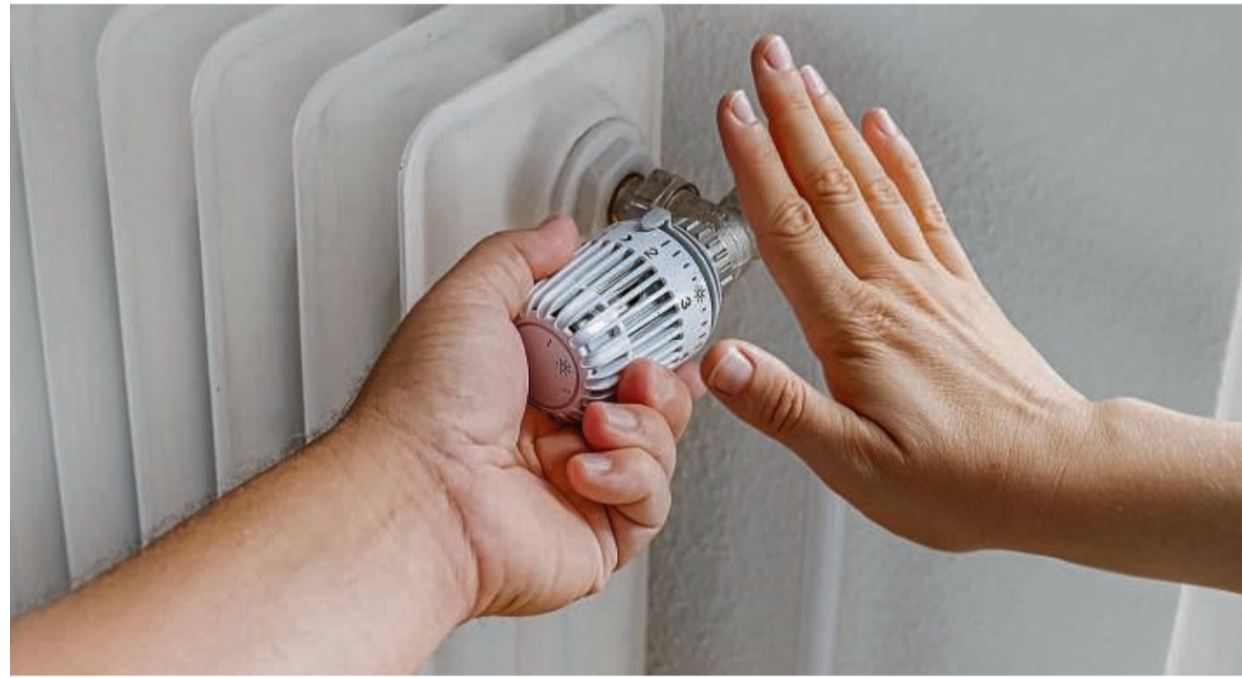
Die Kreisverwaltung in Waldeck-Frankenberg legt als maximale Raumtemperatur in den Schulen 20 Grad fest, in Verwaltungsgebäuden 19 Grad.

Das Konzept des Fachdiensts Gebäudewirtschaft soll den Verbrauch in allen Bereichen senken: Heizungs- und Lüftungsanlagen werden angepasst und optimiert, Temperaturen und Nutzungszeiten künftig teilweise vorgegeben. Auch die Hausmeister werden in einem energieeffizienteren Umgang mit den Anlagen geschult und alle Mitarbeiter des Landkreises für umsichtiges Handeln beim Verbrauch von Energie sensibilisiert.