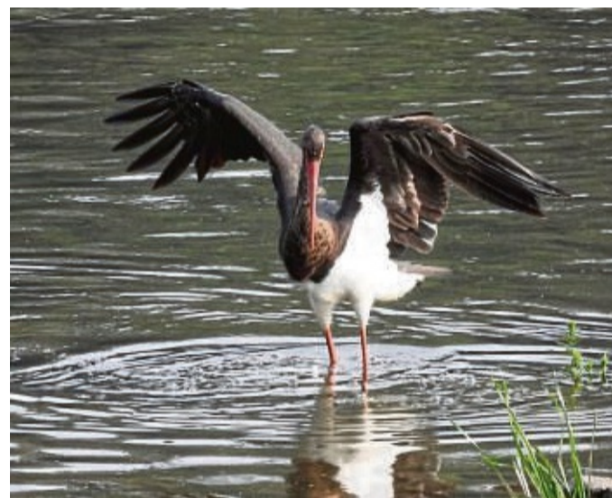
Dieser Schwarzstorch wurde kürzlich in der Eder bei Herzhausen flügel-schlagend beim Fischen entdeckt.

IBC GUSSHEIZKESSEL (GK) für Holz, Kohle & Pellets. 10 Jahre Garantie! Ab 7.499 €, bis zu 45% Förderung. www.ibc-heiztechnik.de ☎ 03632/667470