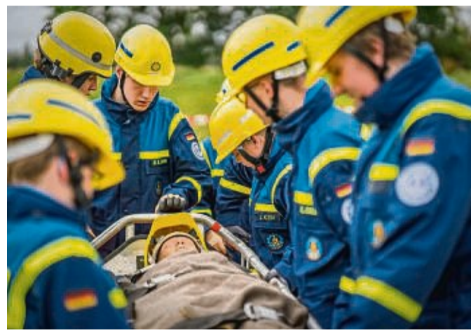
Stets kommt es bei den schwierigen Aufgaben auf Genauigkeit an, wie beim Transport einer Puppe durch einen Parcours.

men. Ebenfalls aus Nordhessen war das Team aus Frankenberg. Sie belegten den siebten Platz.