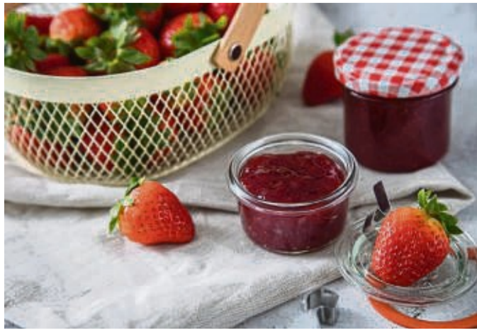
Wer die Erdbeermarmelade ohne Gelierzucker machen will, kann auch geraspelten Apfel oder Agar-Agar nehmen.