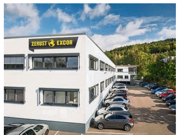
Am Firmensitz in Volkmarshausen sind 31 Mitarbeiter beschäftigt, davon neun im Außendienst für Deutschland, zwei im Außendienst für Italien.