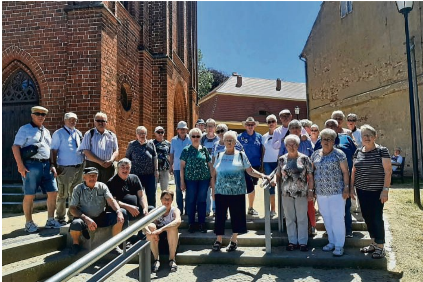
Nach Klink an der Müritz führte die Fahrt des VdK-Kreisverbands Witzhenhausen. Auf dem Foto besucht ein Teil der Reisegruppe Malchow.