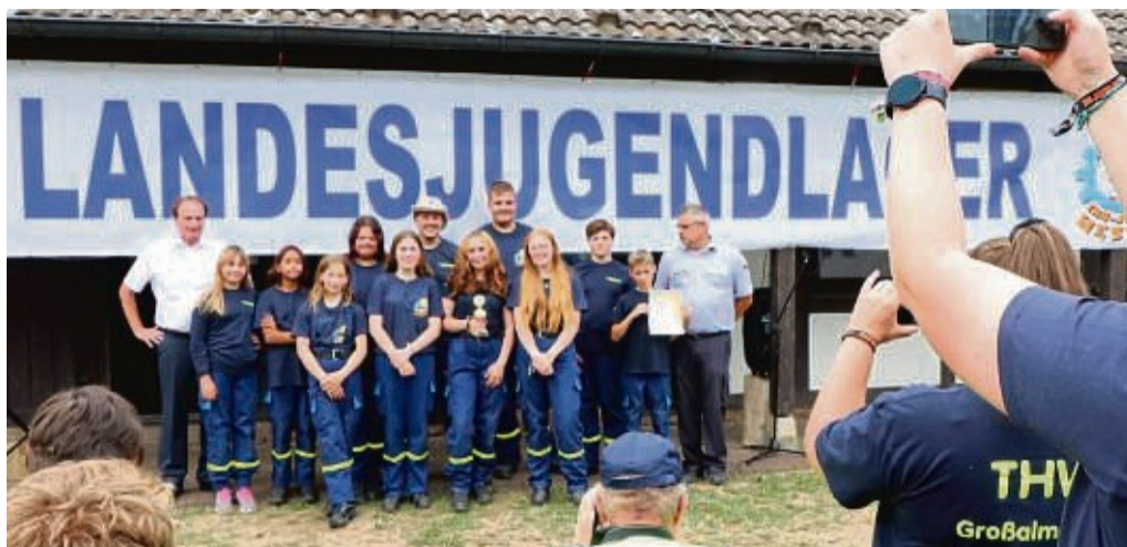
Auf dem zweiten Platz ist ein Team aus Nordhessen: Die Jugendgruppen vom THW Witzenhausen und Großalmerode traten zusammen an.

Knapp dahinter landeten zwei nordhessische Verbände: Die Jugendgruppen Witzenhausen und Großalmerode aus dem Werra-Meißner-Kreis hatten sich gemeinsam auf den Wettkampf vorbereitet und als Team teilgenom-