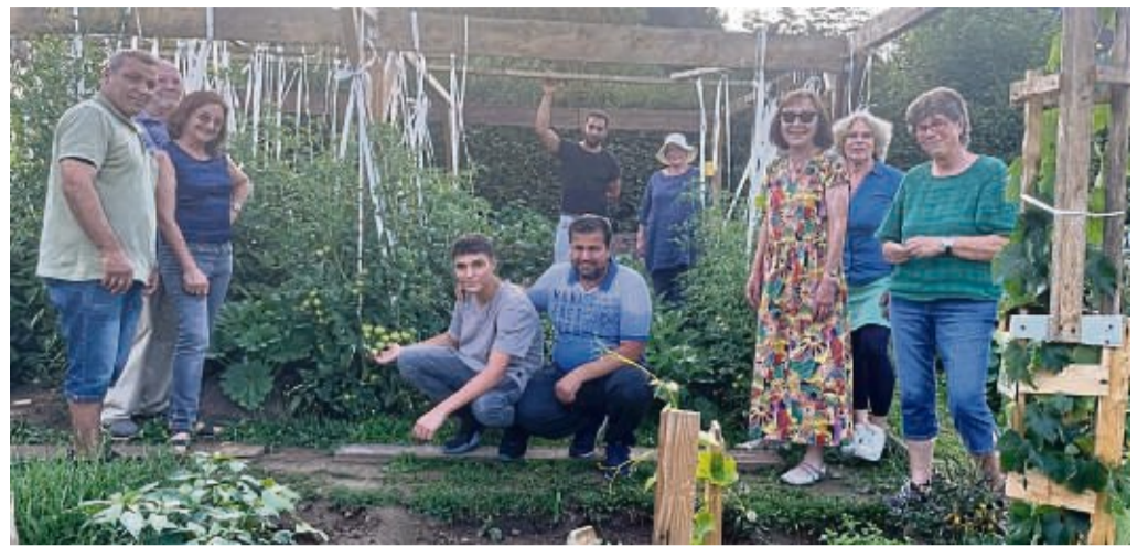
Einige Beetpächter des IGG mit dem Orga-Team der Flüchtlingsarbeit: Sie alle freuen sich, wie gut Obst und Gemüse auf dem Boden wachsen.

Vor zwei Jahren hat sich ein sechsköpfiges Orga-Team aus der Flüchtlingsarbeit über einen HNA-Artikel zusammen gefunden, um dem Wunsch nach Gartenland von Menschen, vor allem von denen mit Migrationshintergrund mit Kindern, nachzukommen. Viele besitzen keinen eigenen Garten. Die Suche nach einem geeigneten Grundstück gestaltete sich schwierig, bis dann das Grundstück „Bolzplatz 2“ von der Stadt angeboten wurde. Diese stellt es zunächst für drei Jahre zur Verfügung, Träger des Projektes ist die Evangelisch-reformierte Kirchengemeinde. Der erste Spatenstich war im Mai. Das 650 Quadratmeter große Grundstück wurde eingezäunt und