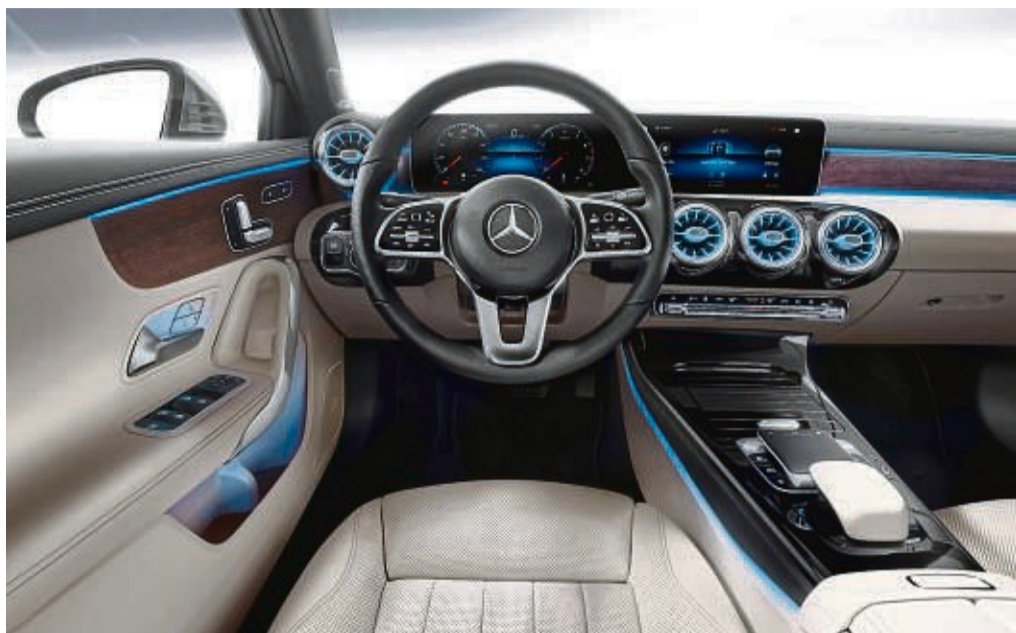
Bedienung am Lenkrad: Der Wählhebel für die Automatik ist in diesem Mercedes am Lenkrad untergebracht.

Die Handschaltung gilt nicht nur als sportlichere, sondern auch sparsamere Lösung, die niedrigeren Ver-