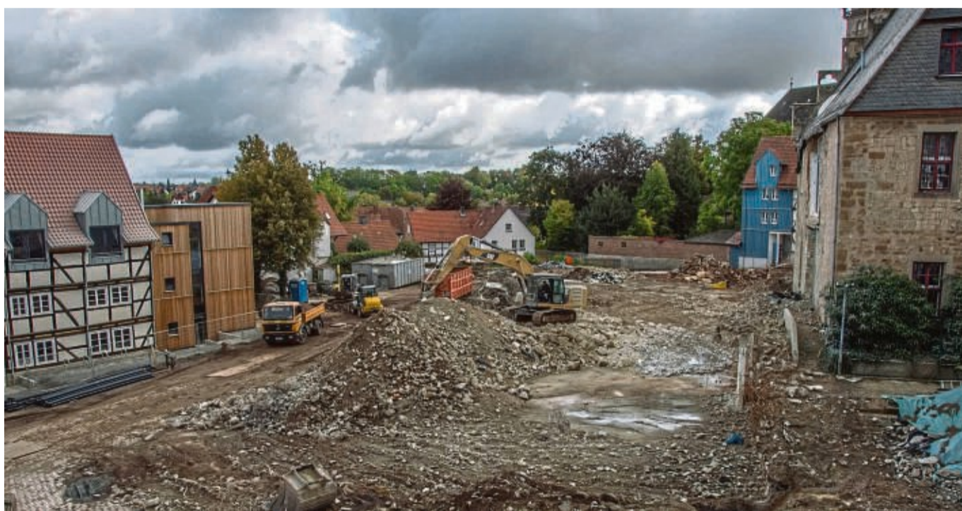
Als der Rathausanbau in Korbach 2019 abgerissen wurde, sind die Materialien sortiert worden und etliche Tonnen fanden im Neubau wieder Verwendung.

Als Modellprojekt kam der Neubau des Korbacher Rathauses in Betracht. Das mittelalterliche Gebäude wurde saniert, der Erweiterungsbau aus den 60er Jahren zurückgebaut und die Ressourcen beim Neubau wiederverwendet. Mit diesem Konzept konnten aus dem zurückgebauten Bestand 9848 Tonnen mineralisches Material zurückgewonnen werden, 61 Prozent, also mehr als 6000 Tonnen, wurden direkt im Neubau wiederverwendet. Rund 1000 Tonnen wurden