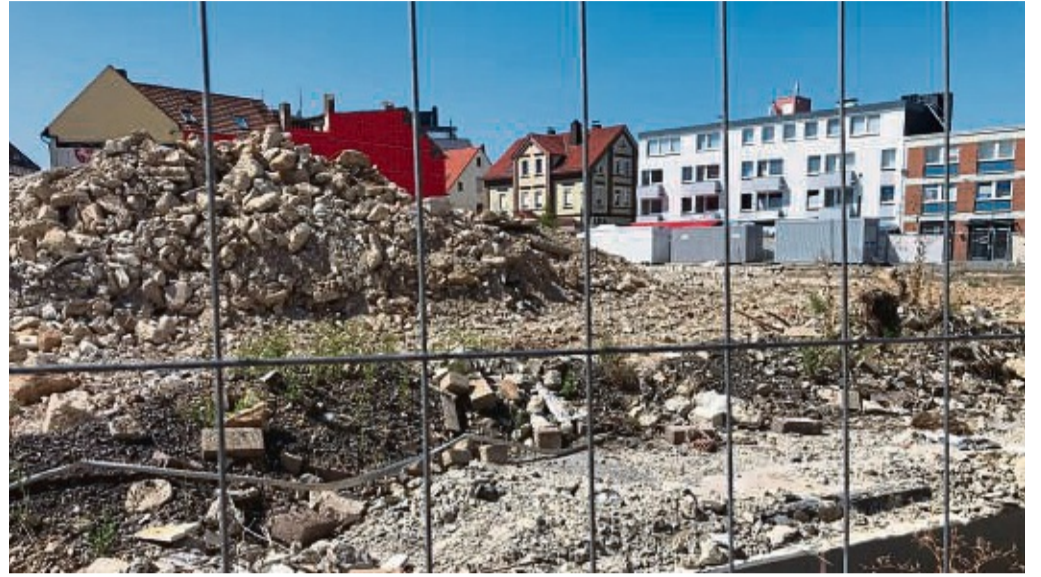
Ein Ende ist noch nicht in Sicht: Dafür sollen aber spätestens ab September die Tiefbauarbeiten auf der Großbaustelle in der Fußgängerzone beginnen. Auf dem Woolworth-Areal entsteht ein Wohn- und Geschäftshaus.

Ist alles erledigt, kommen die Stahlträger in die Baugrube, die somit den Beginn der darauffolgenden Hochbauarbeiten einläuten. dau