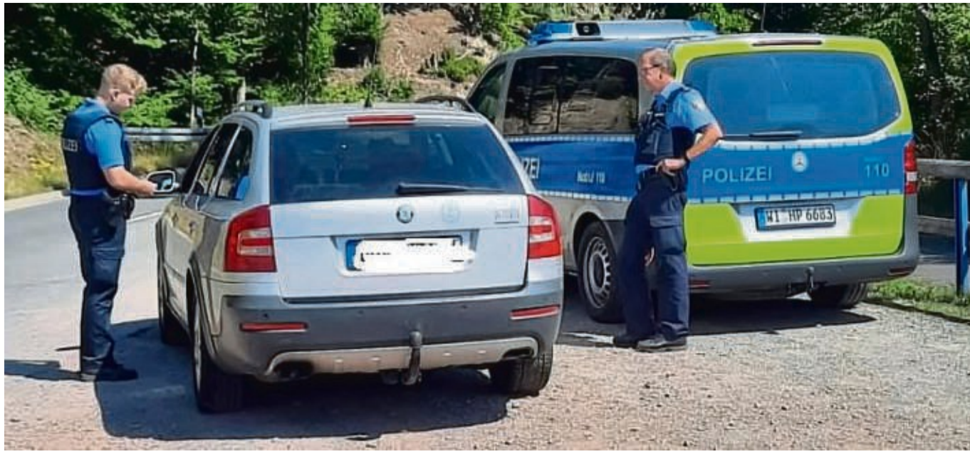
Kontrollergebnis am Edersee: Von 176 Verkehrsteilnehmern waren 18 zu schnell unterwegs.