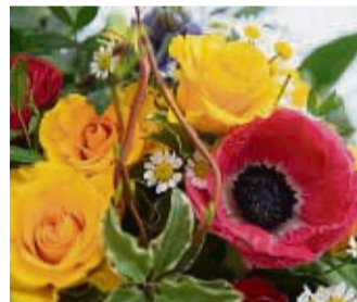
Herzlichen Glückwunsch!