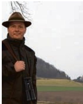
Einladung zum Sommerfest am 27.8.