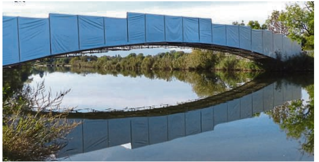
Platz 1: Unter dem Titel „Brücken bauen“ setzte Gerd Strauß die Leuchtbergbrücke über die Werra in Szene.