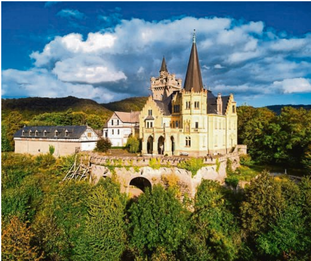
Platz 3 geht an Ralf Orth aus Hessisch Lichtenau mit „Schloss Rothestein im Herbst“.