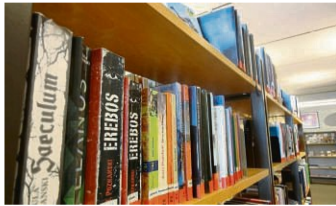
Einladung zum Stöbern: Die Stadtbibliothek Sontra bietet eine tolle Literaturlauswahl. SYMBOLBILD: BETTINA SANGERHAUSEN

phie des Yoga und wie Sie diese in Ihren Alltag integrieren können. Interessante Einblicke in die Philosophie des Yoga und wie Sie diese in Ihren Alltag integrieren können. Verschiedene Yoga-Arten, wirkungsvolle Atemtechniken und traditionelle Mudras im Überblick Cover aus Papier mit Leinenstruktur. Stadt und Schulbibliothek (im Gebäude der Adam-von-Trott-Schule, Jahnstraße 16-20), Telefon: 0 56 53/91 56 78 In den Schulferien nur Donnerstag von 16 bis 19 Uhr geöffnet.