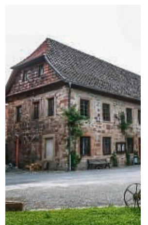
Einen Besuch wert: Das Museum im Alten Boyneburger Schloss.

Museum im Alten Boyneburger Schloss Bis 30. September jeden 1. und 3. Sonntag im Monat von 15 bis 17 Uhr geöffnet. Eintritt ist frei.