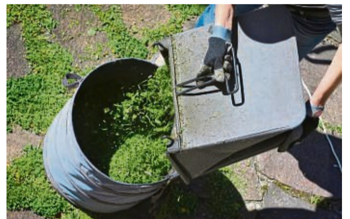
Frisch gemähtes Gras ist im Garten vielseitig einsetzbar - Rasenschnitt eignet sich zum Beispiel zum Mulchen.