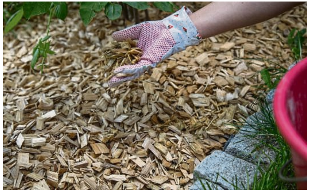
Mulch ist eigentlich nichts anders als Abfall - aber ein besonders nützlicher. Im Sommer etwa hält sich dank einer Mulchschicht die Feuchtigkeit besser im Boden.