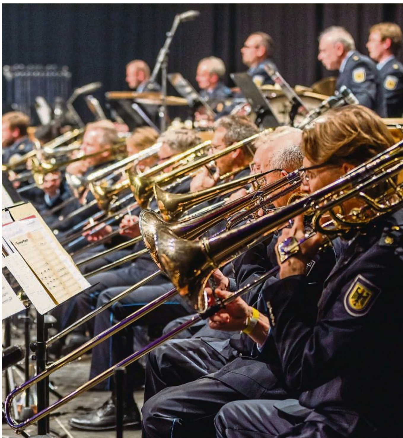
Das Bundespolizeiorchester spielt im kommenden Monat im Impfzentrum Calden.

Höfert und Landrat Siebert hoffen auf angenehme Temperaturen und einen regenfreien Nachmittag am 10. September. Da nur wenige