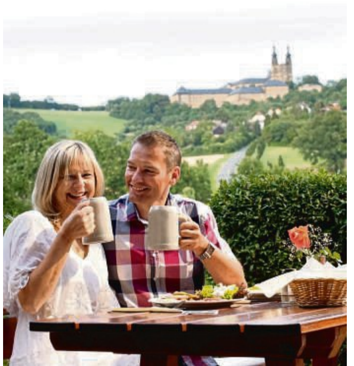
In Biergärten und uralten Gastwirtschaften genießen Gäste ihr Seidla zusammen mit fränkischen Gerichten und den typischen deftigen Brotzeiten.

Aktivsein und Kulinarik lassen sich im Herbst besonders genussvoll miteinander verbinden. Am Bodensee, wo im milden Klima rund jeder Dritte der deutschen Äpfel geerntet, sind in der Erntezeit sowohl die Obstplantagen als auch der regionale Veranstaltungskalender prall gefüllt. Während der Apfelwochen vom 17. September bis 9. Oktober 2022 laden Obstbauern zu Führungen und Hofläden zu Verkostungen ein. Zudem locken ausgewählte Restaurants und Gasthöfe mit Köstlichkeiten rund um den Apfel. Und auch Wanderer und Radfahrer kommen in der herbstlichen Natur voll auf ihre Kosten und können sich in den „Naschgärten“ oder Hofläden mit Äpfeln direkt vom Baum stärken. Unter apfelwochen-bodensee.de gibt es weitere Informationen zu allen Angeboten. (DJD-K).