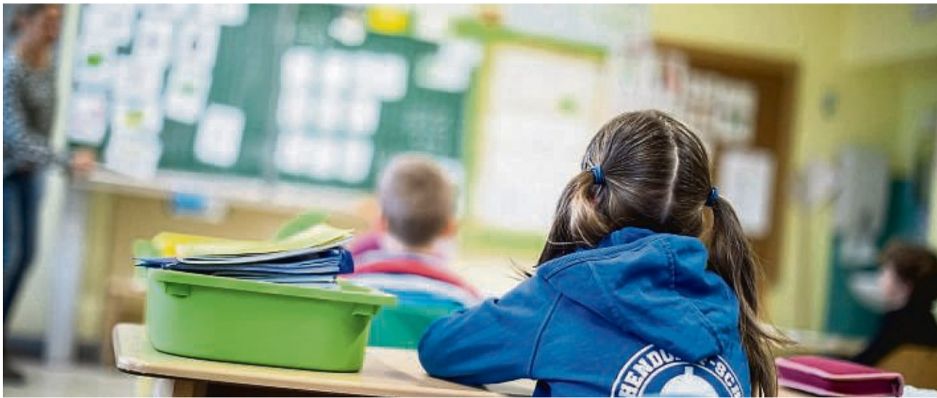
Mal fällt der Blick auf die Tafel, oft ins Schulbuch oder -heft: Auf Weitsicht sind die Augen in der Schule eher wenig eingestellt.