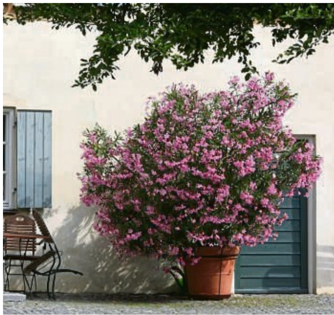
Eigentlich sollten Oleander mit prächtiger Blüte noch bis September auf dem Höhepunkt ihres Gartenjahres sein. Doch diverse Schädlinge können die Pflanze befallen.