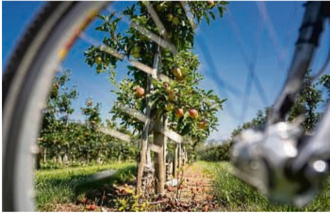
Am Bodensee lassen sich aktiver und kulinarischer Genuss ideal miteinander verbinden.