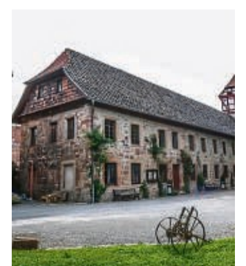
Einen Besuch wert: Das Museum im Alten Boyneburger Schloss.