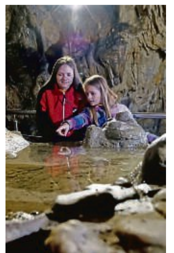
TEXT: DJD

Die Charlottenhöhle ist mit 532 Metern Führungsweg die längste Schauhöhle auf der Schwäbischen Alb.