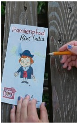
Erlebnis für Groß und Klein: Der Familienpfad Point India.

Begleitet vom kleinen Adam, dem Maskottchen des Weges, kann viel erkundet und ausprobiert werden. So gilt es spannende Rätsel zu lösen, für das es auf der Strecke hilfreiche Hinweise gibt. Der