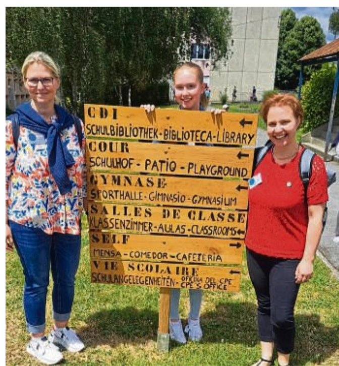
Schilder in den Sprachen der Schulpartnerschaften weisen der Schulgemeinde und Besuchern den Weg.