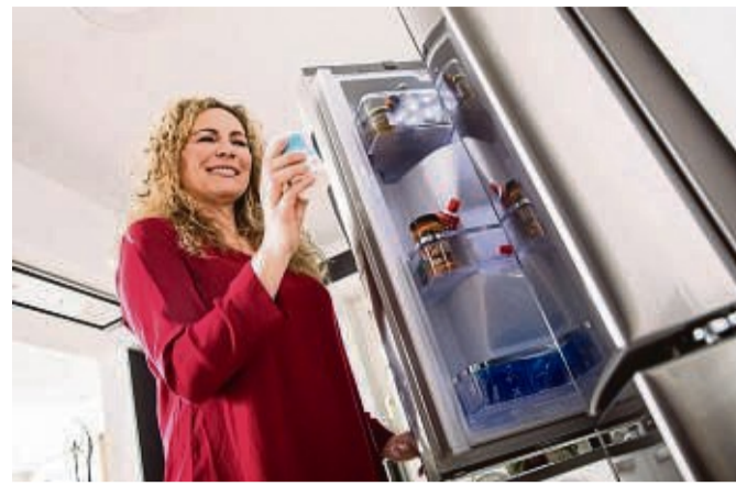
Wer eine stromsparende Kühl-Gefrierkombination sucht, sollte nicht nur auf die Energieeffizienzklasse achten.

Insgesamt 25 Einbaumodelle haben die Tester untersucht unter anderem auf Energieeffizienz, die erwartbaren Stromkosten und auf ihre Kühl- und Einfrierleistung. Die Anschaffungskosten variierten dabei zwischen