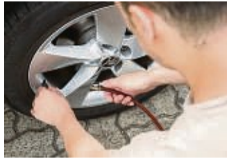
Wenn das Auto für die Reise voll gepackt ist, sollte der Reifendruck erhöht werden.

Vor der Urlaubsfahrt mit dem Auto lohnt ein Blick auf den Reifendruck. In der Regel empfehlen die Hersteller bei höherer Last einen etwas höheren Druck. Das stärkt die Stabilität und Tragfähigkeit der Reifen. Man muss aber nicht erst am Abreisetag mit vollgepacktem Auto das Druckluftgerät an der nächstgelegenen Tankstelle ansteuern. Nach Angaben des TÜV Süd kann der Luftdruck für einen höheren Beladungszustand ohne negative Folgen auch bei einem unbeladenen Fahrzeug eingestellt werden.