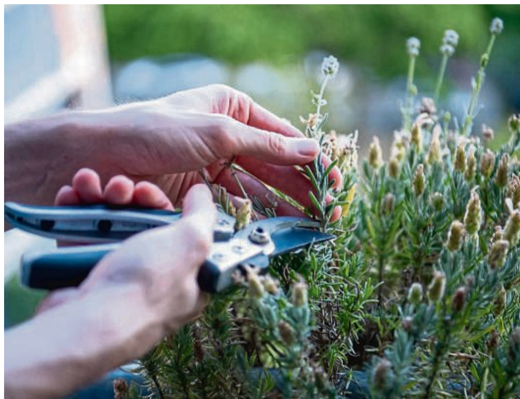
Vom Lavendel lässt sich im Sommer Nachwuchs ziehen.