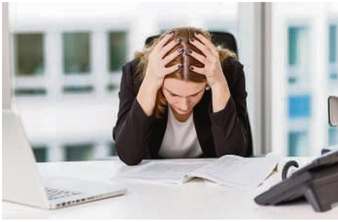
Wer im Job immer mit zu viel Ehrgeiz an Projekte geht, sollte erstmal in anderen Bereichen Gelassenheit üben.

Bei Kühl-Gefrierkombinationen auf Stromverbrauch achten