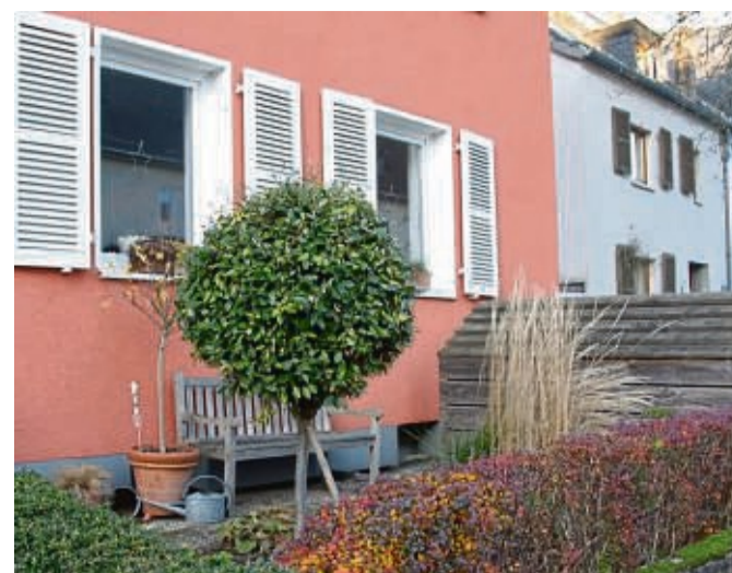
Klein, aber mein: Oft passt selbst in einen noch so kleinen Garten ein Baum.

Alternativ lassen sich viele Stecklinge in einem Wasserglas ziehen - dabei kann man gut die Wurzelbildung beobachten.