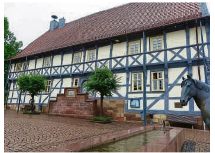
Wunderschönes Fachwerk: Das Rathaus in Zierenberg gilt als das älteste noch erhaltene gotische Rathaus von Hessen.

Und weiter berichtet er, dass das Rathaus im damaligen architektonischen Stil im Jahr 1864 verputzt wurde. „Von da an war das verputzte Rathaus nun kein Schmuckstück mehr“, wie Röhling ausführt. Erst in den Jahren 1925 bis 1928 wurde das Rathaus vom Putz befreit. Weitere Restaurierungen wurden an der Fassade des Hauses in den Jahren 1972 bis 1975 und 1982 bis 1985 vorgenommen.