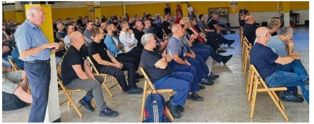
Hyco Pacoma aus Eschwege wurde verkauft an Legget & Platt aus den USA: Am Montag wurde die Belegschaft in der Kantine informiert.