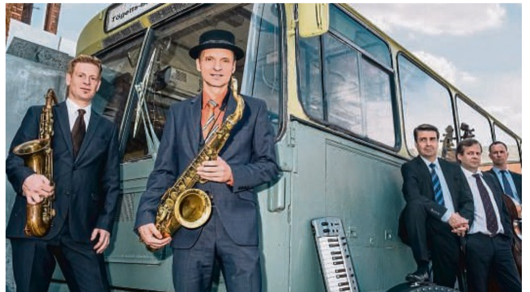
Läuten das neue Jazz-Jahr ein: Die Toughest Tenors treten am 24. September in Eschwege auf.

Jazzclub stellt neues Jahresprogramm vor