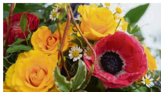
Allen Geburtstagskindern herzlichen Glückwunsch!

9. September 70 Jahre, Werner Kitzmann, Am Hollstein 10, Weißenborn 75 Jahre, Helga Ebel, Dorfstraße 3, Thurnhosbach