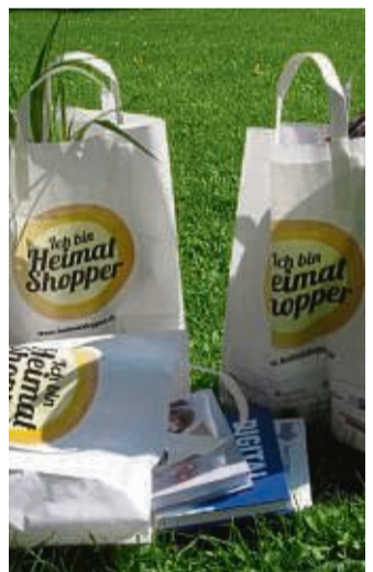
„Heimat shoppen“: Die Aktionstage starten wieder am 9. und 10. September.

Als Medienpartner unterstützen die HNA mit ihren Partnerzeitungen Hersfelder Zeitung, Werra Rundschau und Waldeckischer Landeszeitung sowie die Oberhessi-