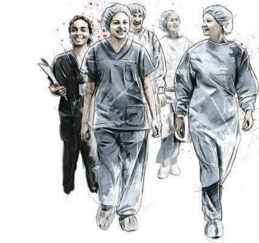
#YesWeCare: Auf dem ersten nordhessischen Fachpflege tag soll es darum gehen, die Zukunft der Pflege zu gestalten.

Unter dem Motto „#YesWeCare“ geht es vor allem darum, die Pflege mit starken Partnern vorzubringen. Die Veranstaltung bietet einen aktuellen Überblick über wichtige Themen im Bereich der Pflege, dazu sind spannende Fachvorträge geplant, die auch neue Perspektiven beleuchten, um künftig eine verstärkt personenzentrierte Pflege zum Wohle der Patient:innen zu realisieren. Ganz nebenbei ergibt sich die Möglichkeit, mit Kolleg:innen aus unterschiedlichen Bereichen oder Einrichtungen ins Gespräch zu kommen und durch andere Blickwinkel Erkenntnisse und Ideen für die eigene Arbeit zu gewinnen. Eingeladen sind Pflegekräfte aus Krankenhäusern, der stationären Altenpflege, der ambulanten Pflege sowie Leitungs- und Führungskräfte aus diesen Bereichen. Darüber hinaus sind auch Studierende und Auszubildende in den Fach-