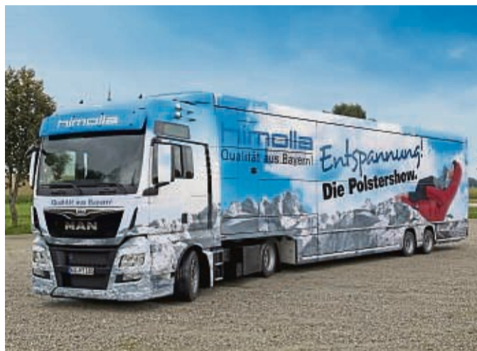
Mit seinem imposanten Showtruck präsentiert Himolla beim Werksverkauf im Möbelkreis Waldeck seine Sessel und Sofas.