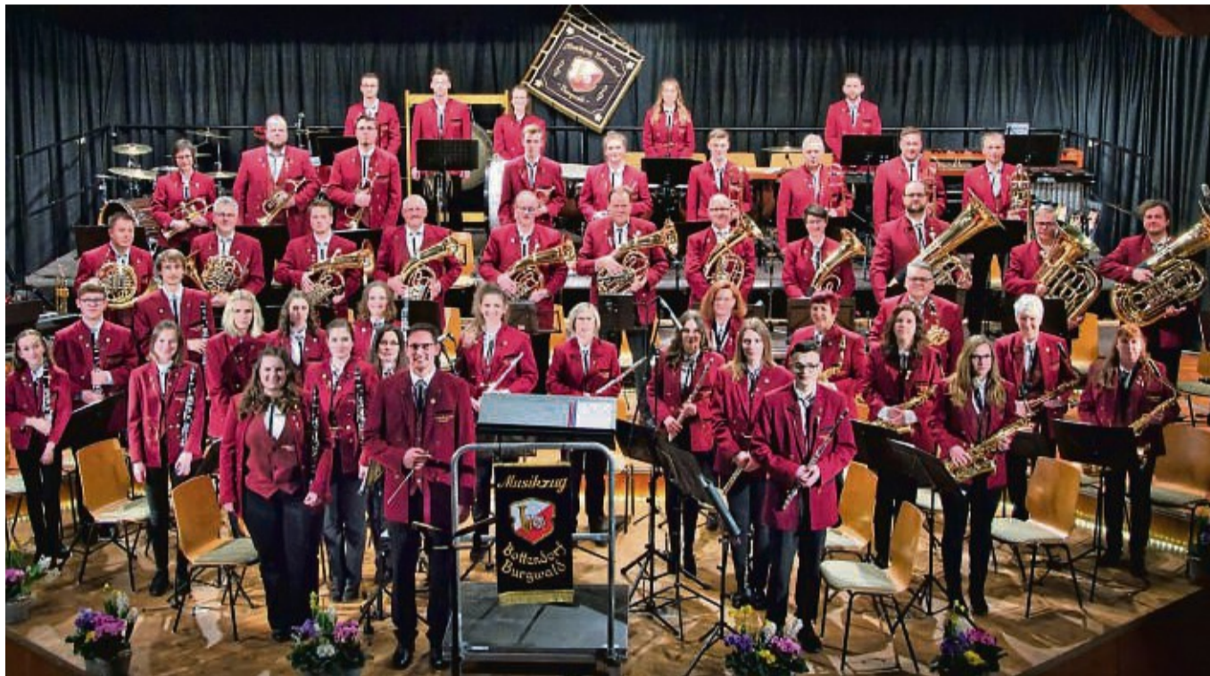
70 Jahre Musikzug Burgwald/Bottendorf: In großer Besetzung wird das Ensemble, das über ein reiches Repertoire zwischen traditioneller und sinfonischer Blasmusik verfügt, bei seinem Fest auftreten.

Unter den kulinarischen Besonderheiten des Hessens wird auch das hessische Nationalgetränk, der Apfelwein, nicht fehlen. Ferner werden regionale Weine und