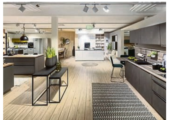
44 Musterküchen zeigen die aktuellsten Technik- und Designtrends in der größten Küchenausstellung der Region.