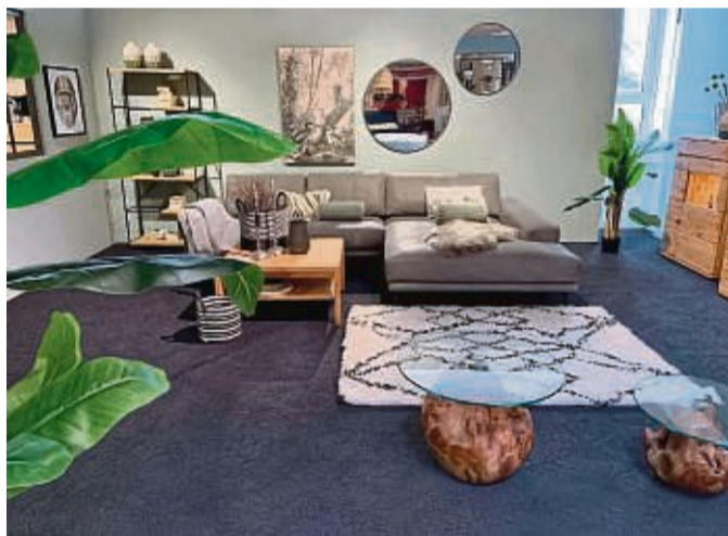
Die Möbel- und Küchenausstellung am Standort Korbach-Meininghausen wurde komplett neugestaltet.