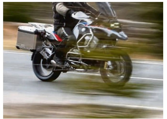
Wer mit größerem Gepäck auf Motorrad-Tour gehen will, sollte vorab ein paar Dinge beachten.