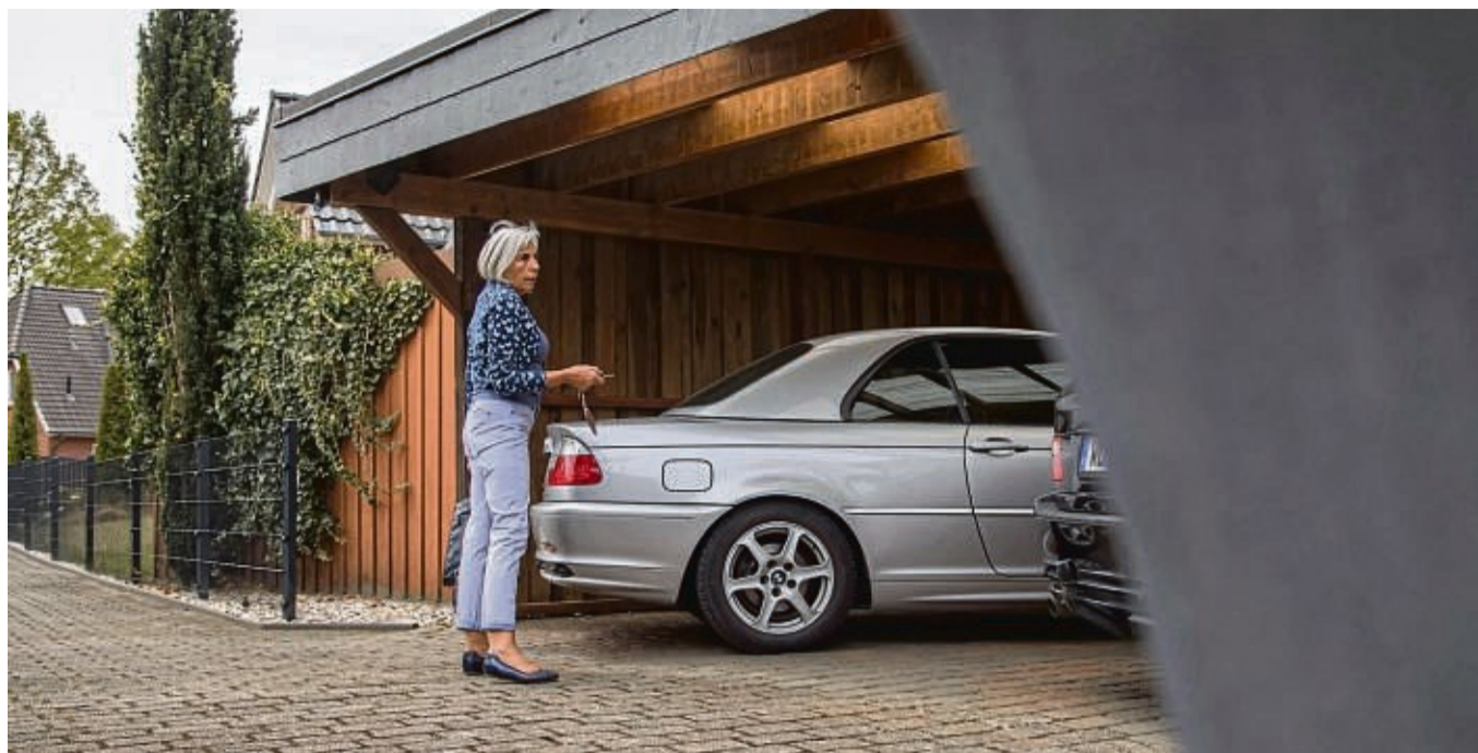
Mehrere Leuchten von oben sorgen für gutes Licht im Carport - ob mit oder ohne geparktes Auto.

Kein Schatten mit gut platzierten Leuchten