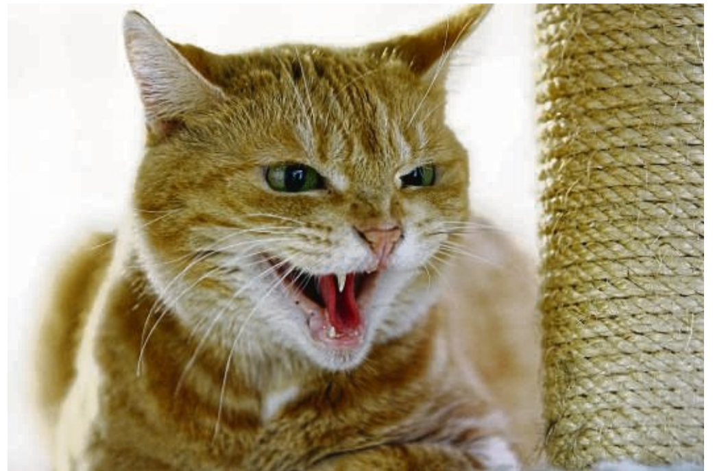
Wenn die Katze zur Kratzbürste wird, sollte sie der neue Partner nicht bedrängen, sondern ignorieren. Das vermittelt ihr, dass man sie nicht als Gefahr wahrnimmt.