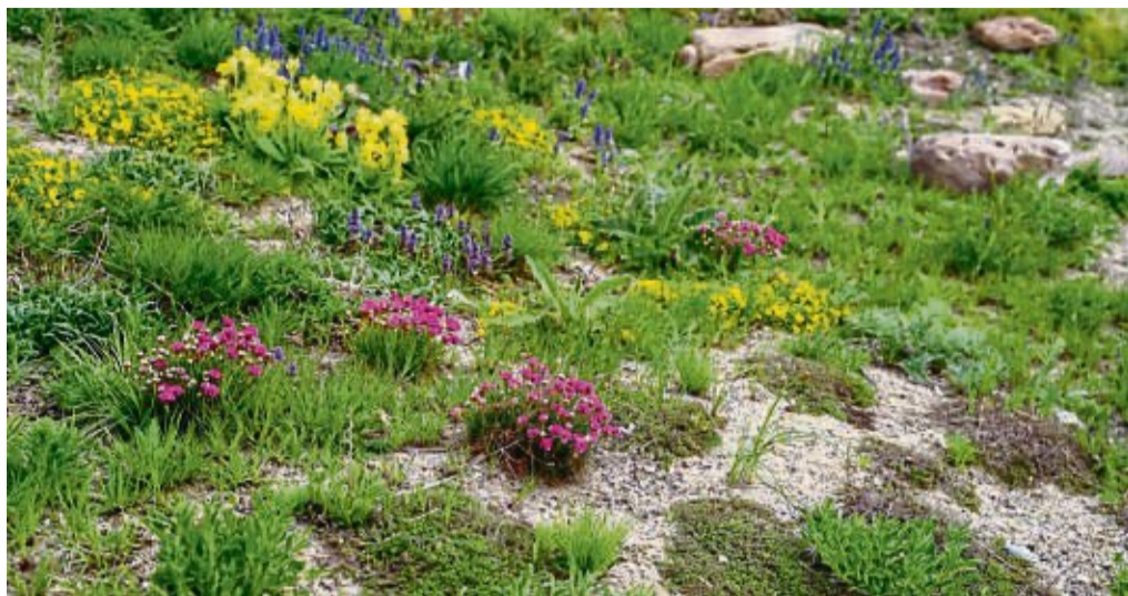
Blühendes im Frühjahr: Dieses Sandbeet besteht aus Nelken, Schlüsselblumen, Günsel und Fingerkraut zwischen Stauden wie Königskerzen, Edel-Disteln und Thymian.

Ein Sandbeet trainiert die Pflanzen, besser mit einem Feuchtigkeitsmangel klar zu kommen. Der Grund: Sand ist arm an Nährstoffen und kann nur wenig bis kaum Wasser speichern. Die Pflan-