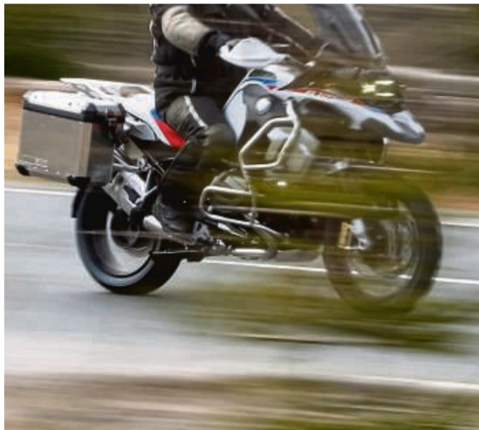
Wer mit größerem Gepäck auf Motorrad-Tour gehen will, sollte vorab ein paar Dinge beachten.