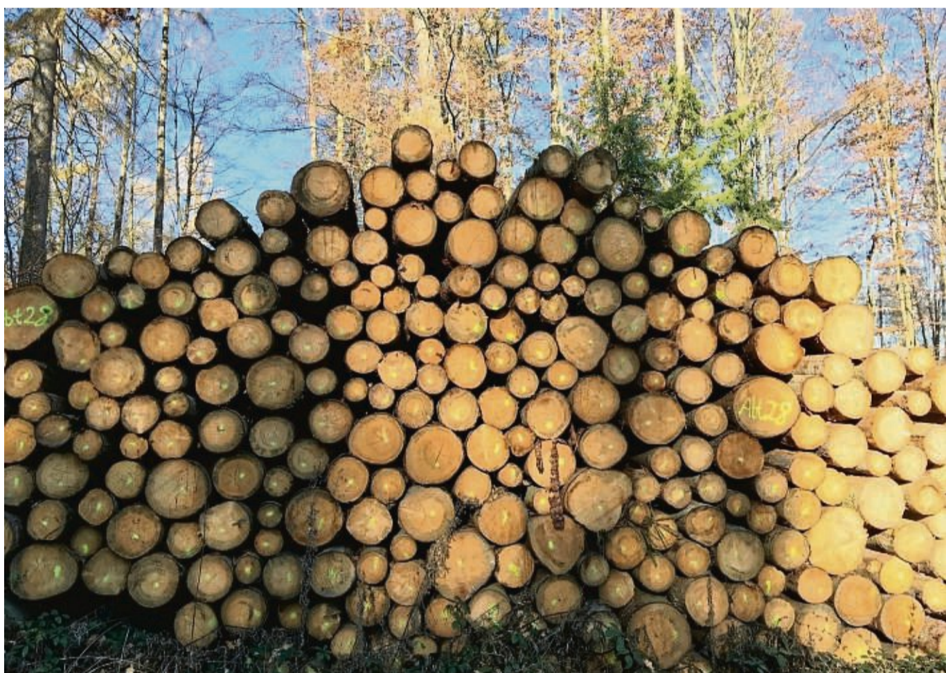
Brennholz im Wald zwischengelagert: Bei explodierenden Gaspreisen und Angst davor, im Winter frieren zu müssen, ist Brennholz als Alternative sehr begehrt.

nördlichen Reinhardswald ist an einigen Stellen Holz verschwunden. „Wir vermuten, dass es gestohlen wurde“, so ein Sprecher des Forstamtes Reinhardshagen. Das Holz war bereits verkauft und am Waldweg gelagert. Das Forstamt hat jetzt sogenannte GPS-Tracker beschafft, mit denen der möglicherweise illegale Weg des Holzes verfolgt werden kann. „Damit hoffen wir den Diebstahl eindämmen zu können“, so der Sprecher aus dem Reinhardswald.