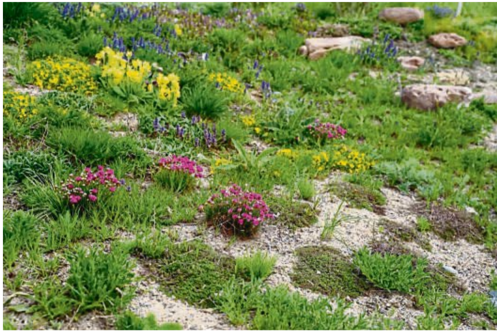
Blühendes im Frühjahr: Dieses Sandbeet besteht aus Nelken, Schlüsselblumen, Günsel und Fingerkraut zwischen Stauden wie Königskerzen, Edel-Disteln und Thymian.

Ein Sandbeet trainiert die Pflanzen, besser mit einem Feuchtigkeitsmangel klar zu kommen. Der Grund: Sand ist arm an Nährstoffen und kann nur wenig bis kaum Wasser speichern. Die Pflanzen müssen also längere Wurzeln bilden, um damit an tiefere, fruchtbarere Erd-