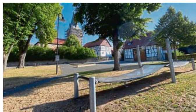
Auf der Tränke: Hier im Mittelpunkt des Ortes Breuna sollen alle gemeinsam ein schönes Fest feiern. Lost geht es am 17. September.