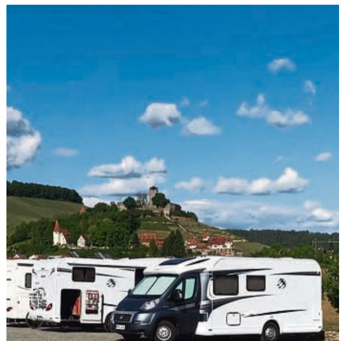
In allen acht Mitgliedsorten der Ferienregion Marbach-Bottwartal finden Urlauber vielfältige Möglichkeiten, ihr Wohnmobil zu parken - zum Beispiel beim Weingut Krohmer in Beilstein.

Informationen zur Viehscheid sind unter www.nesselwang.de zu finden, wo auch ein interaktiver Tourenplaner zu den Wander- und Radwegen bereitsteht.