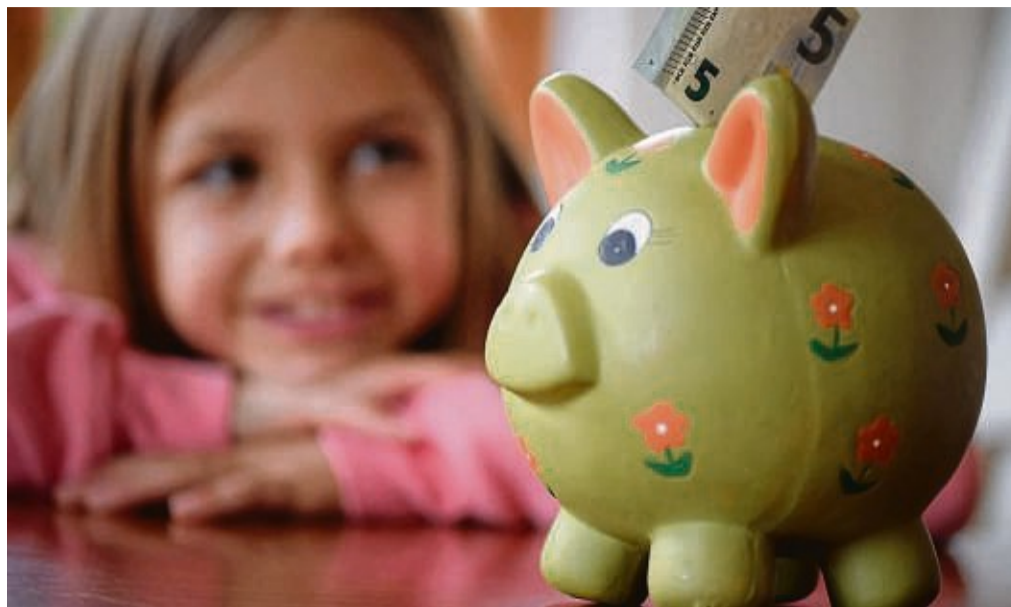
Gibt es nur bei guten Noten und gutem Benehmen: Experten sind sich uneinig, ob die Auszahlung des Taschengelds an Bedingungen geknüpft sein sollte.

Warum Taschengeld wichtig für Kinder ist