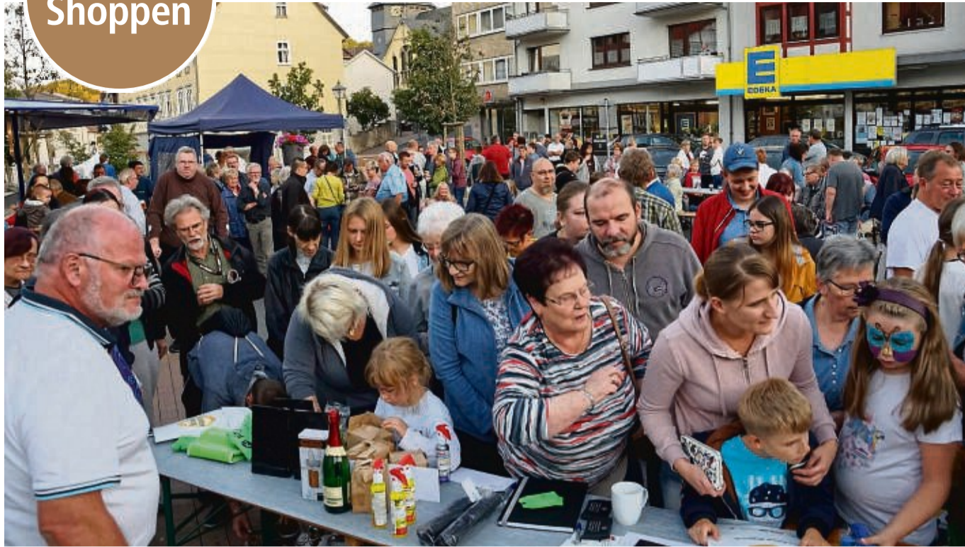
Das Heimat Shoppen und die damit verbundenen Aktionen sollen erneut viele Besucher in die Stadt locken.