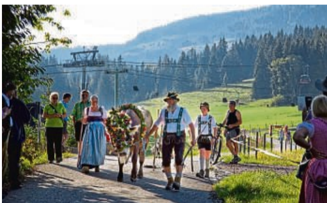
Beim Vihscheid führen die Hirten mit dem geschmückten Kranzrind den Almbtrieb an.

Im Herbst liegt das Tal morgens noch im Schatten, doch auf den Allgäuer Gipfeln genießen die Wanderer den ganzen Tag das goldene Licht der tiefer stehenden Sonne.