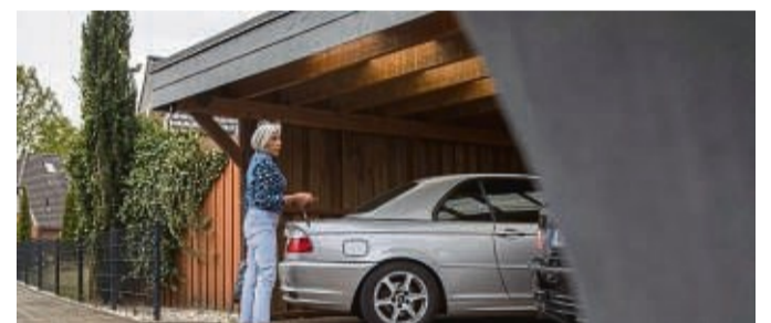
Mehrere Leuchten von oben sorgen für gutes Licht im Carport.