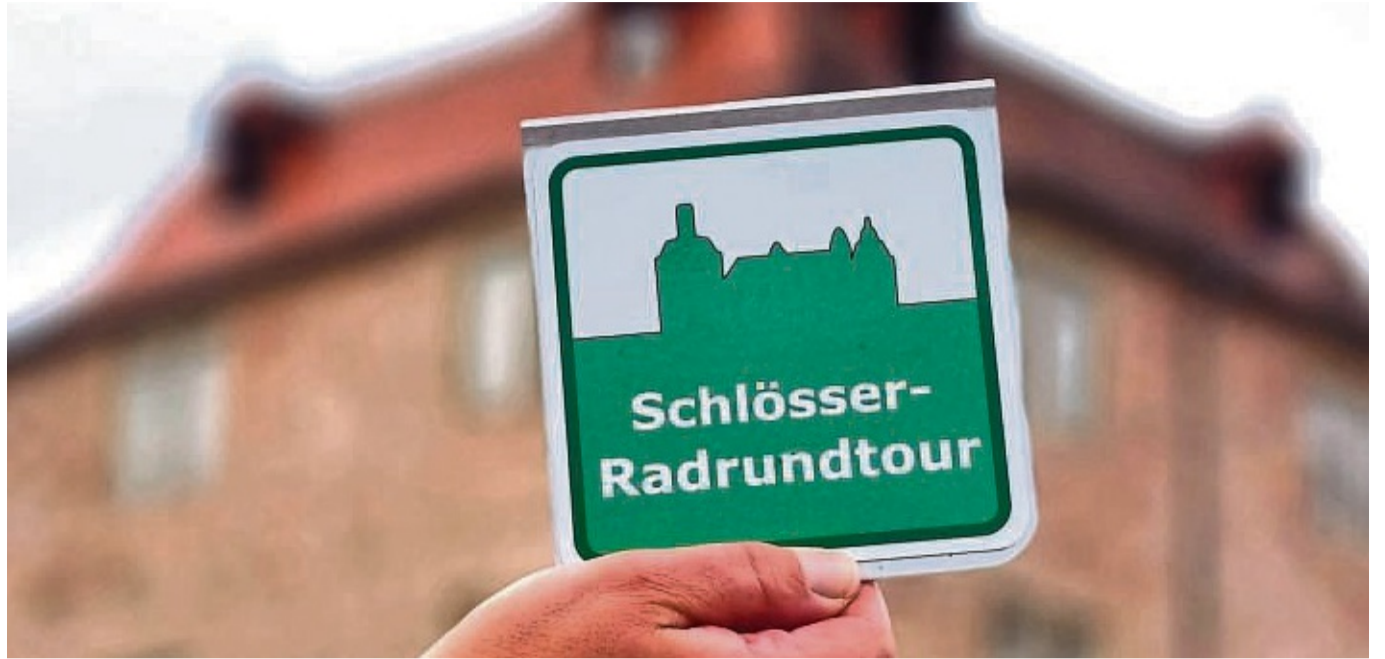
Schlösser-Radtour: Das neue Logo führt Radfahrer an den schönsten Schlössern des Kreises entlang.

Route zwischen Jestädt und Wanfried neu beschildert – Weitere Strecken folgen