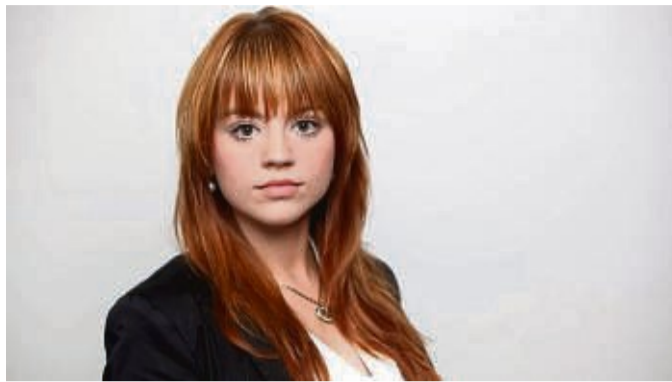
Passen gut zu dreieckigen Gesichtsförmigkeiten: Fülligere Pony-Frisuren, die über die gesamte Stirn reichen.