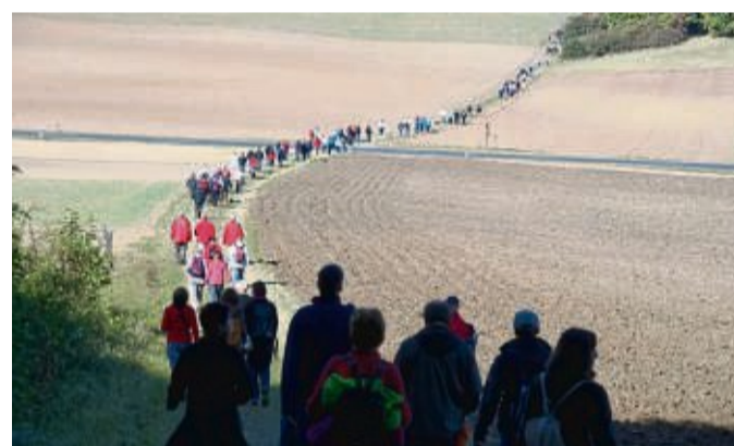
Gut besucht: Die Wanderungen des Wandervereins P13 Boyneburg Ringgau.

Auch der schönste Sommer ist einmal vorbei und somit rückt auch das Ende der Badesaison 2022 im Freizeit- und Erlebnisbad Sontra in greifbare Nähe. Wir möchten Sie liebe Besucherinnen und Besucher daher schon heute darauf aufmerksam machen, dass ab dem 10. September das Freizeit- und Erlebnisbad Sontra geschlossen wird. Schon heute dürfen wir mit großer Freude verkünden, dass wir einen tollen Sommer mit vielen Sonnenstunden und zahlreichen Besucherinnen und Besuchern aus Nah und Fern hatten. Aus diesem Grund sagen wir allen Badegästen für Ihren Besuch „DANK“ sowie all denjenigen, die mit Ihrer Werbung wieder unser Freizeit- und Erlebnisbad unterstützt haben. Als schönen Abschluss werden wir, nachdem das Hundeschwimmen im letzten Jahr so gut angenommen wurde, auch in 2022 zusammen mit der Fa. Bädercoach wieder ein Hundeschwimmen am 11. September für alle Vierbeiner veranstalten. Von 10 bis 14 Uhr können alle Hunde mit einem gültigen Hunde-Impfpassweis das Freizeit- und Erlebnisbad nutzen. Die Kosten am Eingang betragen für das Hundeschwimmen pro Fuß und Pfote 1 Euro. Der Erlös kommt der DLRG Ortsgruppe Sontra zugute! gez. Thomas Eckhardt, Bürgermeister