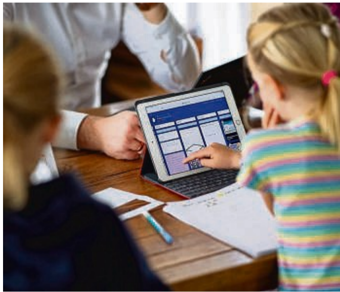
Nicht nur für Schule und Hausaufgaben: Tablets werden gerne von der ganzen Familie genutzt.

Überhaupt sind die Einsatzmöglichkeiten für Tablets vielseitig: Filmeschauen, Internetsurfen, Spiele, Lern-Apps für Kinder. Ältere Menschen profitieren, weil die