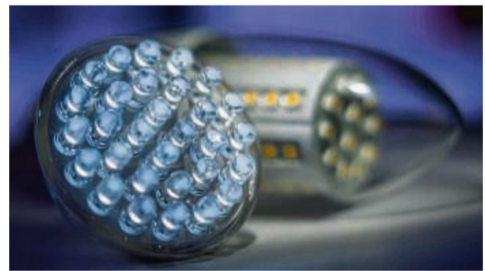
LEDs verbrauchen viel weniger Energie als die alten Glühlampen.