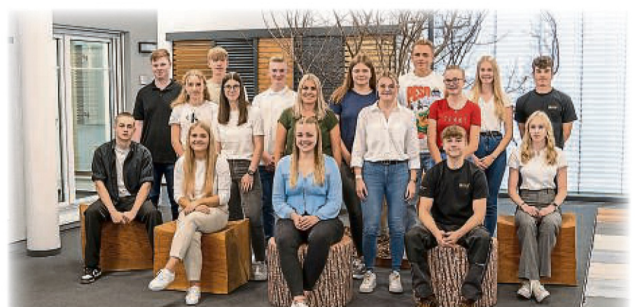
Auszubildende im technischen/kaufmännischen Bereich sowie Jahresspraktikanten