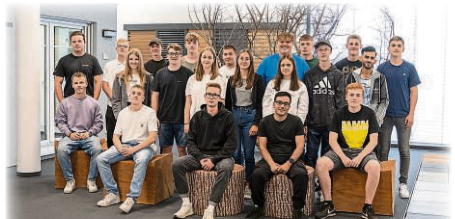
Auszubildende im handwerklichen Bereich

FingerHaus mit den Schwesterunternehmen gehört mit insgesamt mehr als 90 Auszubildenden, 6 Fachoberschulpraktikanten und 13 Dualen Studenten im Jahr 2022 zu den größten Ausbildungsbetrieben in der Region. Allein im handwerklichen Bereich starten 22 Auszubildende. Mit zwölf Ausbildungsberufen und der Ausbildungswelt, die eine wichtige Einrichtung für die handwerklichen Berufe ist und Platz bietet für innerbetrieblichen praktischen und theoretischen Unterricht. Hier erhalten die Berufsstarter eine intensive Betreuung.