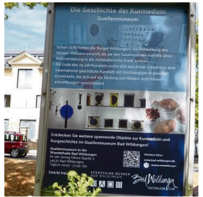
Wildunger Museenkunde an der Flaniermeile: Die fünfte Ausstellung auf Stelen wurde eröffnet.