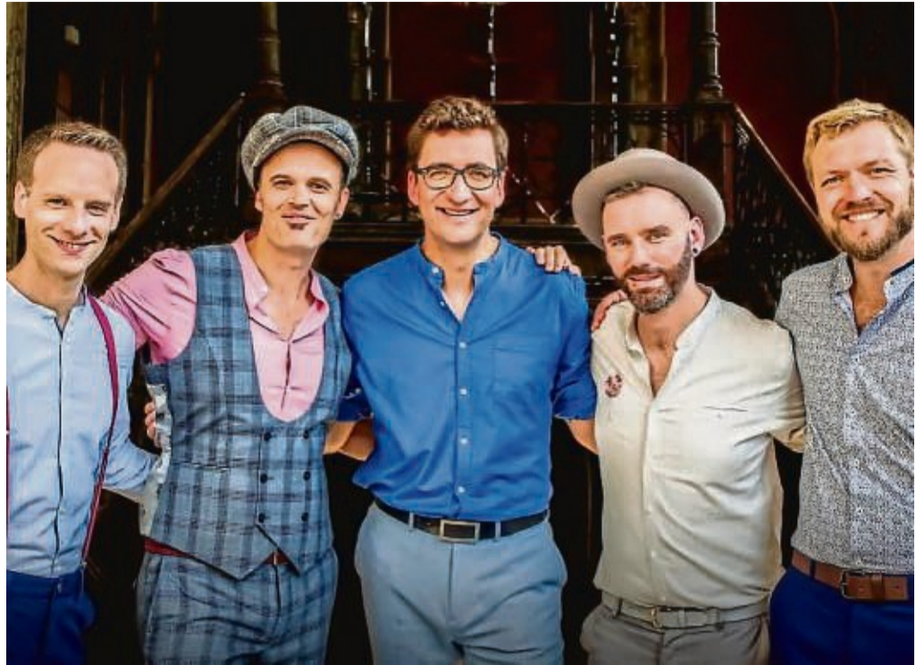
Gesang liegt in der Luft: Bei seiner Deutschlandtournee „In The Air“ gastiert das A-Cappella-Ensemble „vocaldente“ aus Hannover am kommenden Sonntag beim Denkmalkonzert in der Frankenberger Liebfrauenkirche.

Frankenberg – „vocaldente ist zurück mit frischem Wind“, melden sich die fünf Sänger des preisgekrönten A-Cappella-Ensembles „vocaldente“ aus Hannover. Der Frankenberger Kulturring hat sie verpflichtet für das von der Sparkasse Hessen-Thüringen unterstützte Konzert „Hör mal im Denkmal“, das traditionell am zweiten Sonntag im September in der Liebfrauenkirche stattfindet. Für diese Veranstaltung am Sonntag, 11. September, ab 18 Uhr gibt es noch Karten, wie der Kulturring mitteilt.