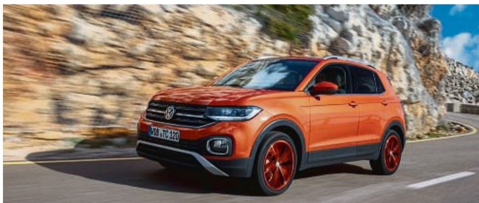
Sicher auf der Straße, viel Stauffläche und sogar große Menschen haben auf der Rückbank genügend Platz, ohne sich eingeeengt zu fühlen: Der VW T-Cross.

Von Kleinwagen jedoch ist hier nichts zu sehen noch zu spüren. Mit 4,11 Metern ist der SUVling zwar kaum fünf Zentimeter länger als der Polo, baut dafür aber 11 Zentimeter höher. Und die Front mit bulligem Grill und Stoßfänger, die stämmige Statur sowie das kantige