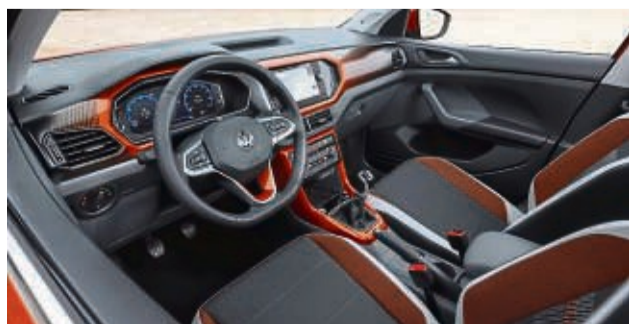
Die Innenausstattung lässt sich sehen. So macht jede Fahrt gleich viel mehr Spaß.

Doch vielleicht ist das auch nur Beckmesserei, macht der kleine SUV doch ansonsten seine Sache ausgezeichnet. Nach knapp zehn Sekunden sind Tempo 100 erreicht, maximal wären 193 km/h drin, leer knackt er aber auch die 200 spielend. Apropos, lässt man es etwas moderater angehen, sind sogar die versprochenen 5,0 Liter nach Norm locker zu erreichen. Umgekehrt lässt es sich mit den kompakten Abmessungen und der guten Übersicht auch im dicksten Gewusel locker rangieren und in so gut wie jede Parklücke zirkeln.