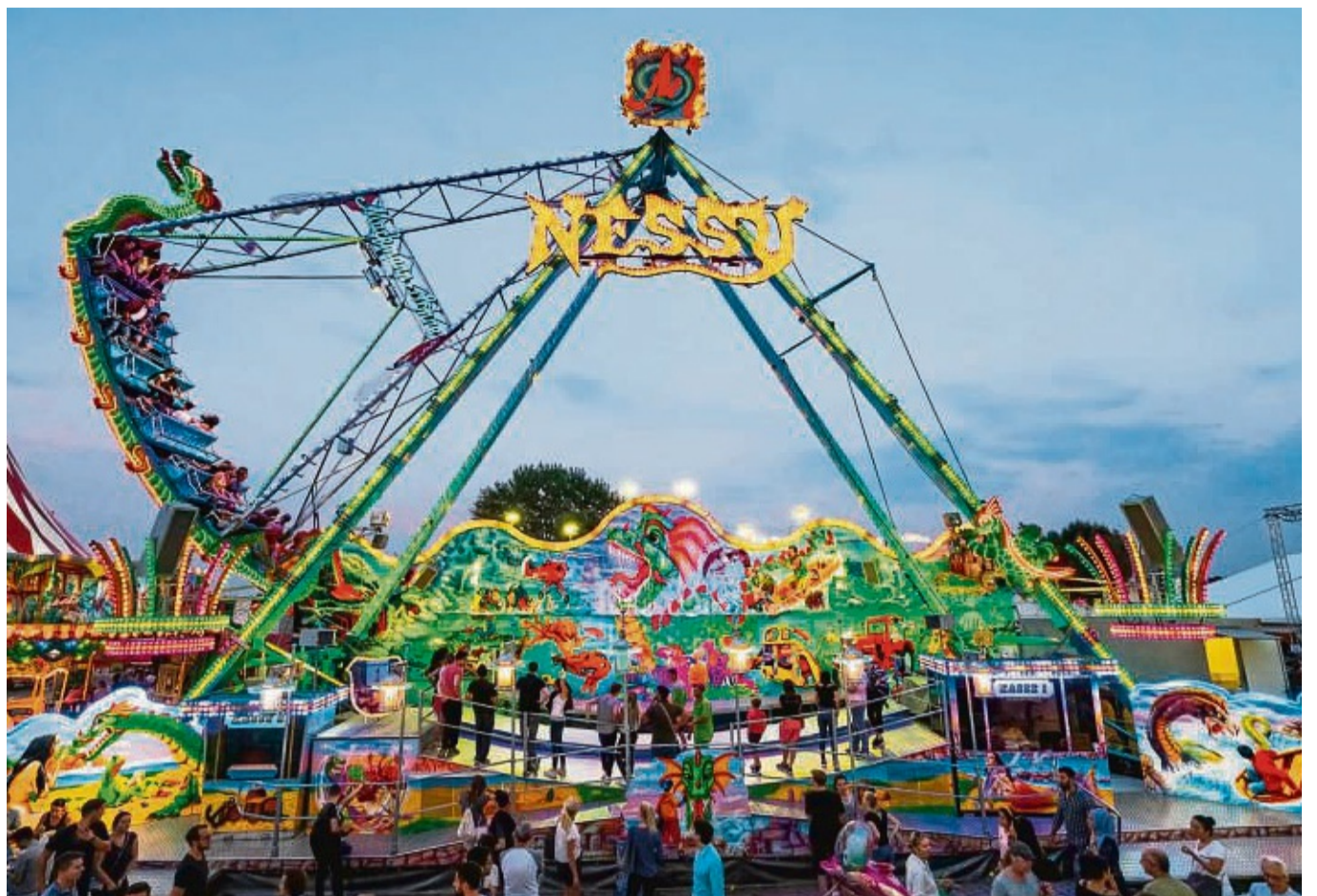
Die Nessy kommt wieder: Das Lollsfest 2022 soll erneut ganz das Alte sein. Mit Dosenwerfen, Entenangeln und Fädenziehen wartet das Fest der tausend Lichter in diesem Jahr auf.