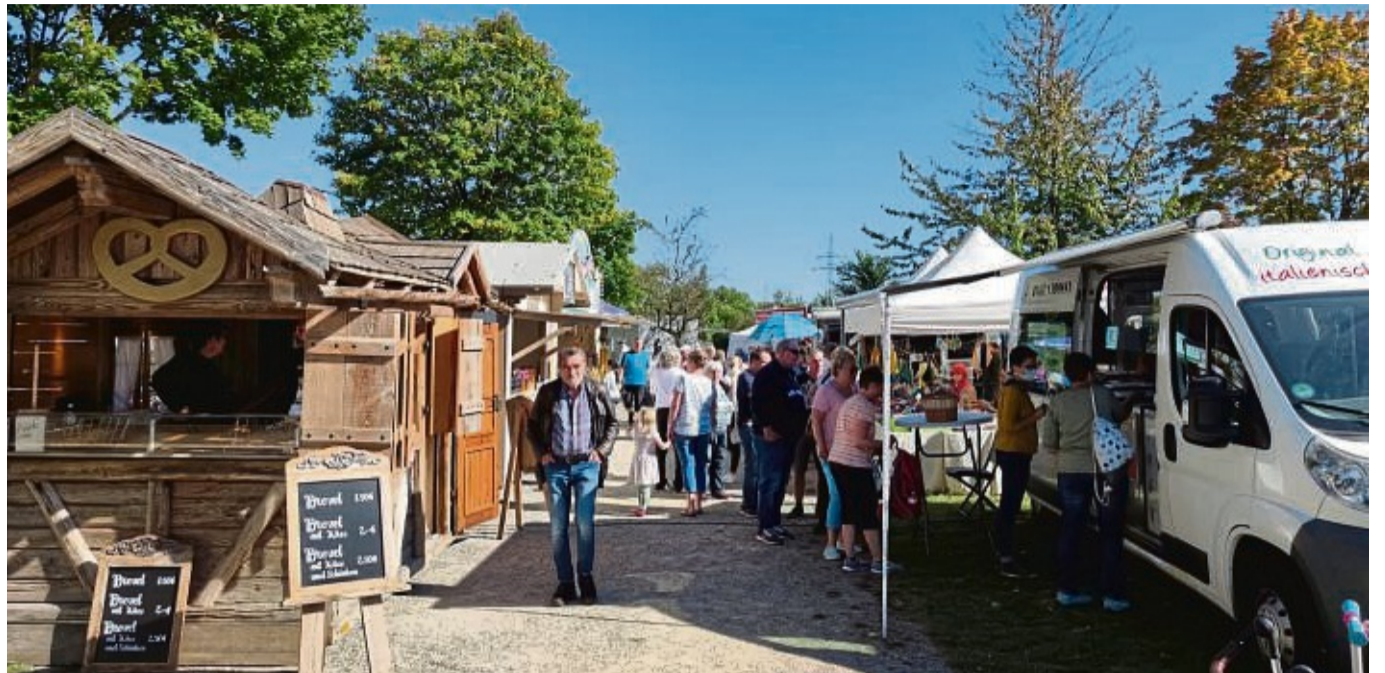
Lädt zum Bummeln ein: Der Kuckucksmarkt Braach.

Kuckucksmarkt in Braach mit buntgemischten Angeboten