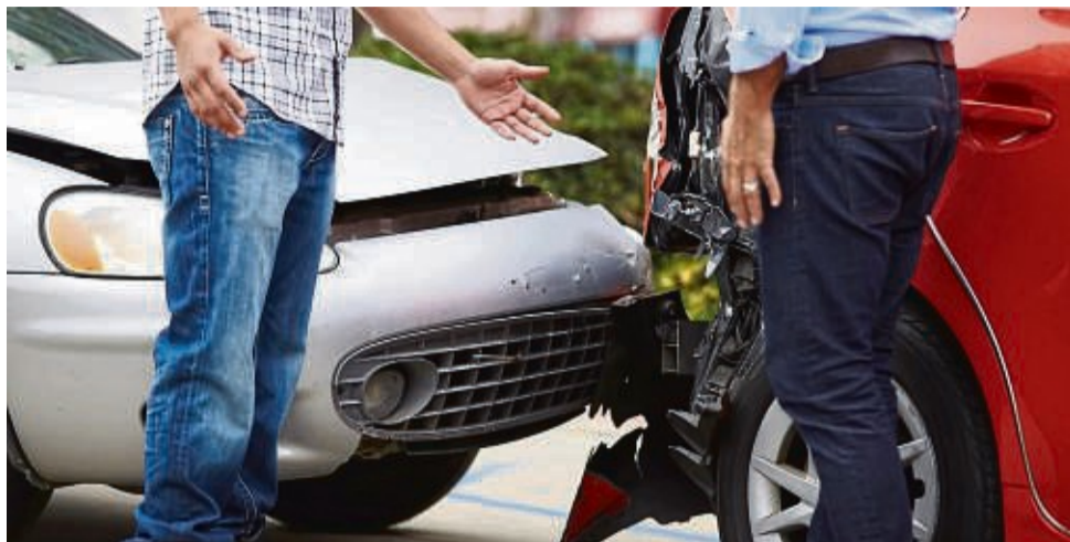
Schwerere Autos beschützen ihre Insassen zwar sehr, stellen aber auch eine Gefahr für Menschen in leichteren Fahrzeugen dar.

Mit diesem Problem beschäftigte sich auch der erste Crashtest, bei dem simuliert wurde, wie ein Fahrer vermeintlich nur kurz auf das Pedal seines E-Autos drückte und durch die starke Beschleunigung die Kontrolle über das Fahrzeug verlor. Er fuhr mit überhöhter Geschwindigkeit auf ei-