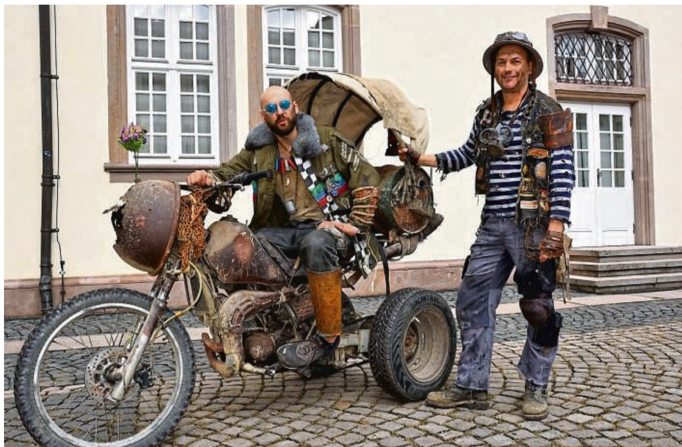
Endzeitstimmung in Rotenburg: Das nach eigenen Angaben „größte Fantasy-Festival Deutschlands“ lockt an diesem Wochenende wieder allerhand schaurig-schräge Gestalten in den Schlosspark.