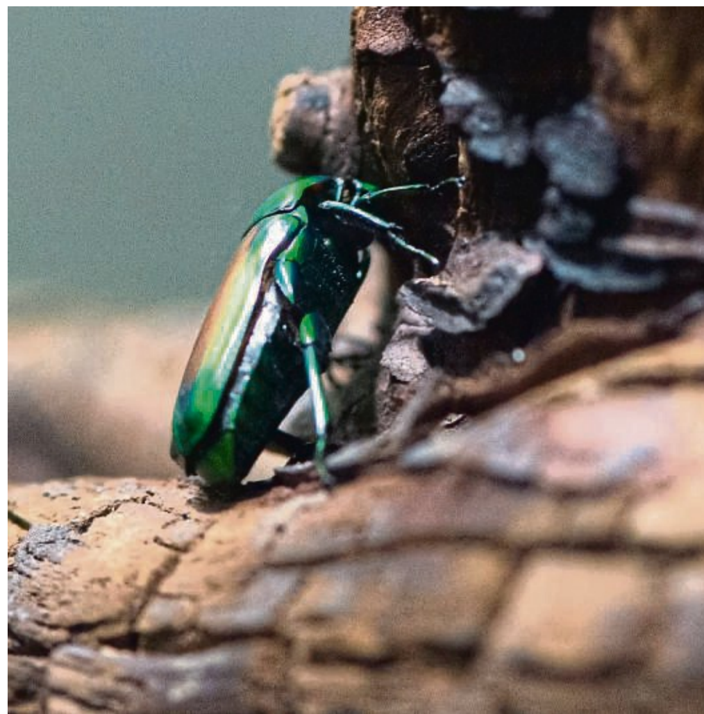
Der Rosenkäfer ist ein Bewohner der Komposthaufen im Garten.

Ein Stapel Holz: Totes Holz, etwa Reste von dem Gehölzschnitt oder dem Fällen eines