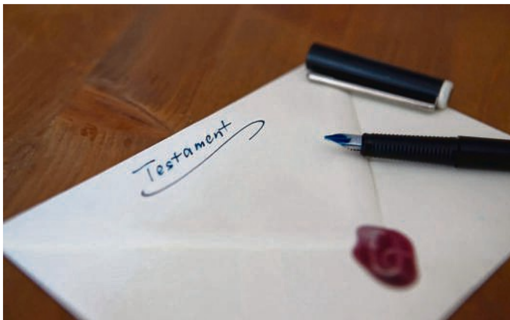
Wenn Eltern nicht im Interesse ihres Kindes handeln, kann ihnen für die Erteilung des Erbscheins das Sorgerecht entzogen werden.

Im konkreten Fall hat eine Frau ihre Tochter als Haupterin eingesetzt. Ihre Enkelkinder - eine davon minderjährig - sollten je nach Wert des hinterlassenen Gesamtvermögens Wertpapiere im Wert von 200 000 Euro und gegebenenfalls weitere 75