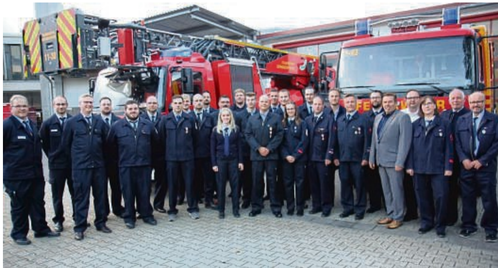
Geehrte, Beförderte und Offizielle der Spangenberg-Feuerwehren bei der Jahreshauptversammlung.

Die Zahl der Aktiven in den Einsatzabteilungen ist mit