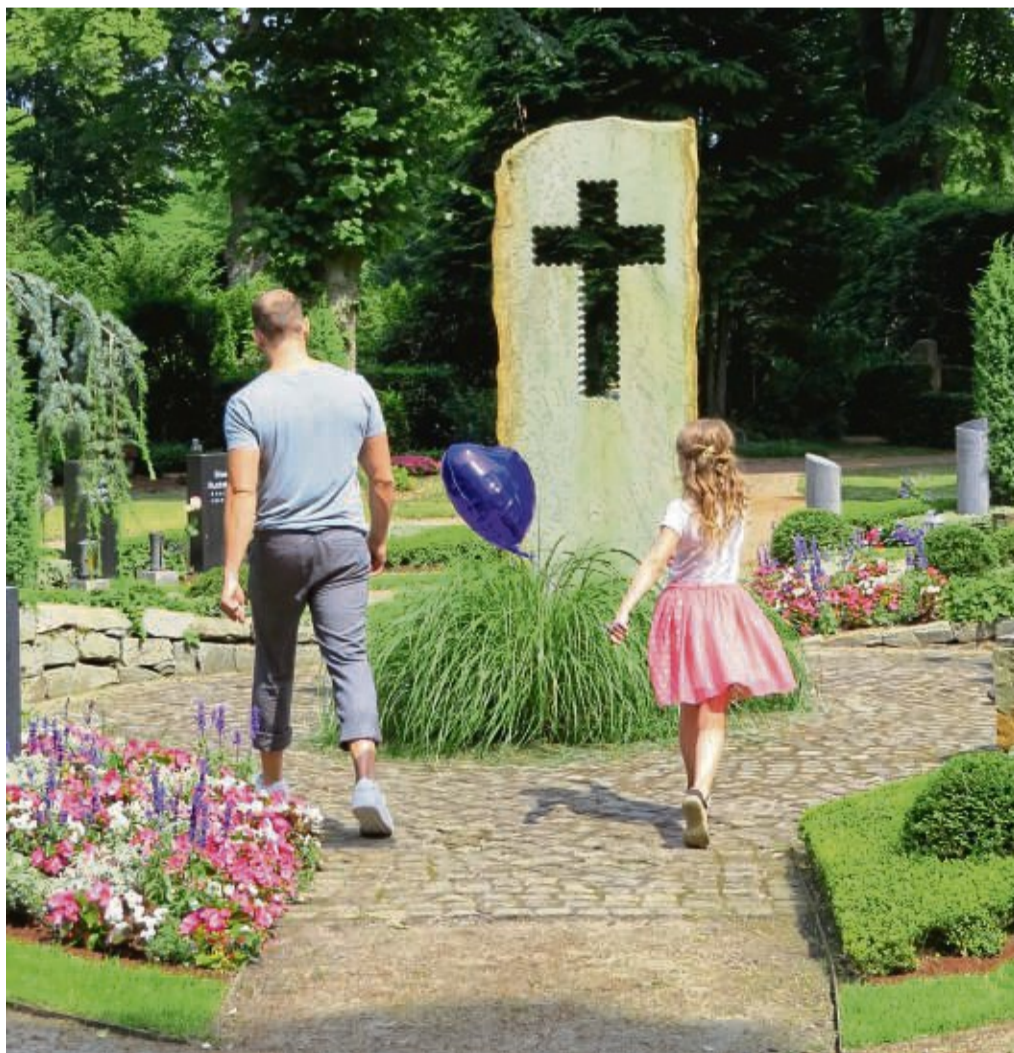
Ein ganz besonderer Ort: Der Friedhof bietet nicht nur Raum zum Trauern, sondern auch die Möglichkeit, Hoffnung zu schöpfen und neuen Mut zu gewinnen.

Zahlreiche Städte und Gemeinden beteiligen sich Jahr für Jahr am dritten Septemberwochenende am „Tag des Friedhofs“. Zahlreiche Aktionen zeigen die Geschichte und Tradition einer gewachsenen Friedhofskultur vor Ort auf und bieten die Gele-