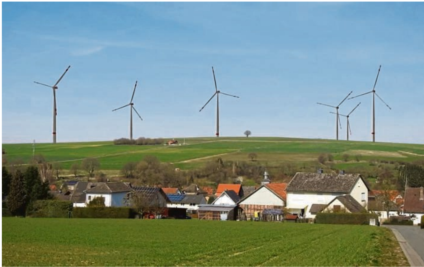
So soll sich der Windpark der UKA Meißen in die Landschaft rund um die Friedenseiche (Bildmitte) einfügen. Die Fotosimulation stammt aus den Antragsunterlagen.

Bürgerinitiative Pro Friedenseiche kritisiert Infopolitik