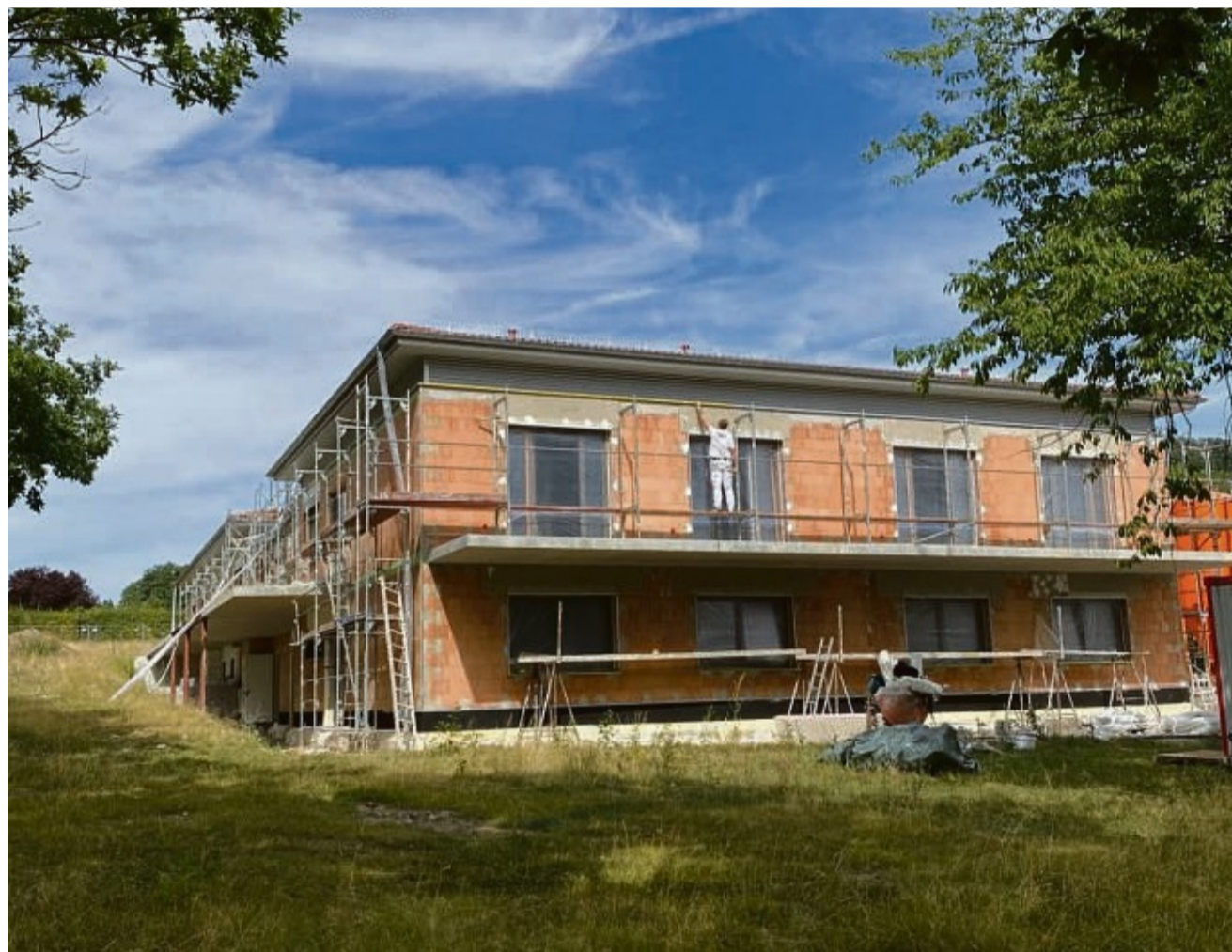
Genau 1 Jahr nach dem ersten Spatenstich steht die Eröffnung des Hospiz Schauenburg nun fest. Im Januar 2023 öffnet das Hospiz des Internationalen Bildungs- und Sozialwerks die Türen für bis zu 8 Gäste, die an einer unheilbaren Krankheit leiden.

Das Hospiz in Schauenburg-Hoof öffnet im Januar 2023