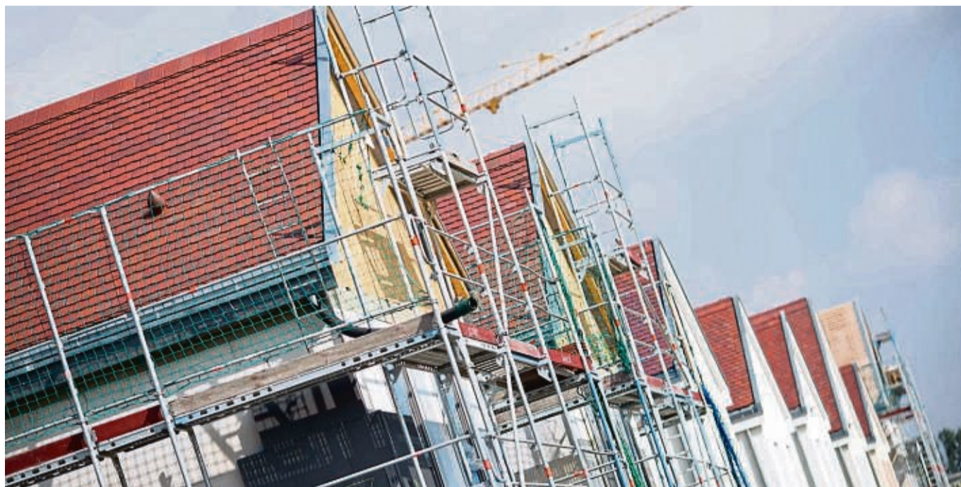
Ob Immobilienbau, -kauf oder Modernisierung: Ein Bausparvertrag kann sich für verschiedene Vorhaben lohnen.

Eine pauschale Empfehlung gibt es nicht, da niemand weiß, wie sich die Zinsen in der Zukunft entwickeln. Ein Annuitätendarlehen punktet laut Stecher im Vergleich zu einem Bausparvertrag oftmals mit niedrigeren Gesamtkosten. „Bei größeren Summen ist ein Annuitätendarlehen mit langer Zinsbindung mindestens eine gute Option.“ tmn