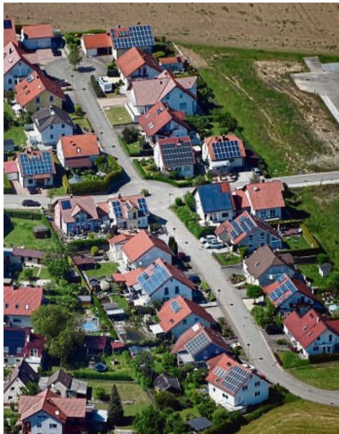
Solaranlagen auf Dächern sind eine beliebte Ergänzung des Heizsystems oder zum Abfedern der hohen Stromkosten.

Denn die Heizwärme muss die Solaranlage ja schließlich im Winter produzieren, wenn die Sonneneinstrahlung von Natur aus gering ist. Auf die kalten Monate Oktober bis Februar entfallen