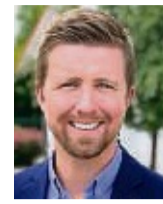
Daniel Faßhauer Bürgermeister

Faßhauer weist darauf hin, dass die Kommune von ihren Bürgern keine Straßenausbaubeiträge einzieht – die finanzielle Entlastung der Habichtswalder bedeutet im Umkehrschluss aber auch, dass bei der Reparatur von Straßen und Wegen Geld aus dem Haushalt entnommen werden muss. Doch die Mittel