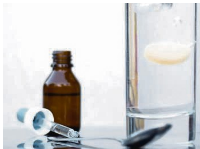
Eine sichere Medikation ist entscheidend für vermeidbare Schäden im Gesundheitswesen.

Bad Wildungen/Melsungen/Schwalmstadt. Auch in diesem Jahr beteiligen sich die Asklepios-Kliniken in Nordhessen am Welttag der Patientensicherheit. Dieser findet jährlich am 17. September statt und wurde von der Weltgesundheitsorganisation (WHO) und dem Aktionsbündnis Patientensicherheit ins Leben gerufen. Mit zahlreichen Aktionen soll das Bewusstsein für eine sichere Medikation geschärft werden.