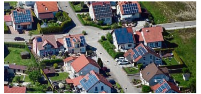
Solaranlagen auf Dächern sind eine beliebte Ergänzung des Heizsystems oder zum Abfedern der hohen Stromkosten.

„Die zweite Heizung, egal ob Gasheizung, Wärmepumpe oder etwas anderes, kann dann einige Monate lang ausgeschaltet bleiben.“ Beim Blick auf die Zahlen muss auch der energetische Zustand eines Gebäudes berücksichtigt werden: Im schlecht gedämmten Altbau schafft eine Solarthermieanlage laut Körnig mindestens 20 Prozent, meist mehr als 30 Prozent des Bedarfs von Heiz- und Brauchwasser über das ganze Jahr. „In gut gedämm-