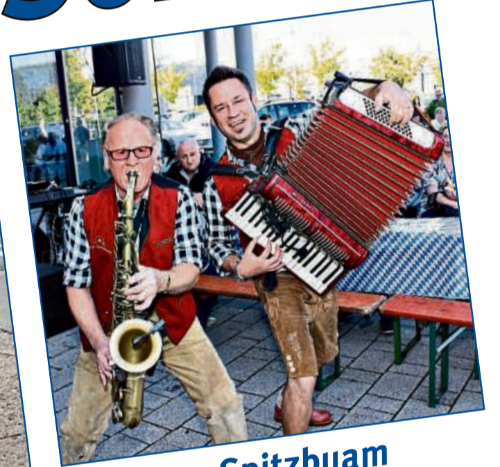
Die Zwoa Spitzbuam