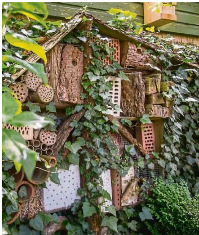
Ein Zimmer bitte! Ein Insektenhotel ist die nahe liegende und meist eine hübsche Lösung, um winzigen Bewohnern des Gartens ein Quartier fürs Brüten und Überwintern zu geben.