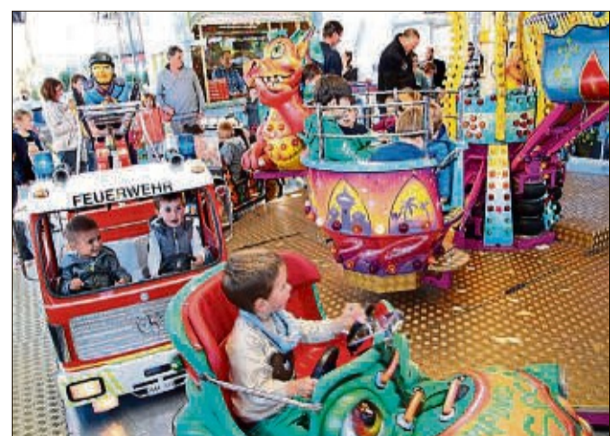
Zahlreiche Fahrgeschäfte sorgen für Jahrmarkt-Atmosphäre.

de, im bayrischen Festzelt auf dem Schlachthofgelände sowie