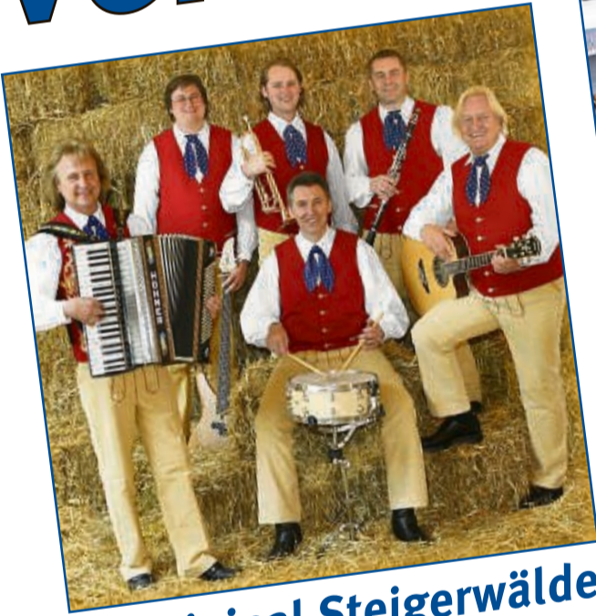
Die Original Steigerwälder