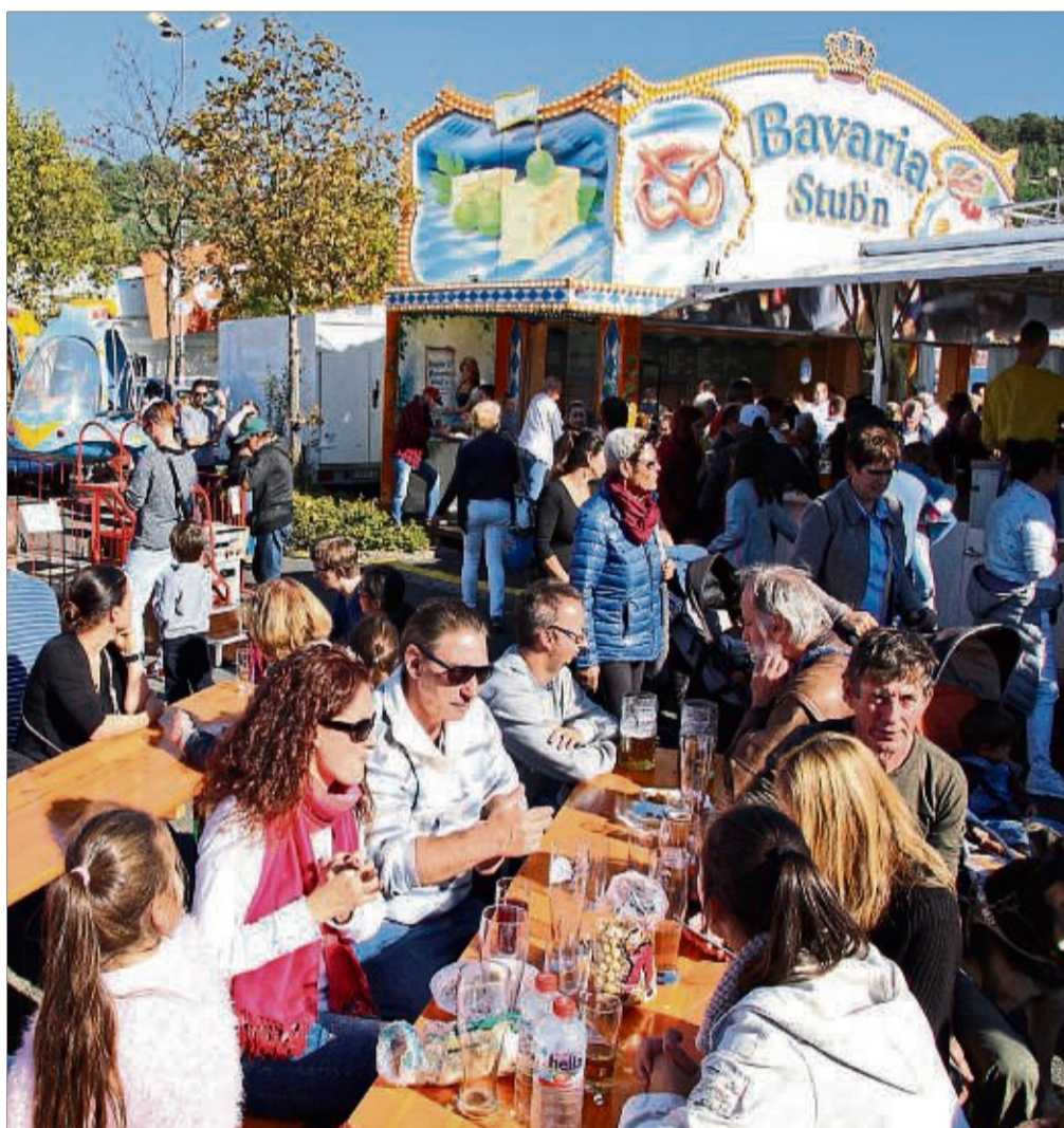
Jede Menge Besucher werden wieder beim Oktoberfest erwartet.

Das Fest im Kaufpark ist seit Jahren ein toller Treffpunkt: Freunde, Bekannte und Familien genießen die Atmosphäre auf dem ganzen Außengelän-