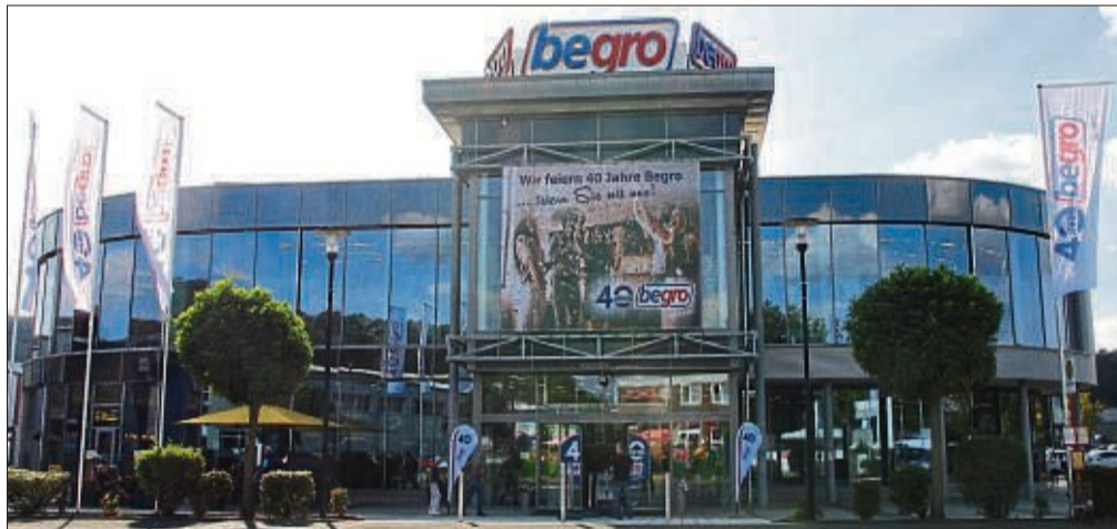
Begro feiert 40. Geburtstag. Dies hat das Modehaus mit allen Kundinnen und Kunden groß gefeiert. Aktuell gibt es noch tolle Sonderangebote zu entdecken.

Das Modehaus Begro präsentiert topaktuelle Modetrends für die bevorstehende kalte Jahreszeit – und feiert zum Oktoberfest im Kaufpark Wehrda weiterhin seinen 40. Geburtstag.