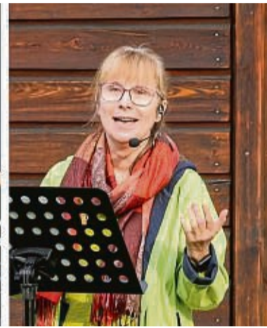
Zum Auftakt der Veranstaltungsreihe ist das Orpheus-Trio am 18. September im Frankenger Rathausaal zu Gast.