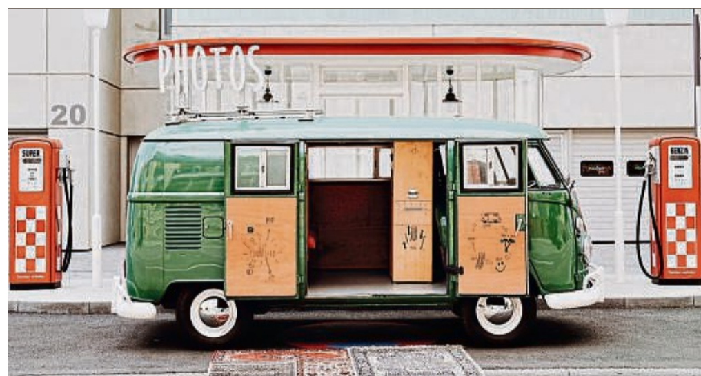
Ein perfekter Spot für Fotofreunde: In dem Retro-Bulli können sich die Gäste am Samstag, 17. September, mit ihrem Outfit perfekt in Szene setzen.

Genießen Sie die Volksfest-Atmosphäre auch rund um das Modehaus. Begro hat am Sonntag (25. September) zum verkaufsoffenen Sonntag von 12 bis 18 Uhr geöffnet.