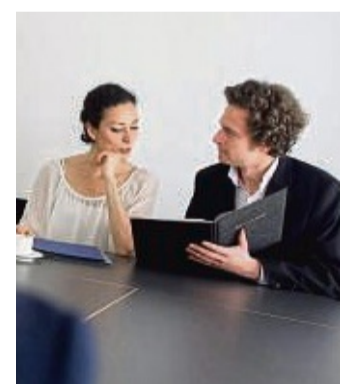
Immer häufiger stimmen Stellenanforderungen und Bewerberprofile nicht überein. Ein Lösungsansatz: Weiterbildungen.

Fazit der Untersuchung: Bevor Firmen eine Stelle angesichts von Arbeitskräfte-