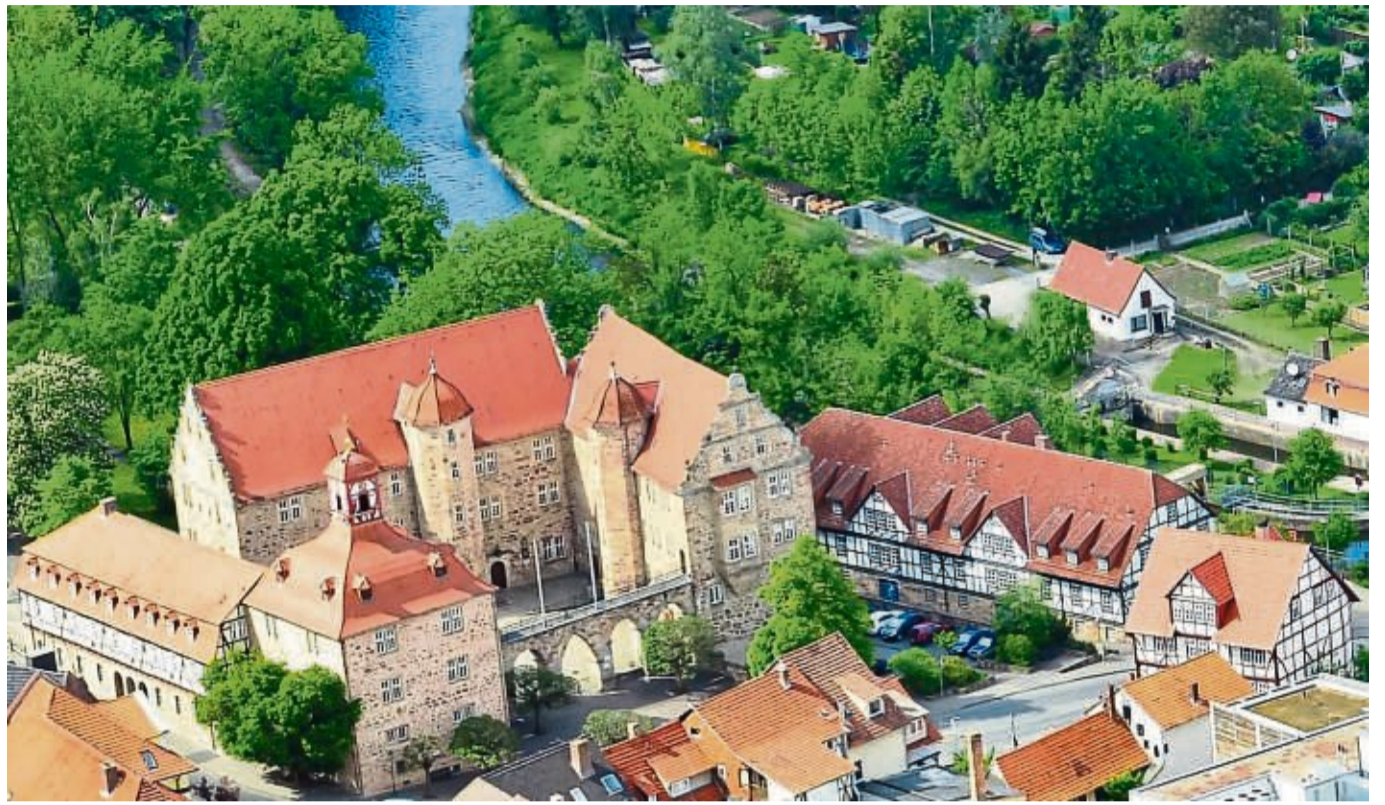
Seit Beginn des Monats wird das Landgrafenschloss nicht mehr beleuchtet.

Eschwege – Um Energie zu sparen, wird seit dem 1. September das Landgrafenschloss in Eschwege in den Abend- und Nachtstunden nicht mehr beleuchtet. Das teilte die Kreisverwaltung nun mit. Auch sei die Be-