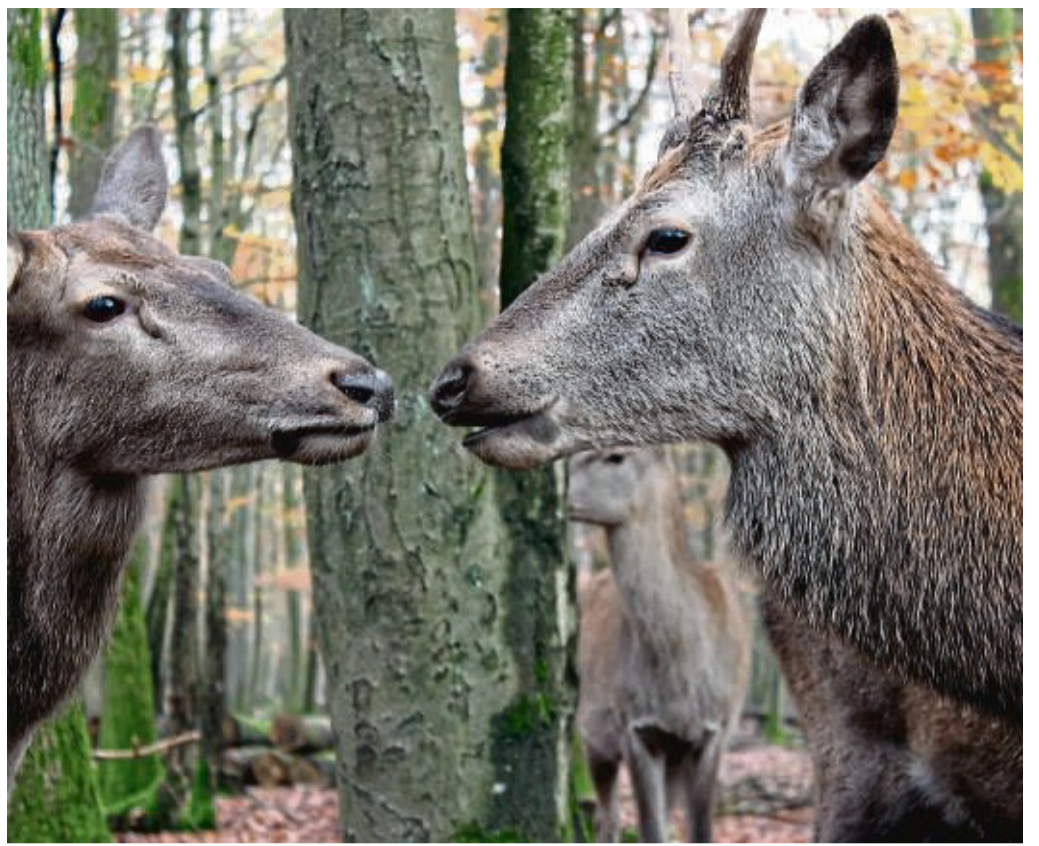
Weltkindertag: Am 20. September gibt es viele Aktionen im Bergwildpark Meißner rund um die Kinder- und Jugendrechte.