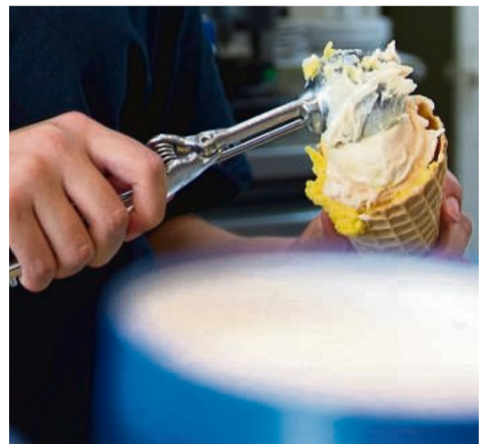
Wenn Schüler in den Ferien in einer Eisdiele arbeiten, müssen sie bestimmte Arbeitszeiten einhalten.

Unter bestimmten Voraussetzungen dürfen Jugendliche auch mehr als 520 Euro pro Monat verdienen, allerdings darf der Ferienjob dann höchstens drei Monate oder 70 Tage im Jahr dauern - denn nur dann handelt es sich um eine kurzfristige Beschäftigung. tmn