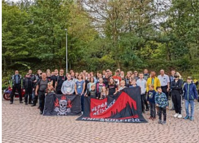
Hatten einen rasanten Tag: Die Schüler der Paul-Moor-Schule mit ihrem motorisiertem Besuch.