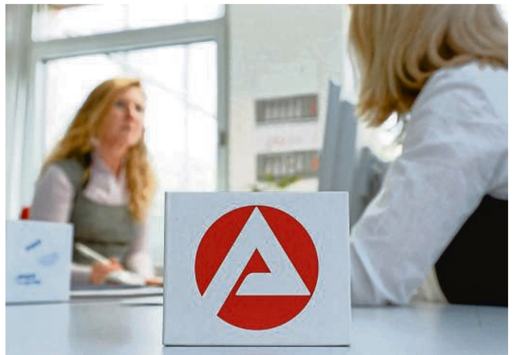
Jobcenter oder privater Arbeitsvermittler? Es gibt verschiedene Hilfsangebote.

Jobsuchende, die sich an eine private Arbeitsvermittlung wenden, gehen rechtlich keinerlei Verpflichtungen ein. Generell sollten sie eine Kopie ihres Aktivierungs- und Vermittlungsgutscheins machen und der privaten Arbeitsvermittlung aushändigen. „Möglich ist, dass Jobsuchende mehrere Kopien machen und auch mehrere private Arbeitsver-