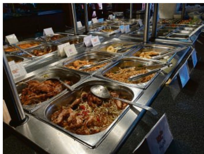
Hier ist für jeden etwas dabei: das Buffet vom Restaurant China-Pavillon.

durchgehend von 11 bis 23 Uhr. Mittwochs ist Ruhetag. Weitere Infos und Reservierungen unter 0 56 51/3 33 55 28. (ulk)