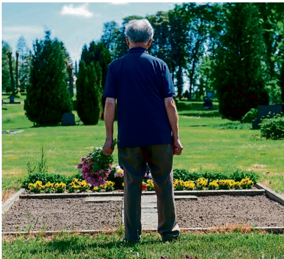
Sich selbst Zeit geben: Den Verlust eines geliebten Menschen zu überwinden, ist ein langwieriger Prozess.

Um sich selbst oder andere trauernde Menschen in dieser Situation besser verstehen zu können, ist es hilfreich zu wissen, wie Trauer funktioniert. Die Psychologin Verena Kast hat vier Phasen identifiziert, die für den Trauerprozess typisch sind. Auch wenn es im ersten Moment nicht so scheint, gilt: Auch Trauerprozesse haben einen Anfang und ein Ende. Der Beginn der Trauerbewältigung ist der Verlust eines Menschen, auf welche Weise dieser im Einzelfall verläuft, ist entscheidend für den Verlauf des Bewältigungsprozesses.