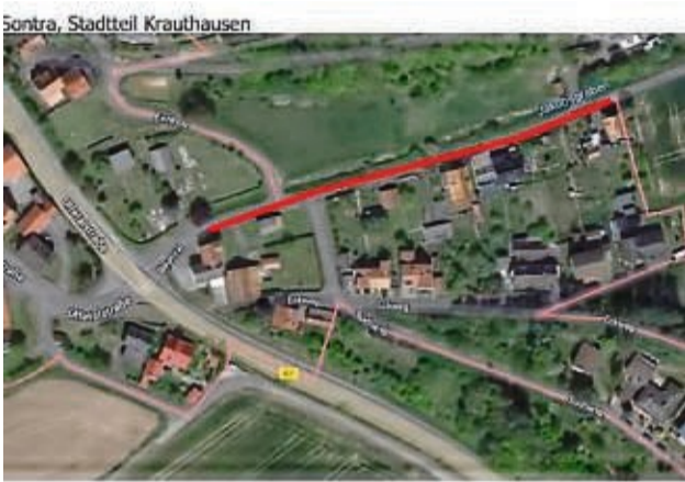
Baumtal wird erneuert: Die Bauarbeiten finden in diesem Bereich statt.

Die Stadt Sontra erneuert in 2022 im Ortsteil Krauthausen Baumtal die Kanalisation, Wasserversorgung und den Straßenbau. Nachfolgende Arbeiten werden im Baumtal ausgeführt. • Neubau einer Kanal- Mischwasserleitung DN 250 PP mit Schachtbauwerken und Anschlussleitungen • Neubau einer Trinkwasserleitung DA 125 PEHD SDR 11 mit Anschlussleitungen • Grundhafter Ausbau der Anliegerstraße mit gepflastertem Gehweg