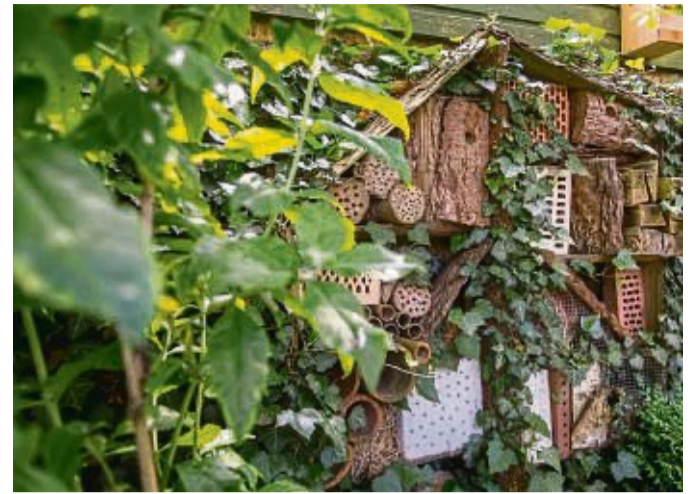
Ein Zimmer bitte! Ein Insektenhotel ist die nahe liegende und meist eine hübsche Lösung, um winzigen Bewohnern des Gartens ein Quartier fürs Brüten und Überwintern zu geben.