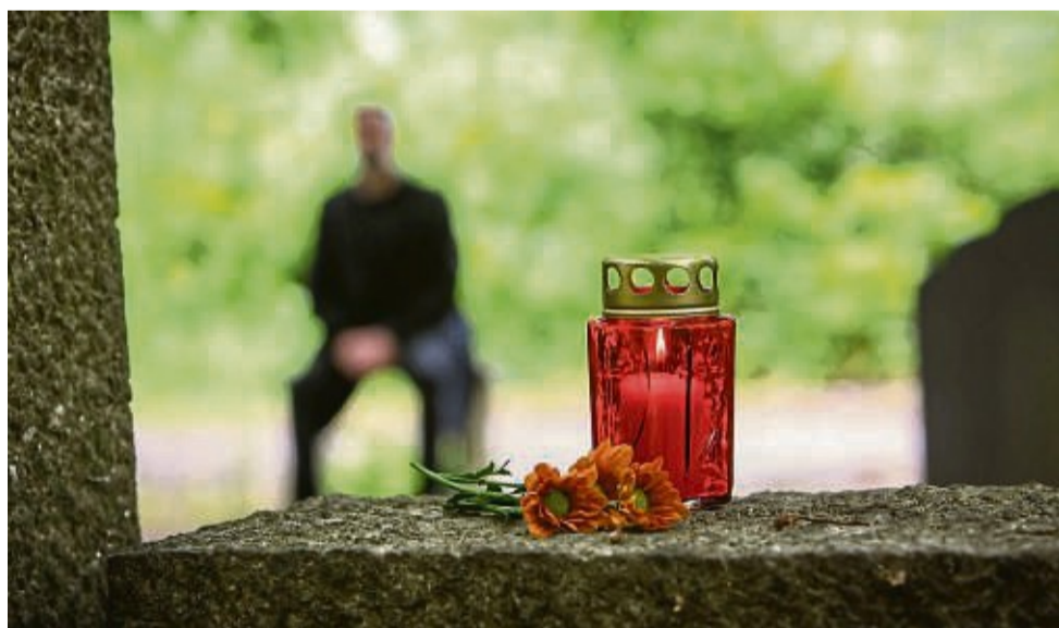
Auf sich selbst achten: Wichtig bei der Trauerbewältigung ist, dass man sich selbst nicht verliert.

Nachdem man getrauert hat, wütend war und seine Gefühle ausgelebt hat, kehrt allmählich der innere Frieden und die Ruhe zurück. Der Trauerprozess hat Spuren hinterlassen, meistens hat sich auch die Einstellung des Trauernden geändert. Der Verstorbene bleibt ein wichtiger Teil im Leben des Angehörigen, das nun aber