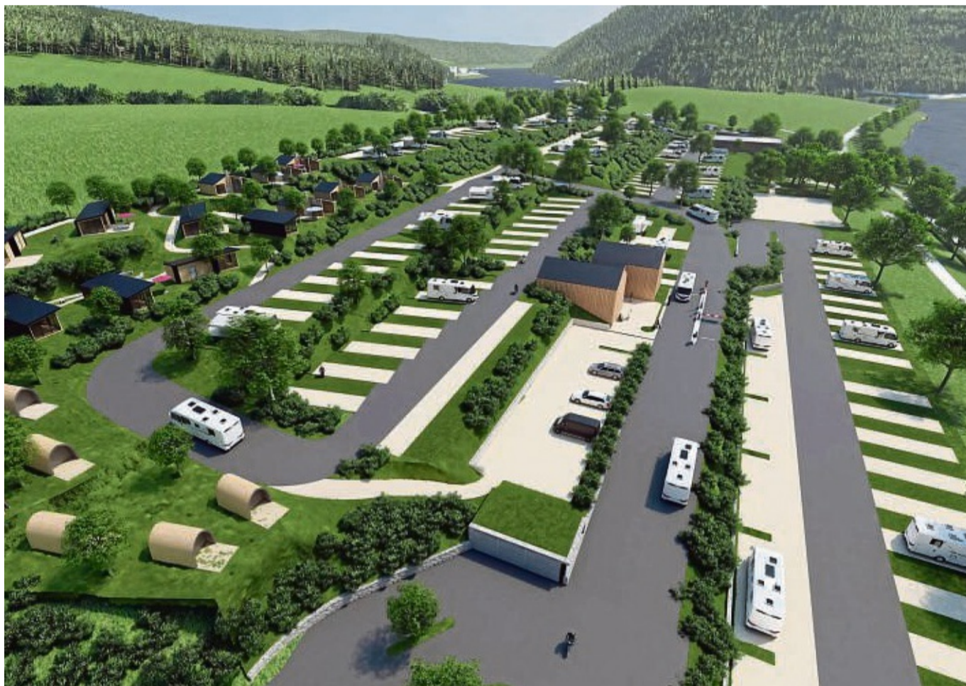
Der geplante „Wohnmobilhafen“ am Diemelsee in einer Visualisierung: Vorn liegt der Eingang mit der Rezeption. Unten links sind die „Camper-Pods“ zu sehen, die Wander-Häuser liegen oberhalb.

Die Wohnmobilsten seien in der Regel eine kaufkraftstarke Gruppe, die Wert auf Komfort und eine hochwertige Infrastruktur legten. Sie blieben nur relativ kurz und nutzten die Angebote vor Ort.