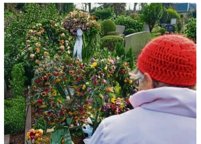
Grundsätzlich hat jeder die Wahl zwischen Beisetzung des Leichnams in einem Sarg oder nach der Einäscherung in einer Urne.

Rechtlich als Friedhöfe gelten auch die in den letzten Jahren verstärkt eingerichteten Bestattungswälder, in denen Aschebeisetzungen unter Bäumen durchgeführt werden. Aeternitas empfiehlt in dem Zusammenhang den „Leitfaden für den Trauerfall“ ( www.aeternitas.de/inhalt/publikationen ). Dieser gibt nützliche Hinweise. Hier hilft es, wenn Verstorbene ihre entsprechenden Wünsche bereits zu Lebzeiten bestimmt haben. Wer sich rechtzeitig damit auseinandersetzt, hat darüber hinaus die Gewissheit, dass die Bestattung nach den eigenen Vorstellungen abläuft. Festgelegt werden können