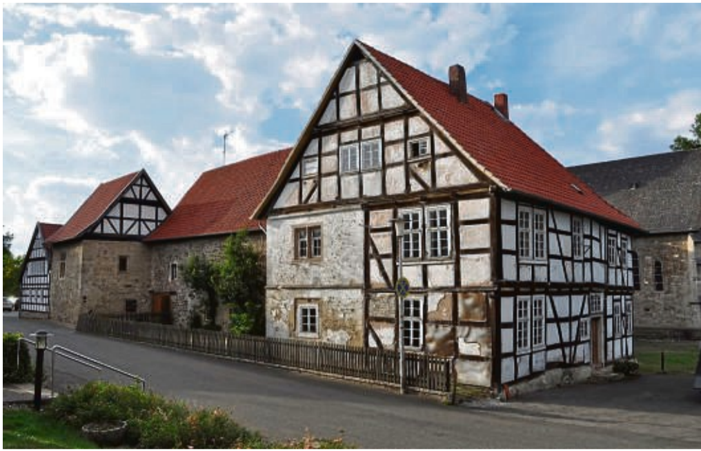
Sanierungsbedürftig: Das alte Rentmeister-Haus des Flechtdorfer Klosters muss noch hergerichtet werden.