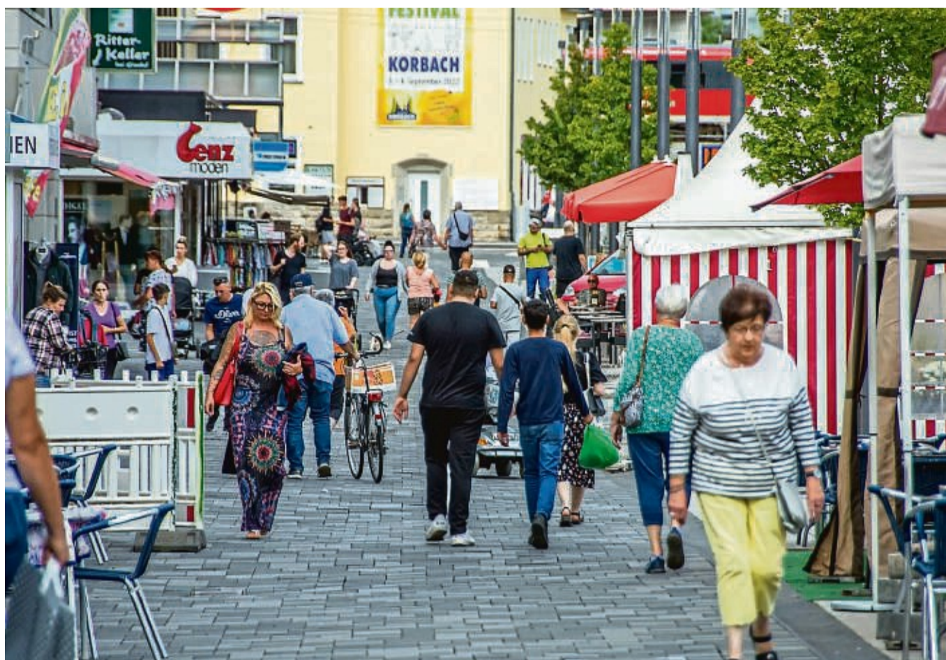
Lebendige Innenstadt: Der Einzelhandel in Korbach ist attraktiv für das Umland. Das belegen die Zahlen.

Eine Aufnahme ins Training ist jederzeit möglich. Betroffene können zum Trainingsangebot am 23. September, 16 bis 19 Uhr oder 24. September, 9 bis 12 Uhr im Treffpunkt in Korbach, Flechtdorfer Straße 11 erscheinen.